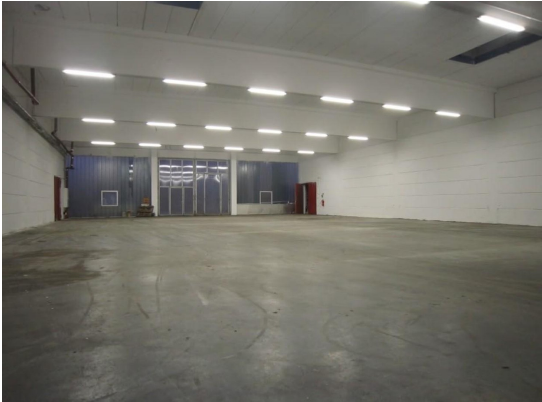
Lagerhalle 540m 2