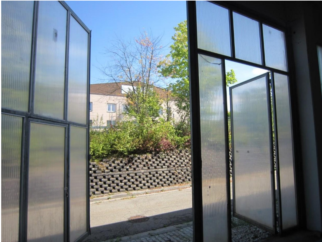
Lagerhalle 540m 2