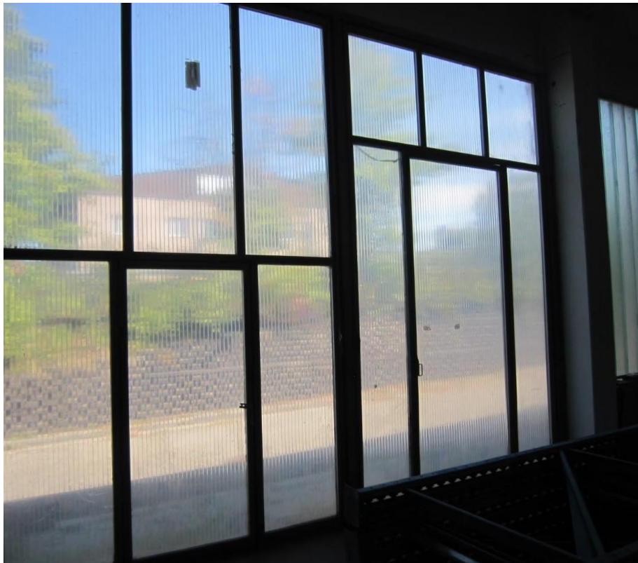
Lagerhalle 540m 2