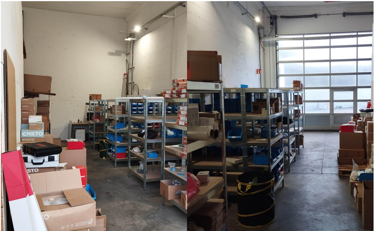
Lagerfläche 72m 2