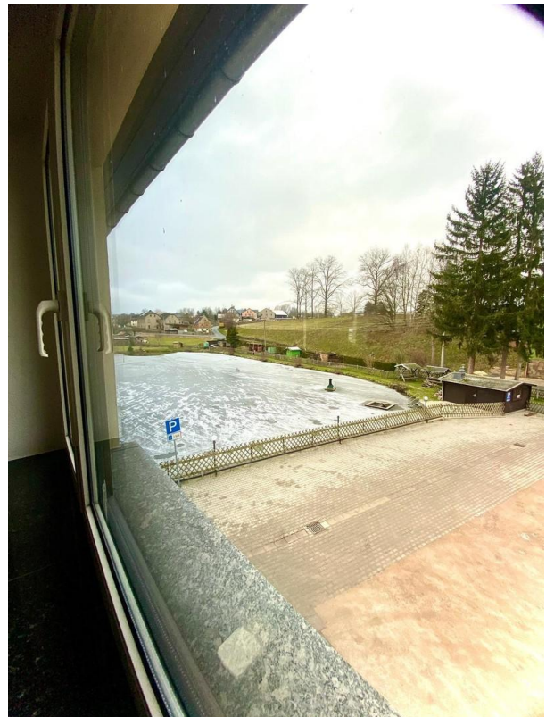
Blick aus dem Wohnzimmer