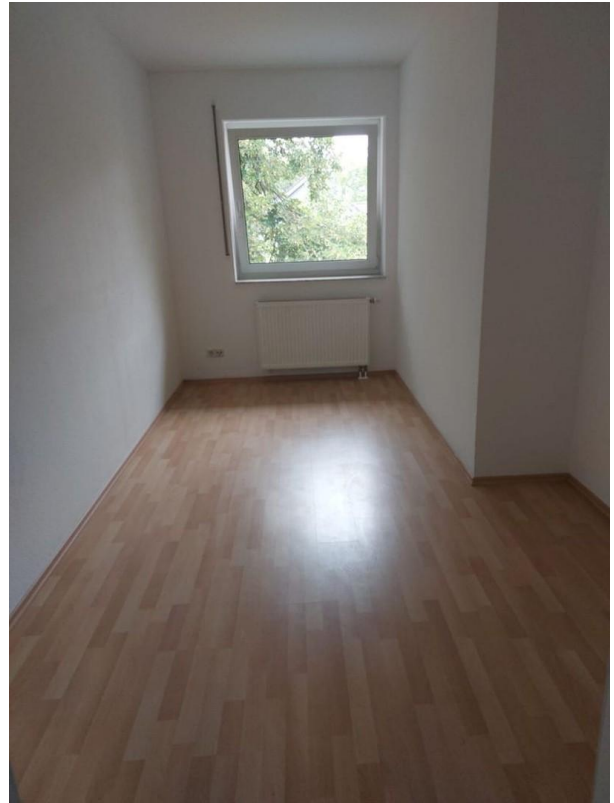
Raum - Beispiel