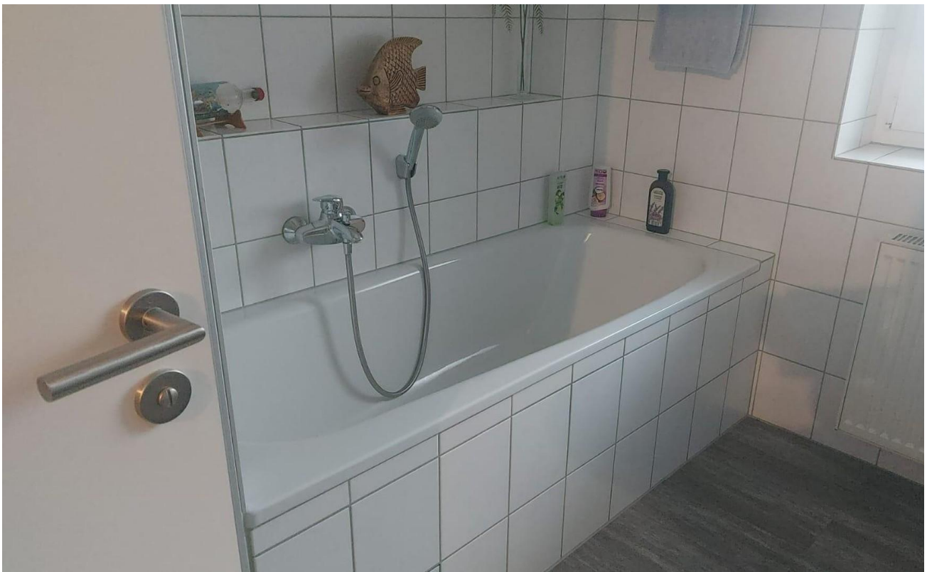
Bad - Originalbild