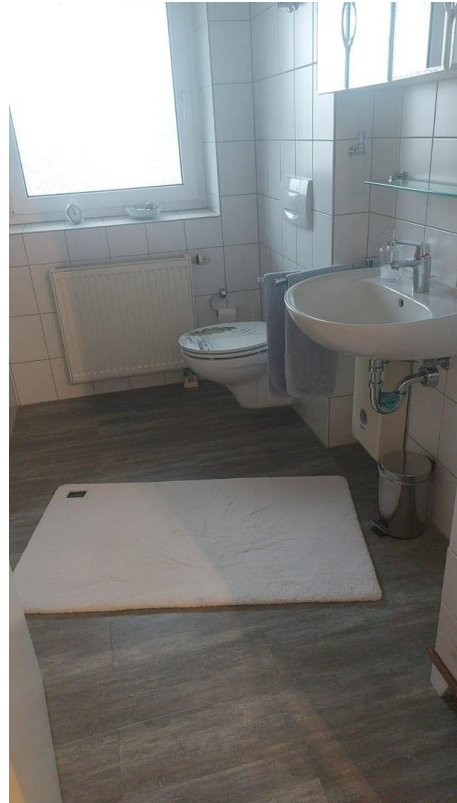
Bad - Originalbild