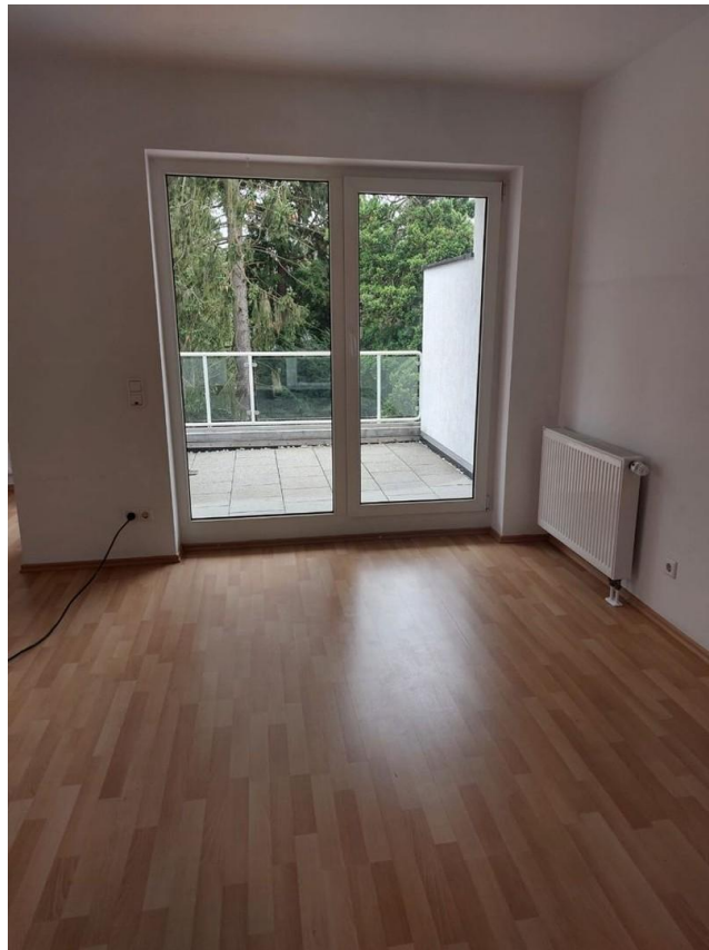
Balkon - Beispiel