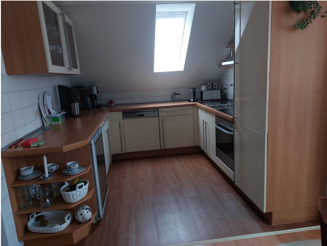
Küche - Originalbild