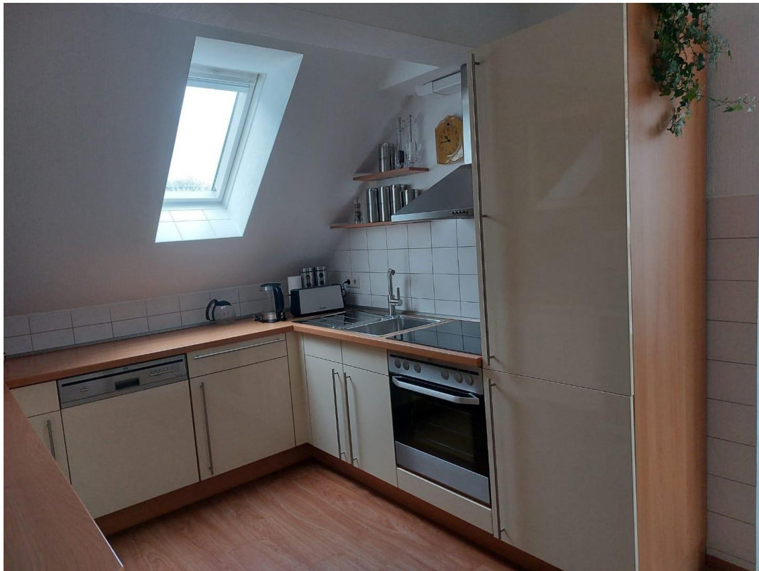
Küche - Originalbild