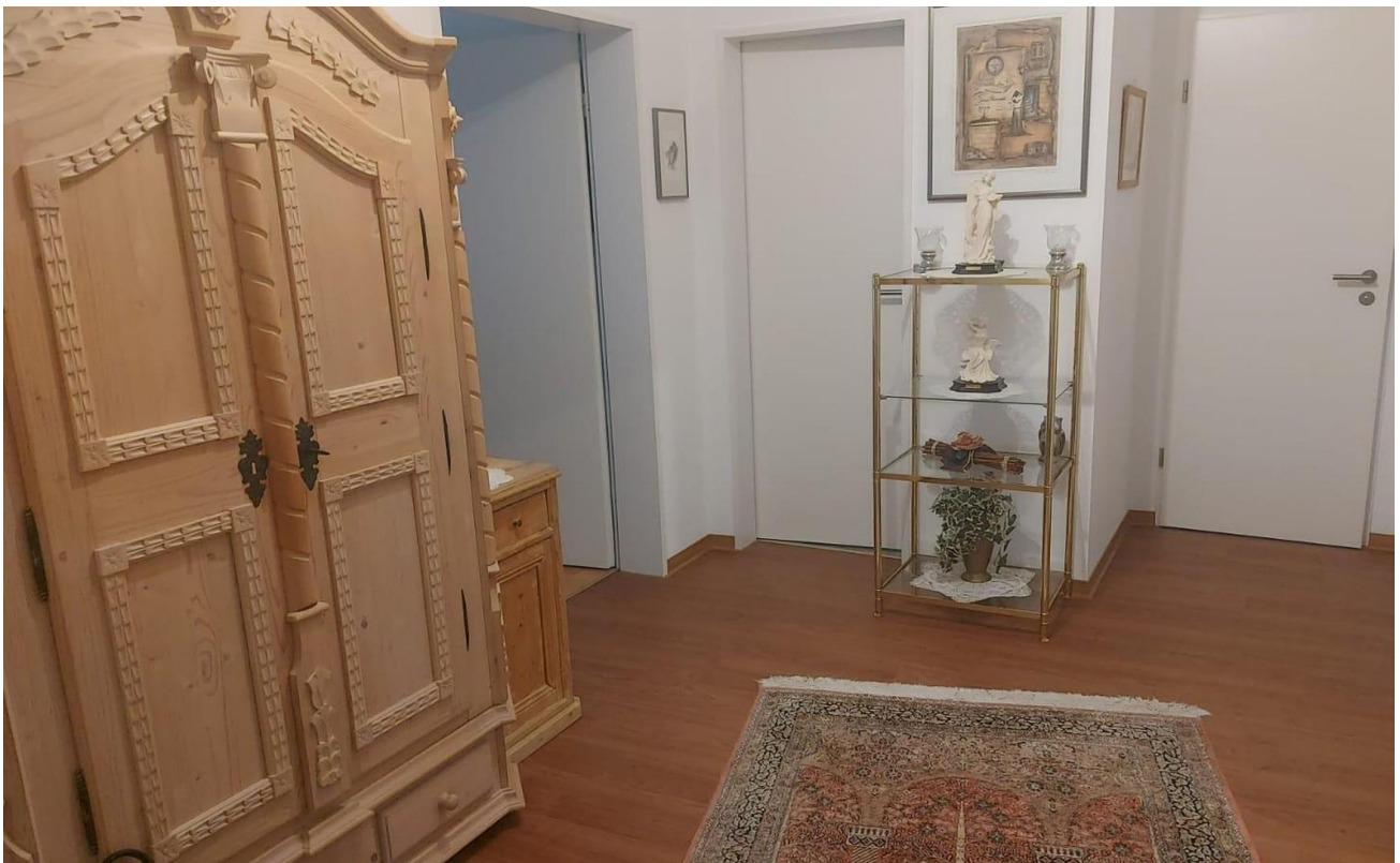
Diele - Originalbild