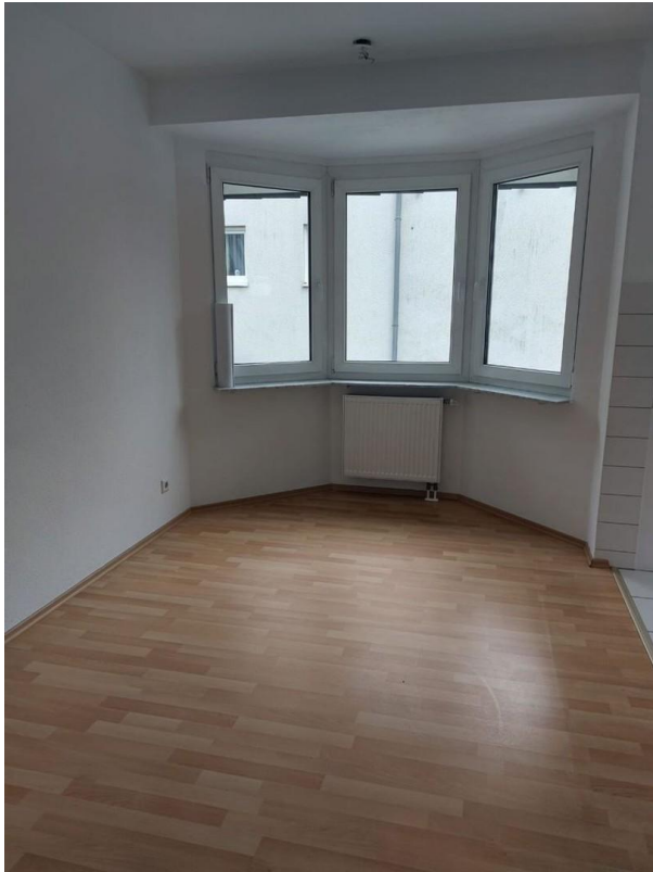
Wohnzimmer - Beispiel