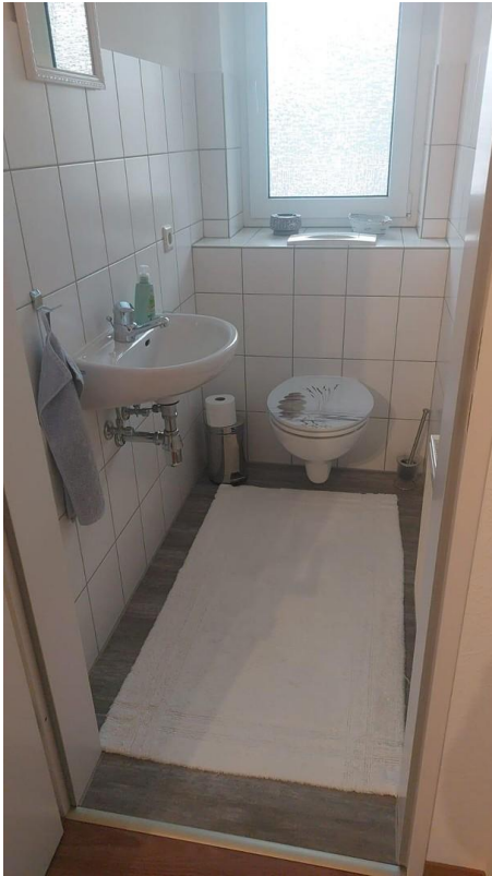
Gäste WC - Originalbild