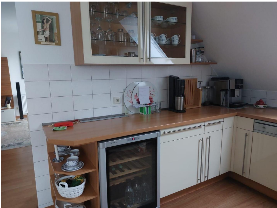
Küche - Originalbild