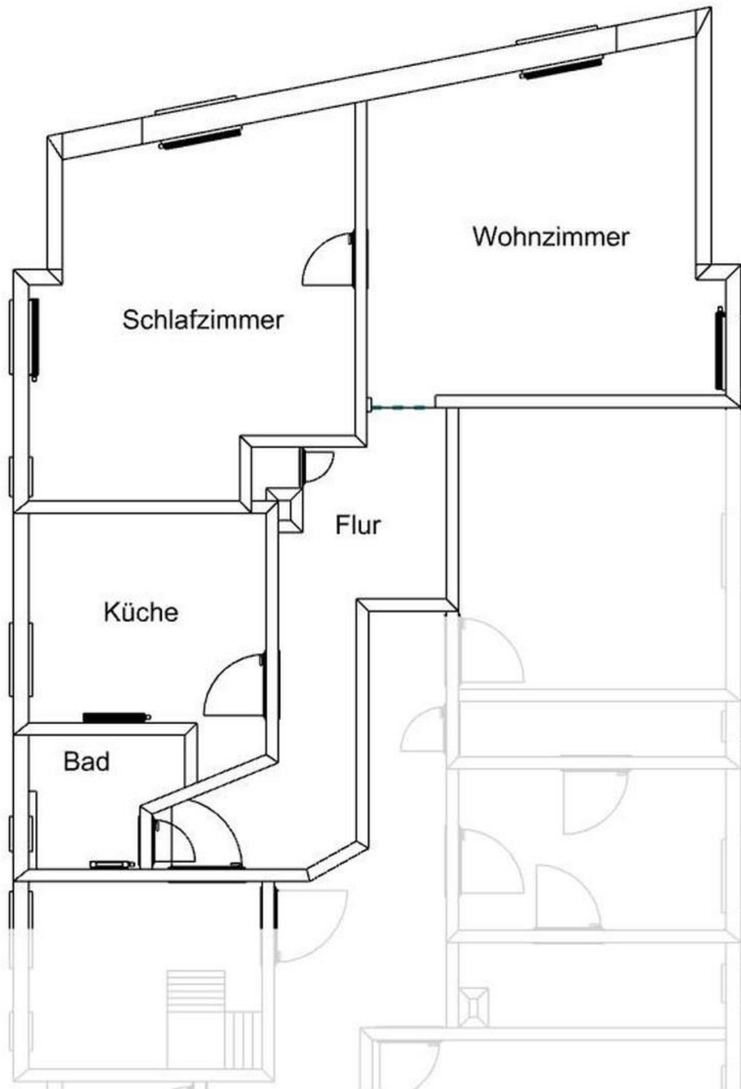
Grundriss der Wohnung