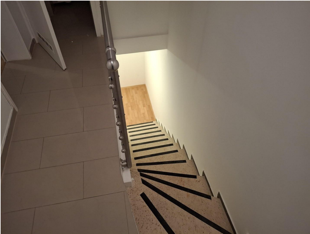
Treppe zum Untergeschoss