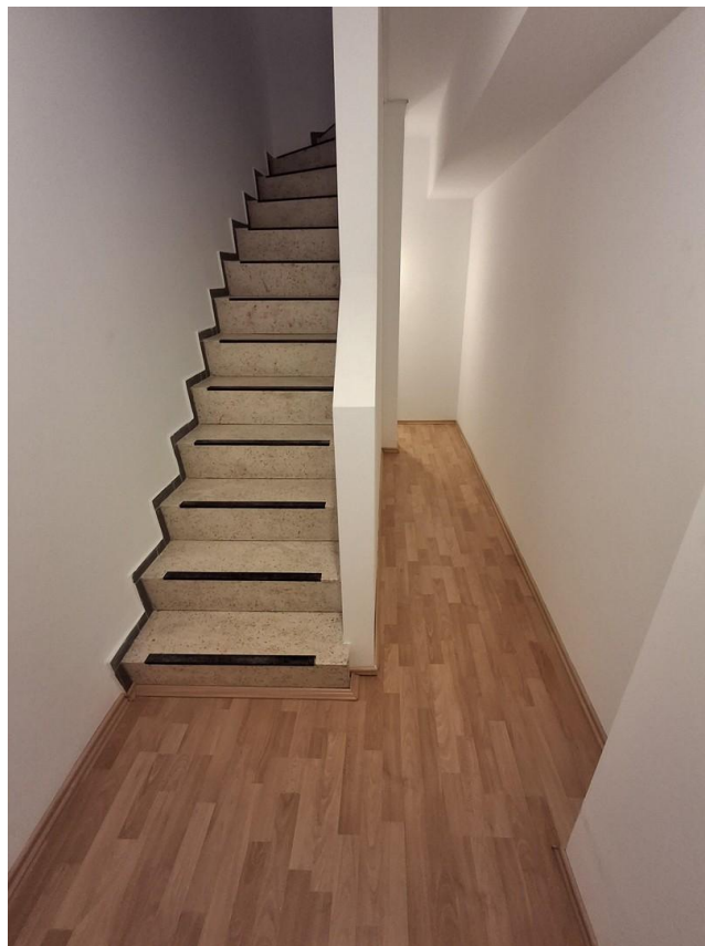
Abstellraum im Untergeschoss