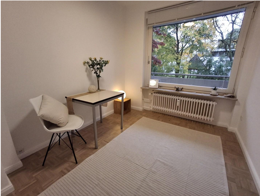
Arbeitszimmer / Gästezimmer