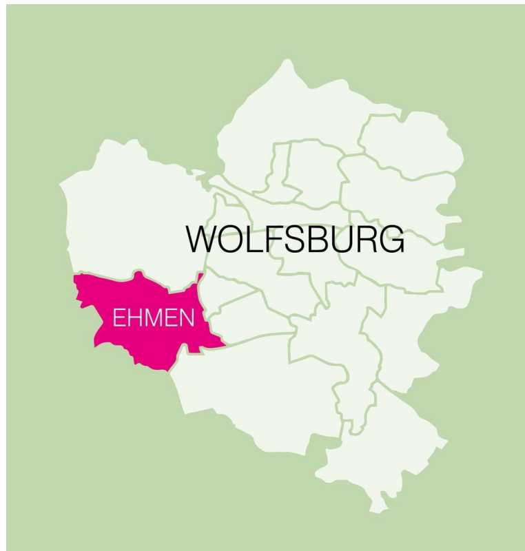
Wolfsburgs schönster Ort