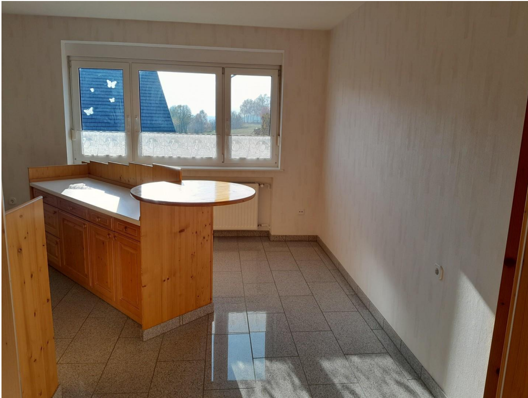
Küche 1 OG