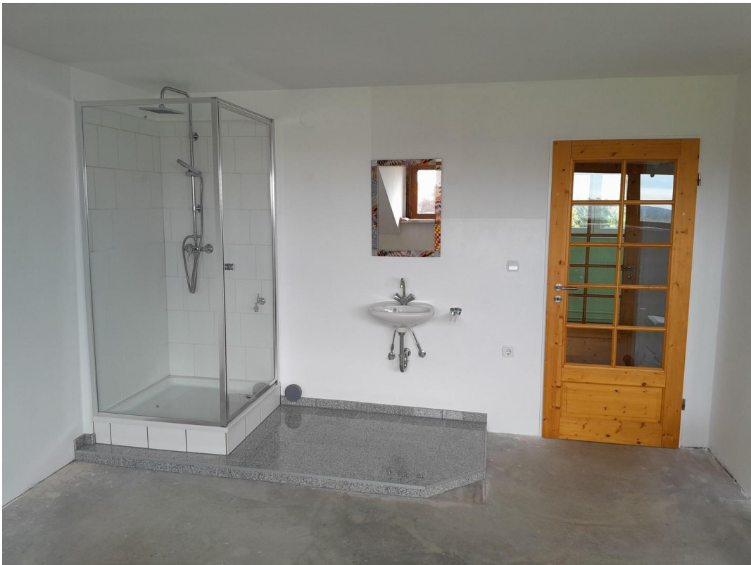
Zimmer Sauna/Fitness 2 OG