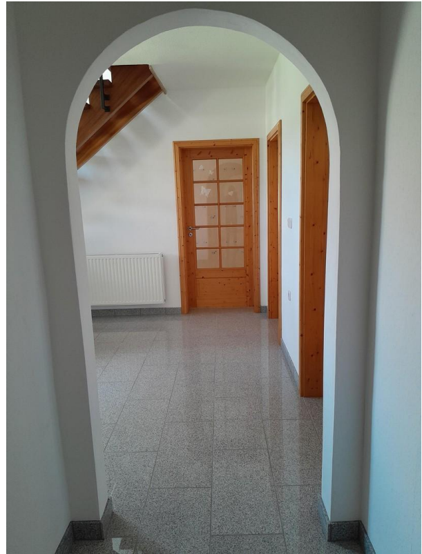
Diele 1 OG