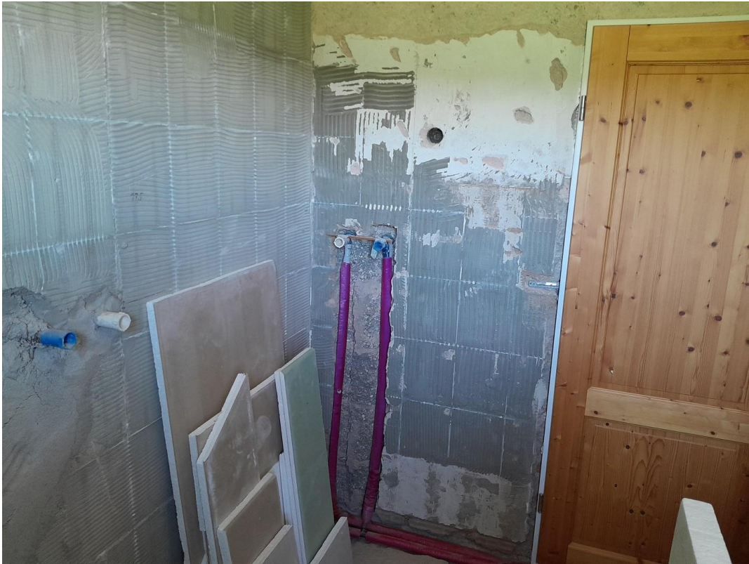
Dusche/WC 2 OG