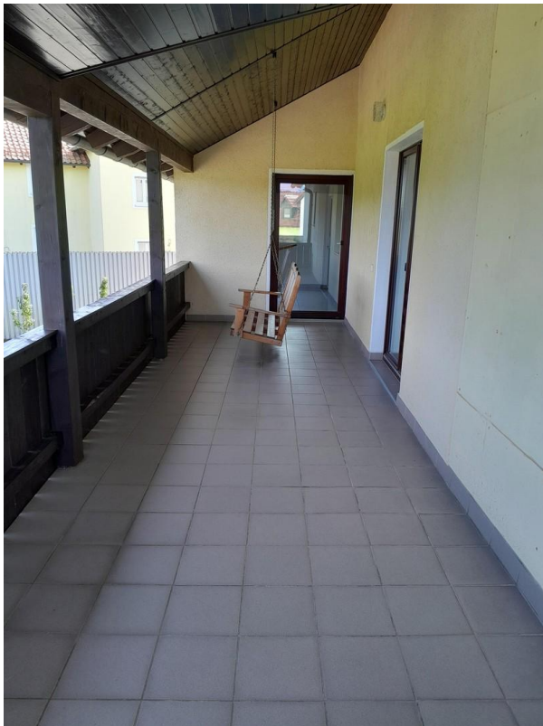
Terrasse 1 OG Nord/Ost