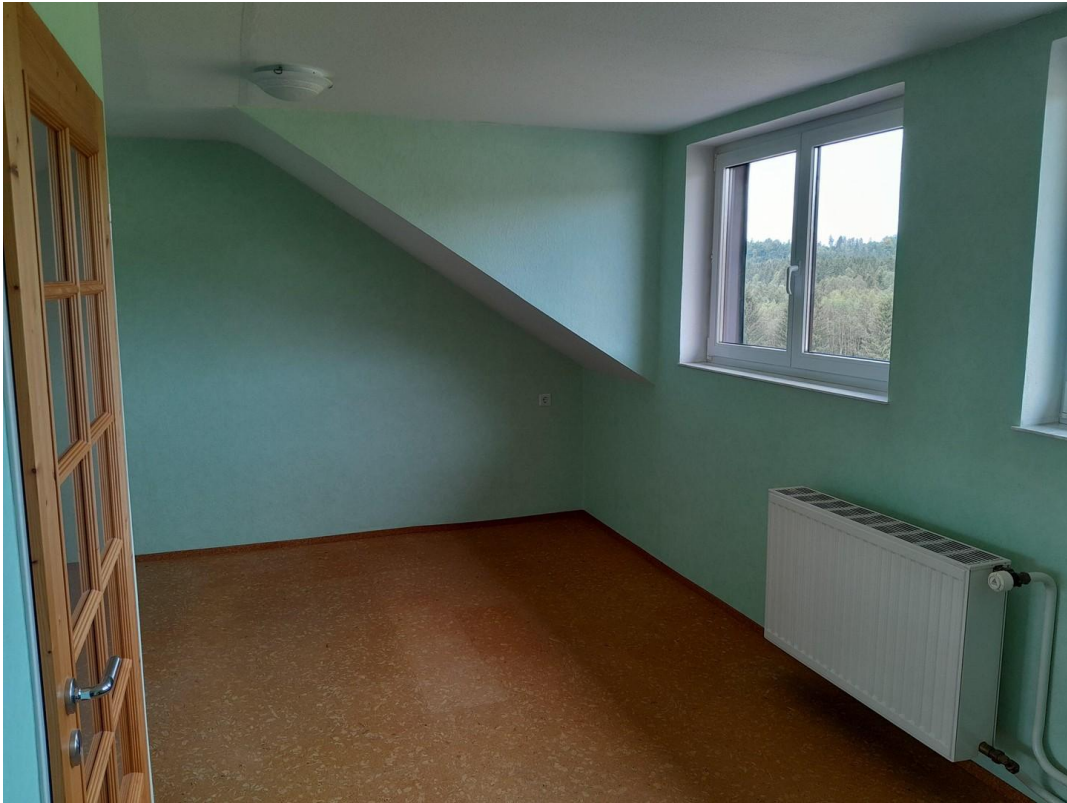
Zimmer 2 OG