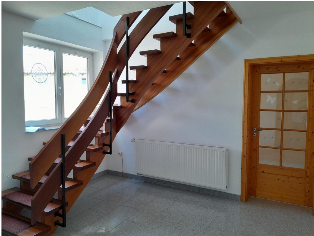
Diele 1 OG