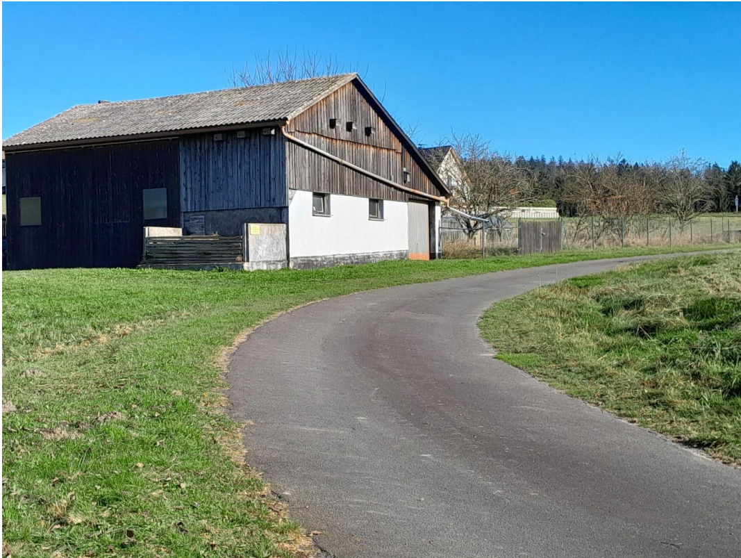
Scheune/Stallung mit Garten