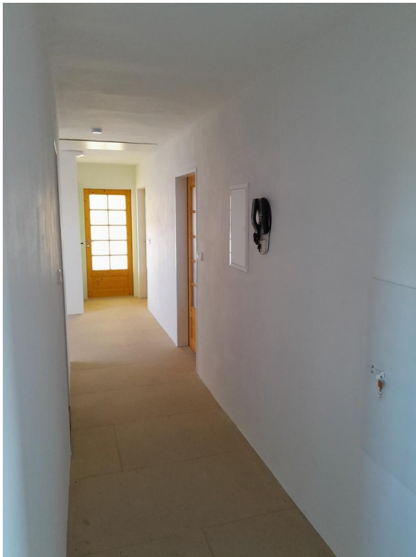
Diele 2 OG