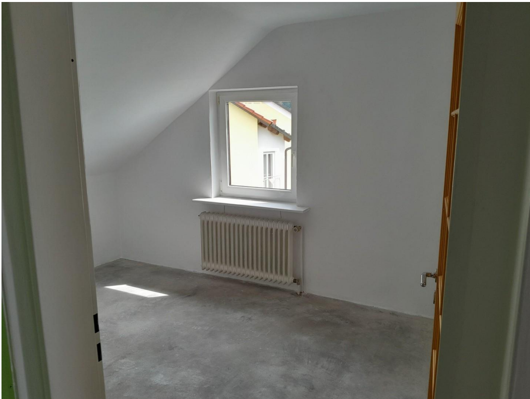
Zimmer 2 OG