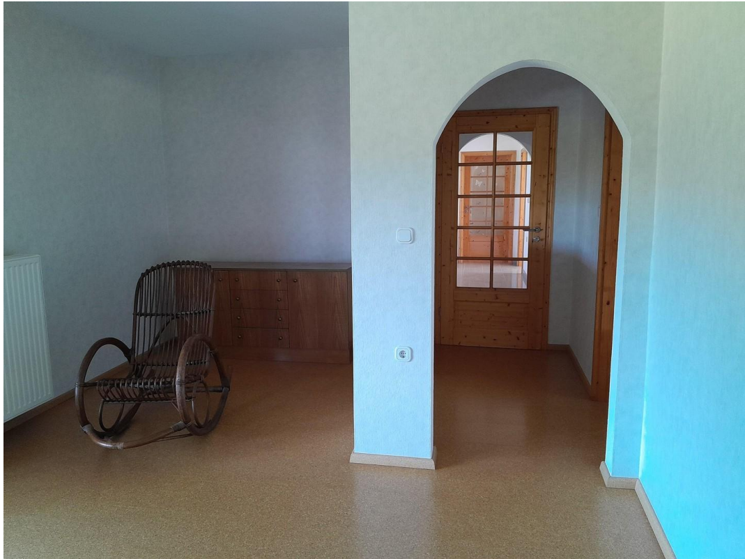
Zimmer 1 OG