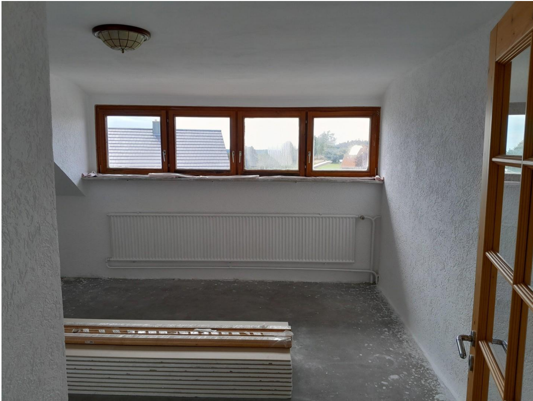
Zimmer 2 OG