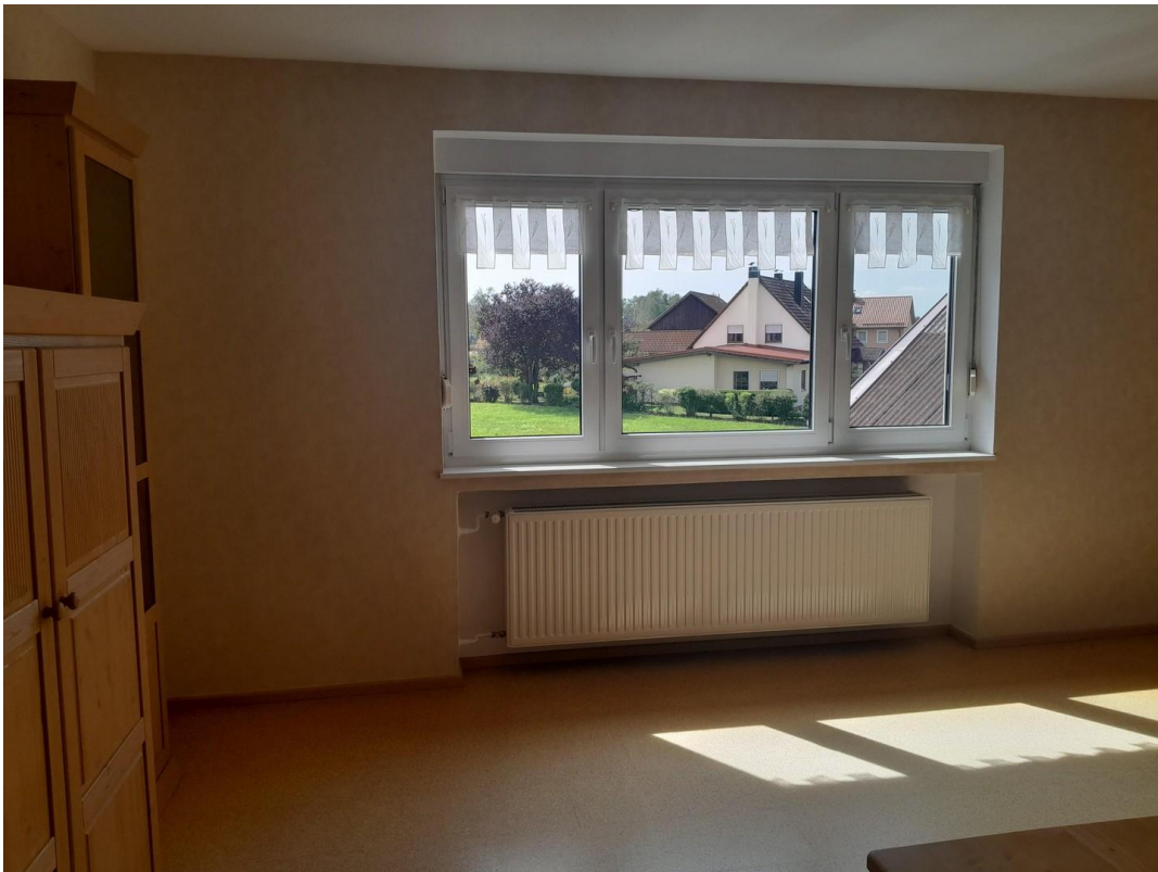
Zimmer 1 OG