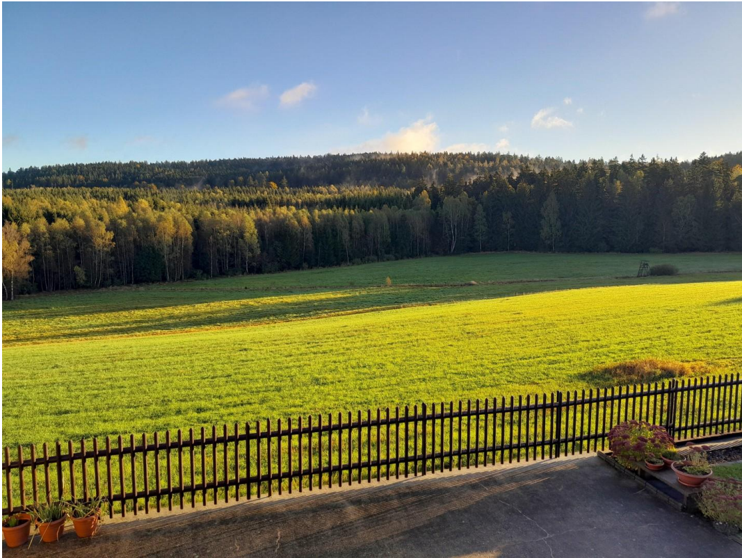
Blick zum Schellenberg