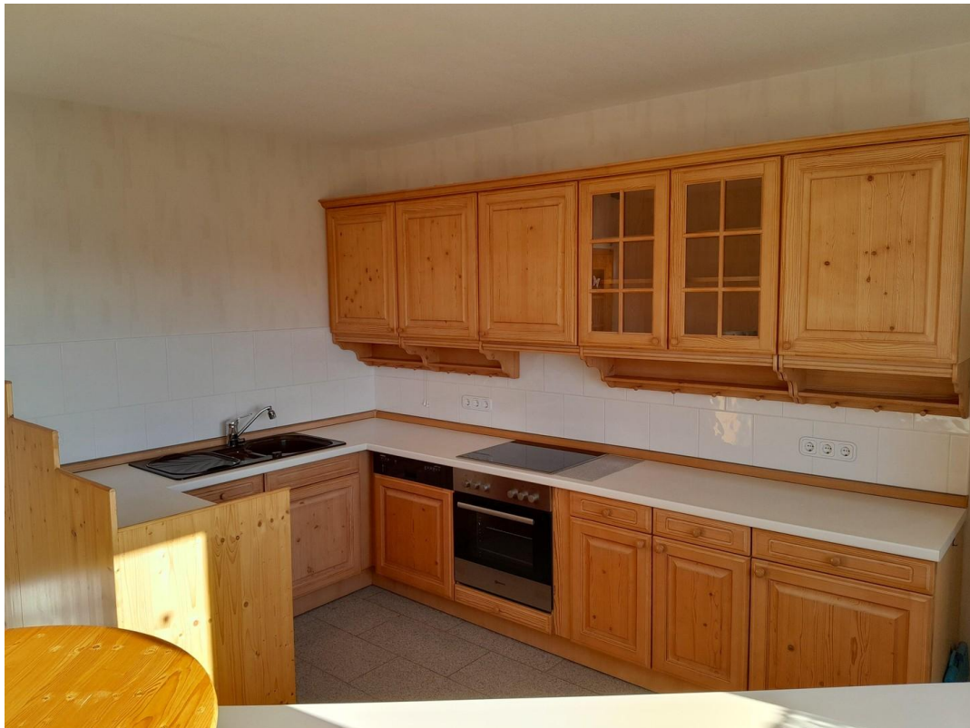
Küche 1 OG