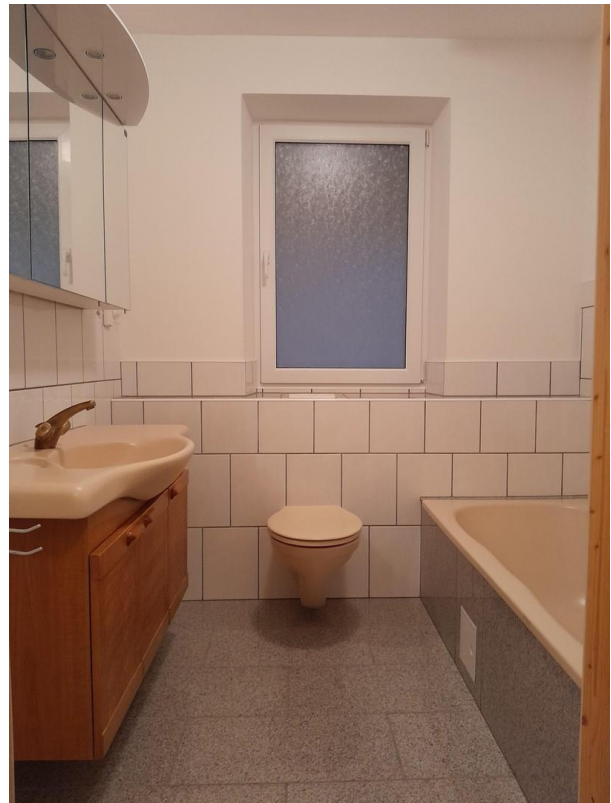
Bad 1 OG