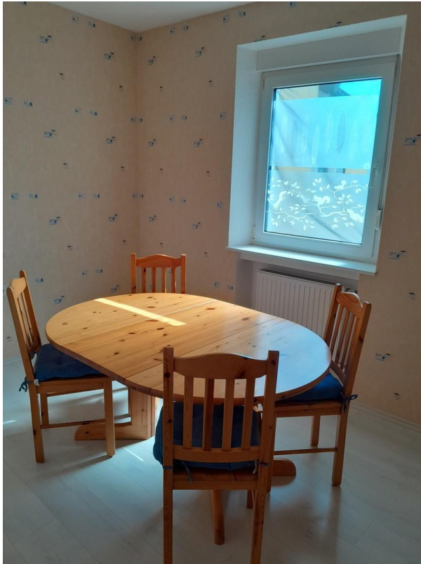
Zimmer 1 OG