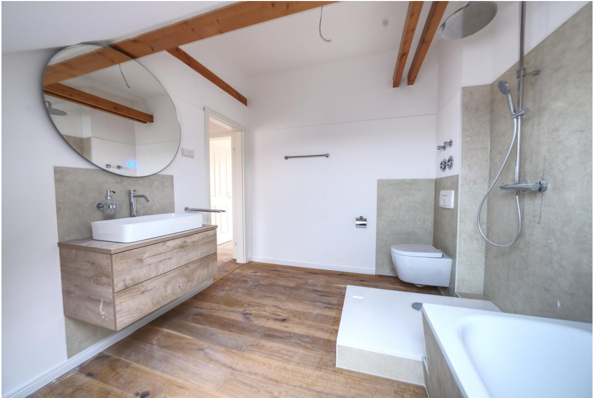
Waschtisch & Spiegel