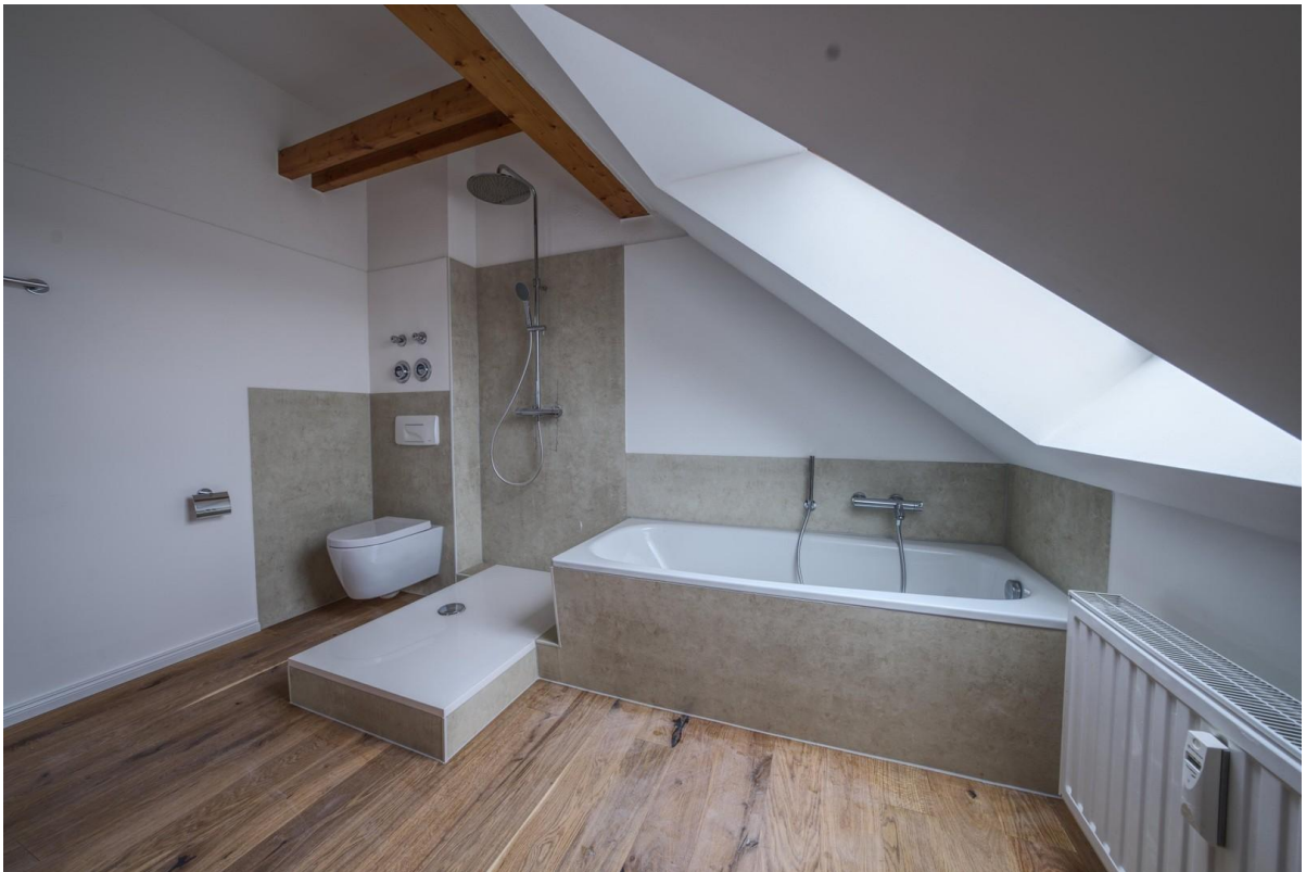
Badewanne & Dusche