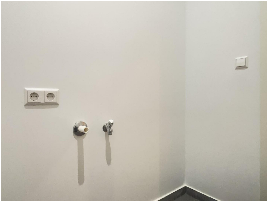
Waschmaschine und Trockner