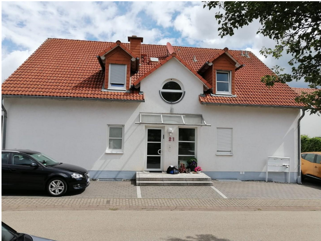
Außenbild 1, Aussenstellplätze