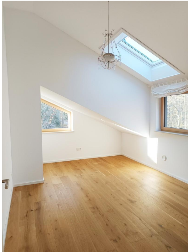
Zimmer 3 OG