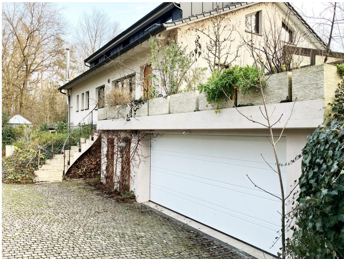
Garage mit Eingangstreppe