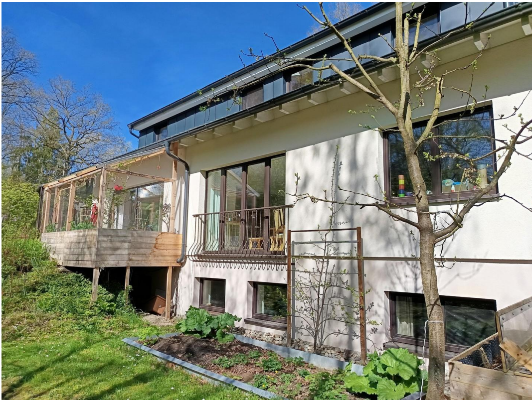
Südansicht mit Gemüsebeet