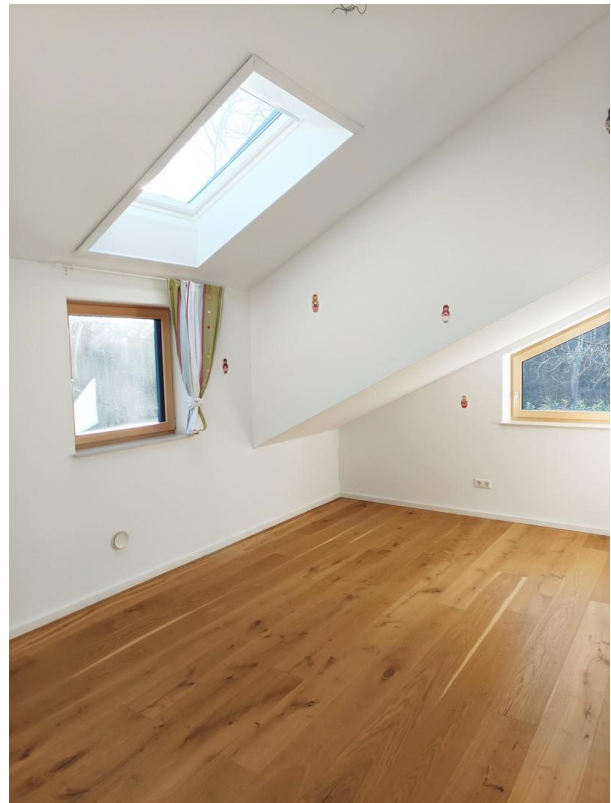
Zimmer 2 OG