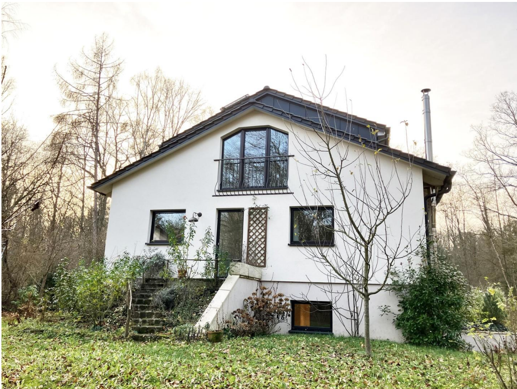
Ansicht von Ost