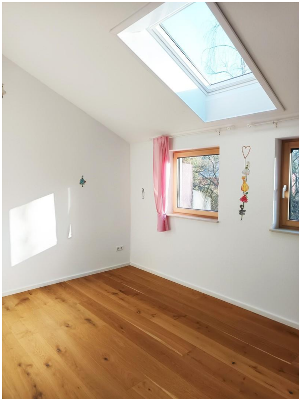
Zimmer 1 OG