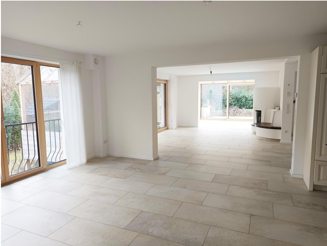
Ess-, Wohnzimmer, Wintergarten