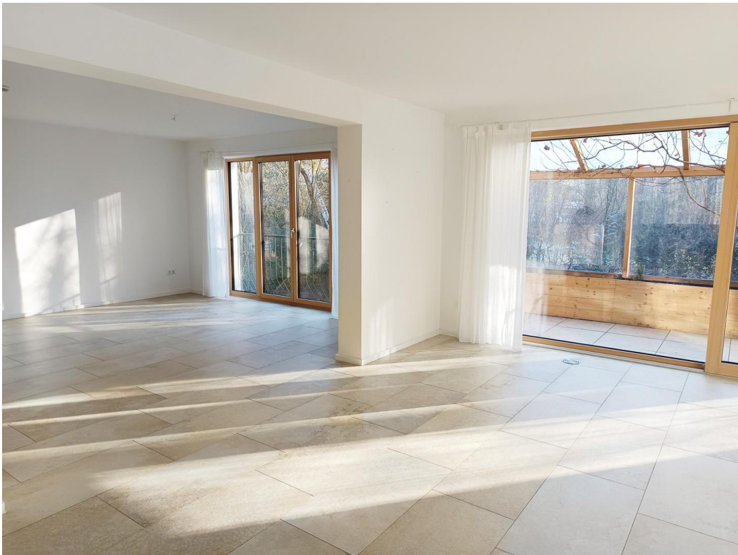
Wohn-, Essz., Kaltwintergarten