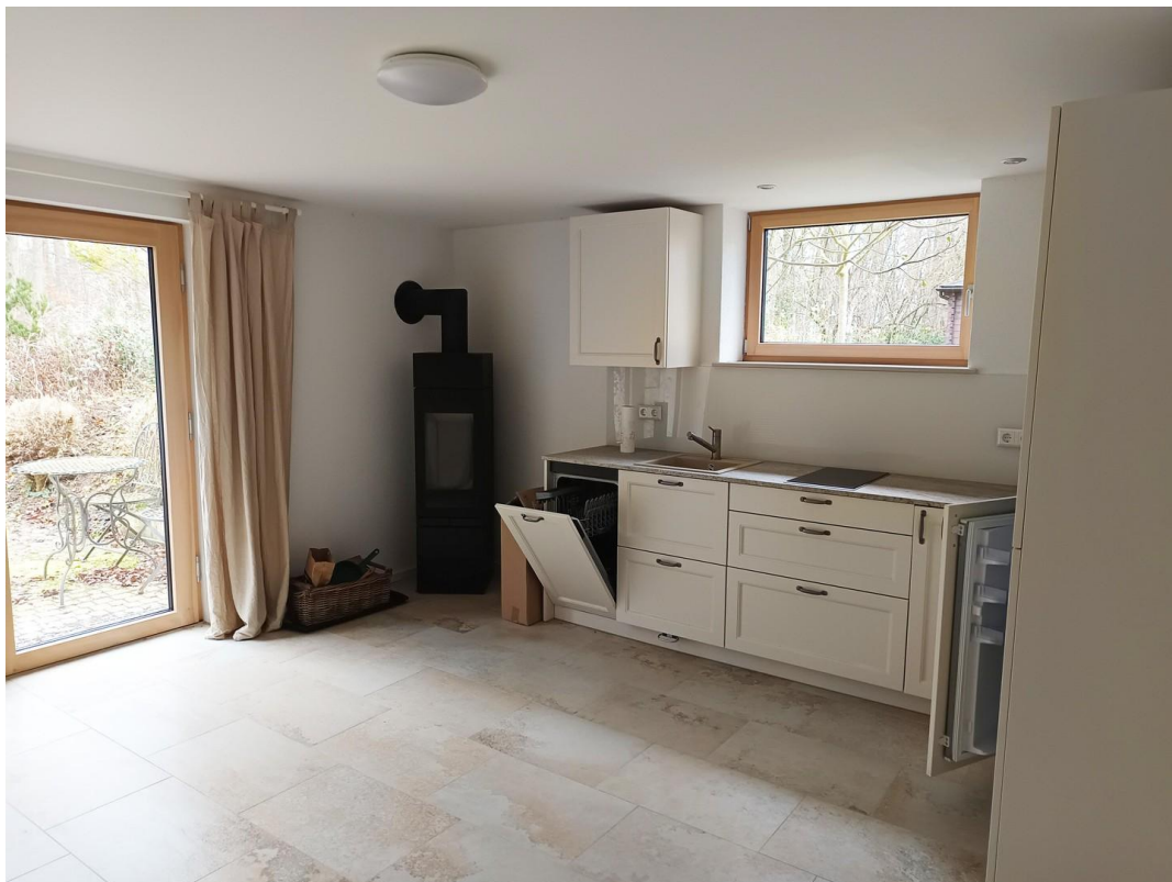
Wohnküche UG mit Kaminofen