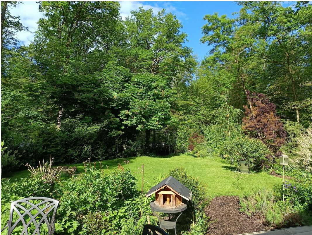
Garten West Sommer