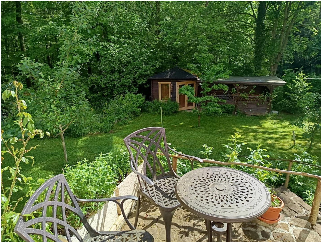
Garten Ost Sommer