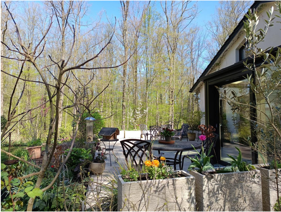
große Terrasse Frühjahr