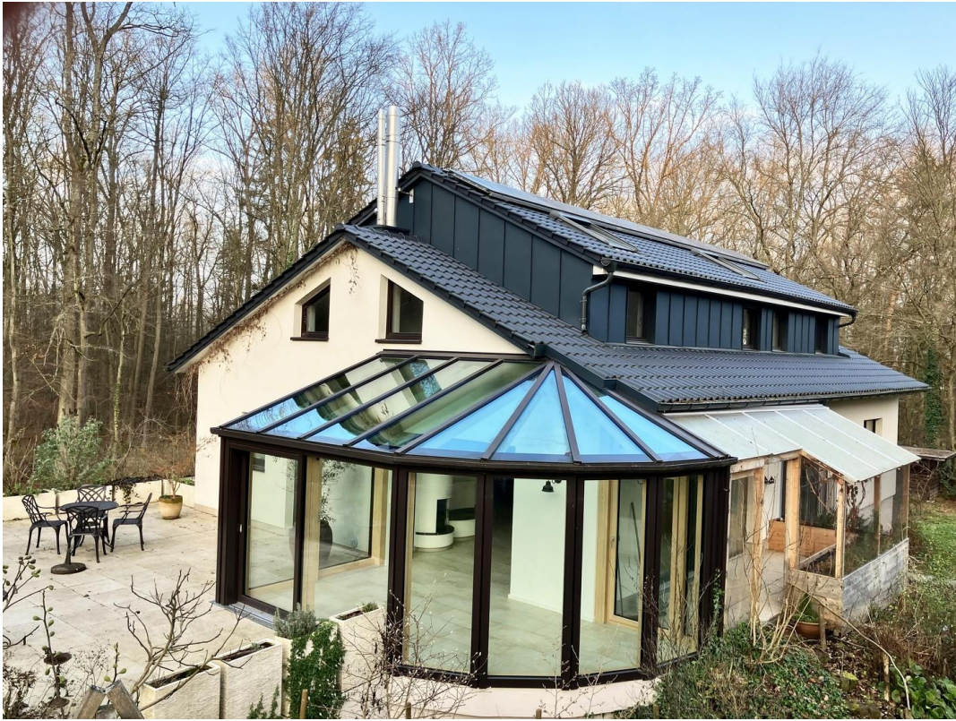
Ansicht von Süd