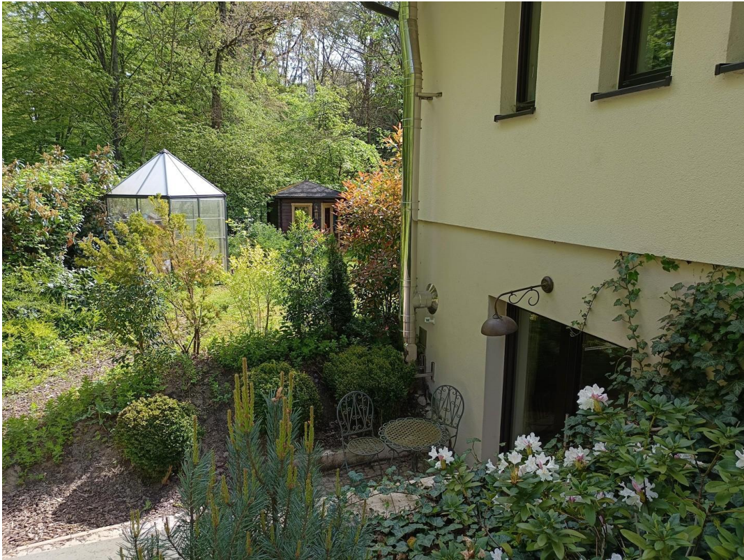
Eingang UG Frühjahr