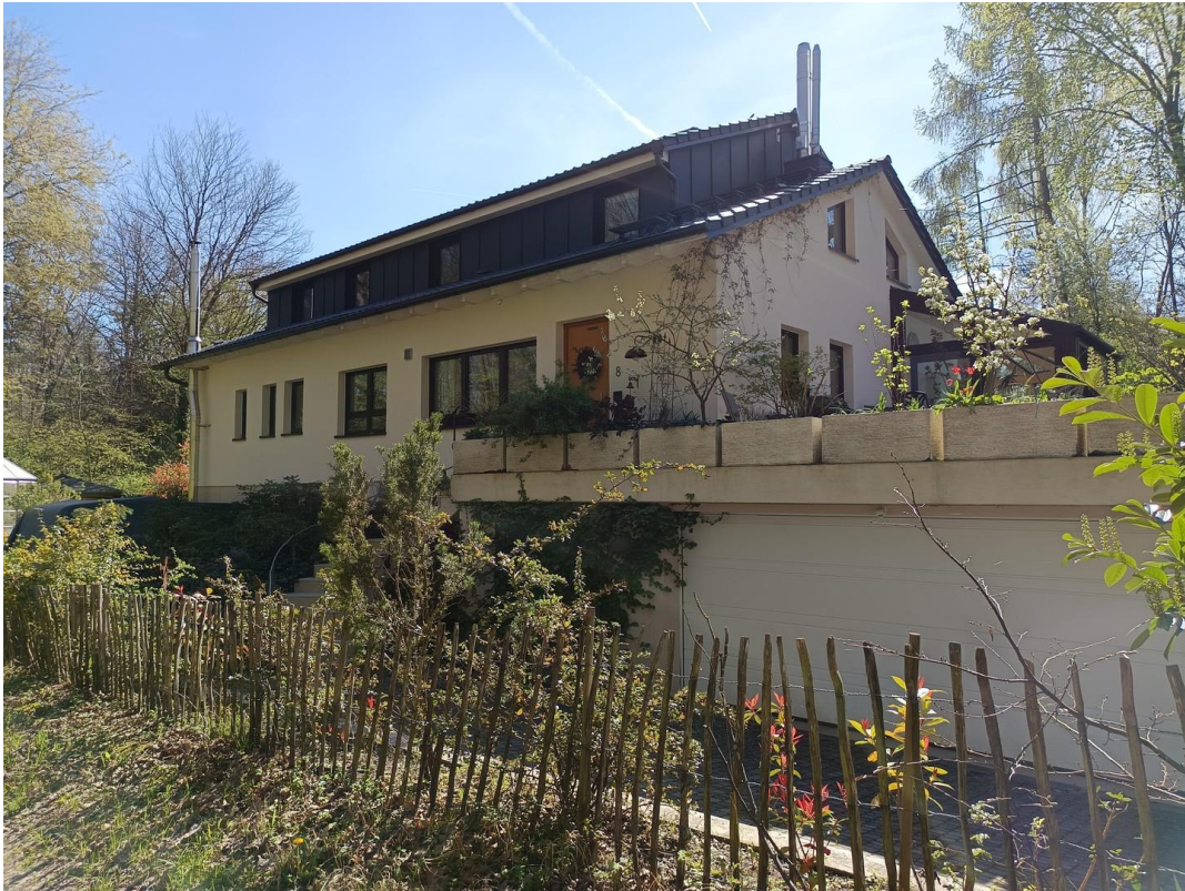
Ansicht von Nord