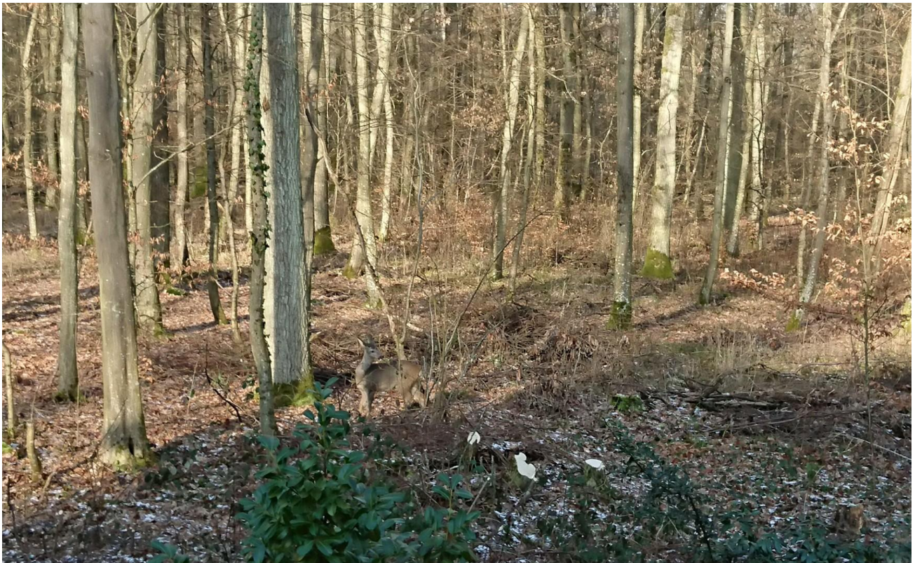
Reh im Winter, Blick aus Küche