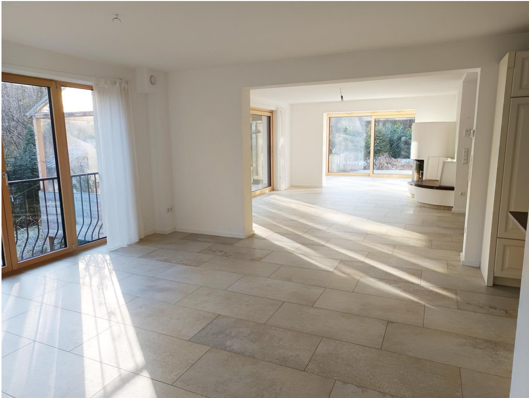
Ess-, Wohnzimmer, Wintergarten