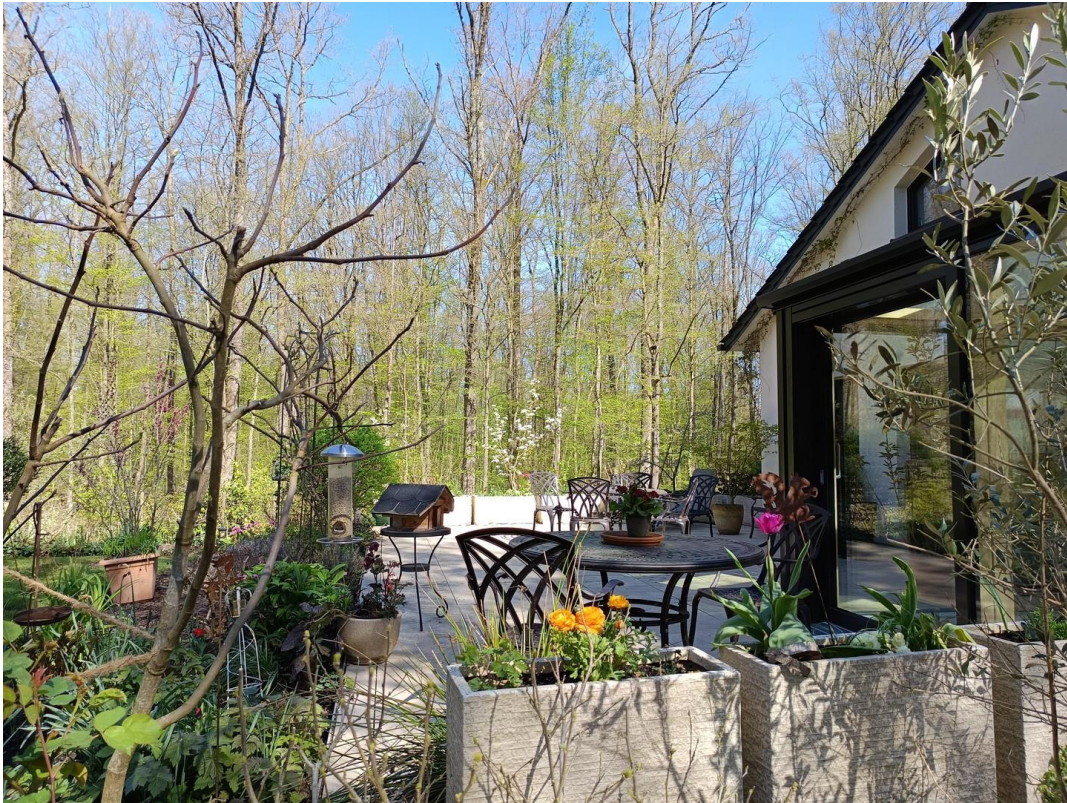
große Terrasse Frühjahr