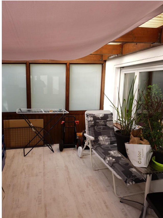
überdachte Terrasse innen