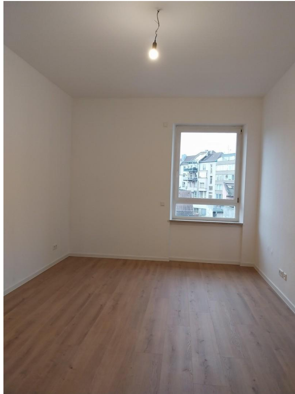
3-ZW Schlafzimmer 1