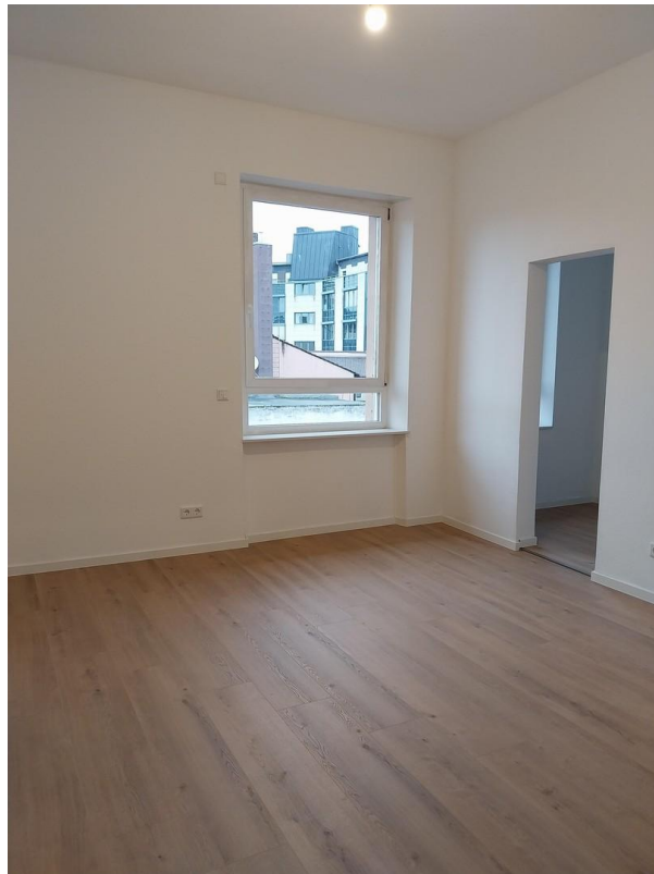
3-ZW Schlafzimmer + Ankleide