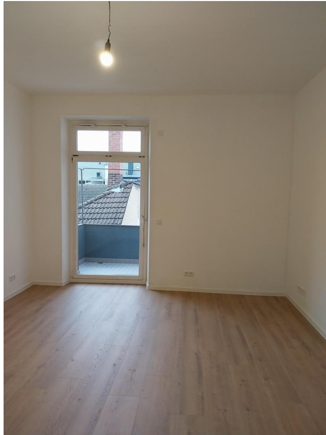
3-ZW Wohnzimmer mit Balkon