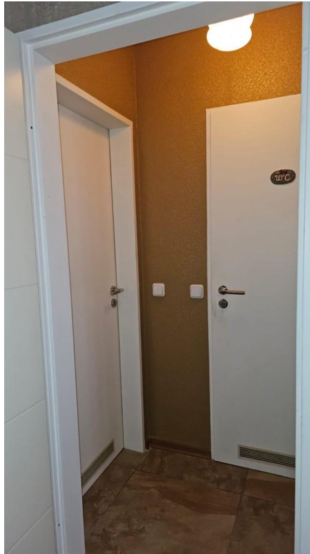
Vorraum Badezimmer u. Gäste-WC