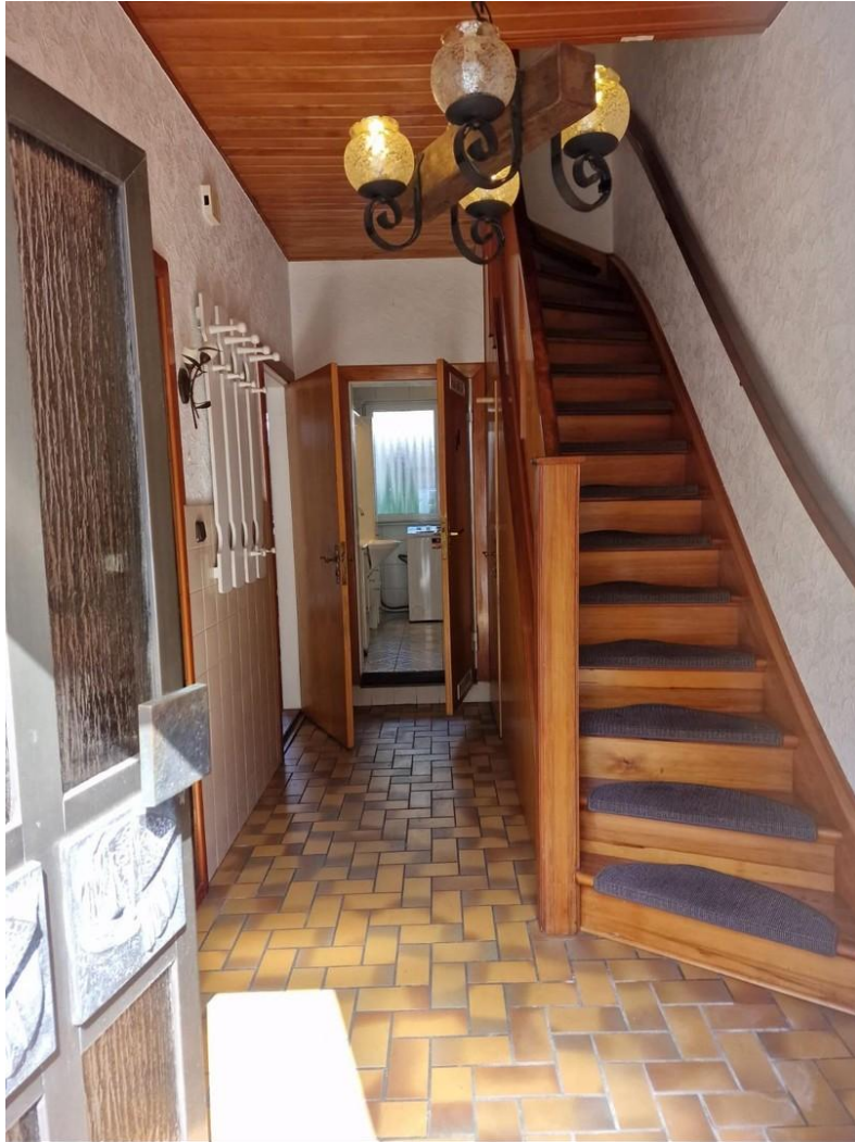
Treppe zum 1. OG