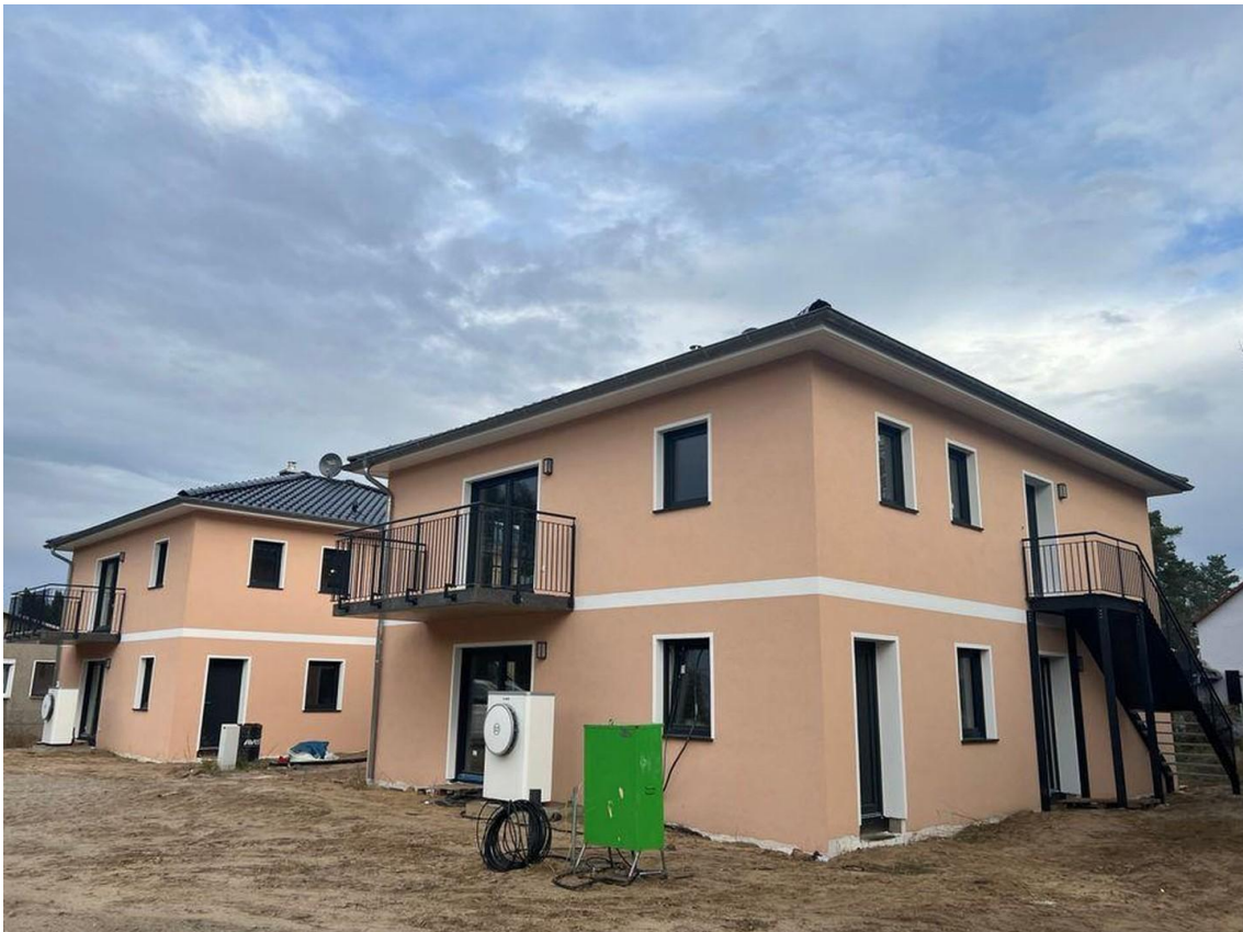
Außenansicht 5 A + 5 B