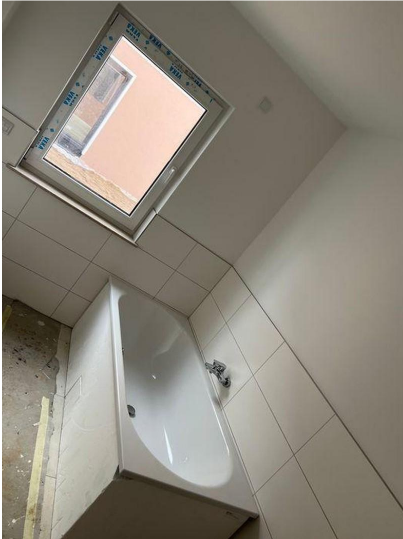
Badezimmer rechte Seite