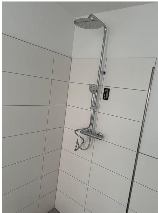
Badezimmer rechte Seite