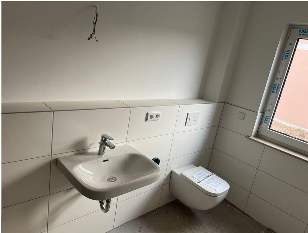
Badezimmer linke Seite