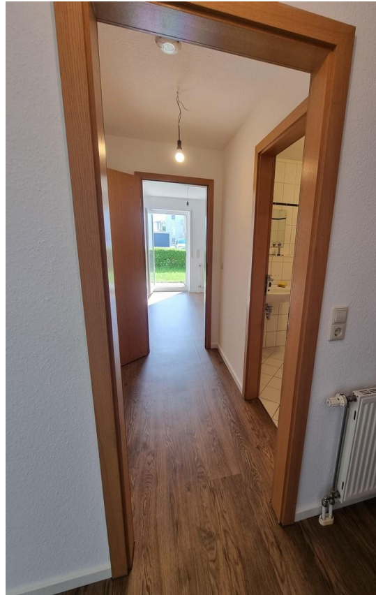
Durchgang zum Schlafzimmer