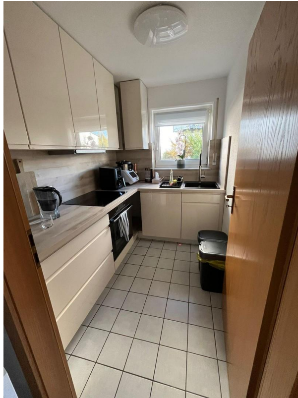
Küche (verkauf ohne Möbel)