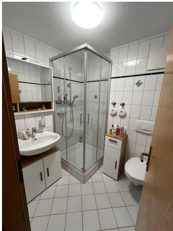
Bad mit neuer Duschkabine