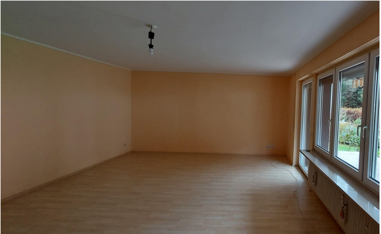
Wohnzimmer mit Terrasse