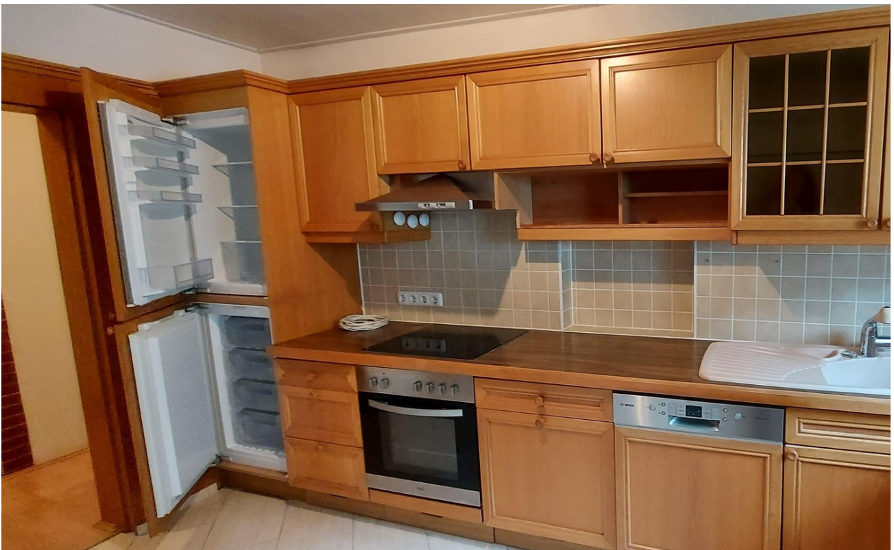
Küche mit allen Geräten