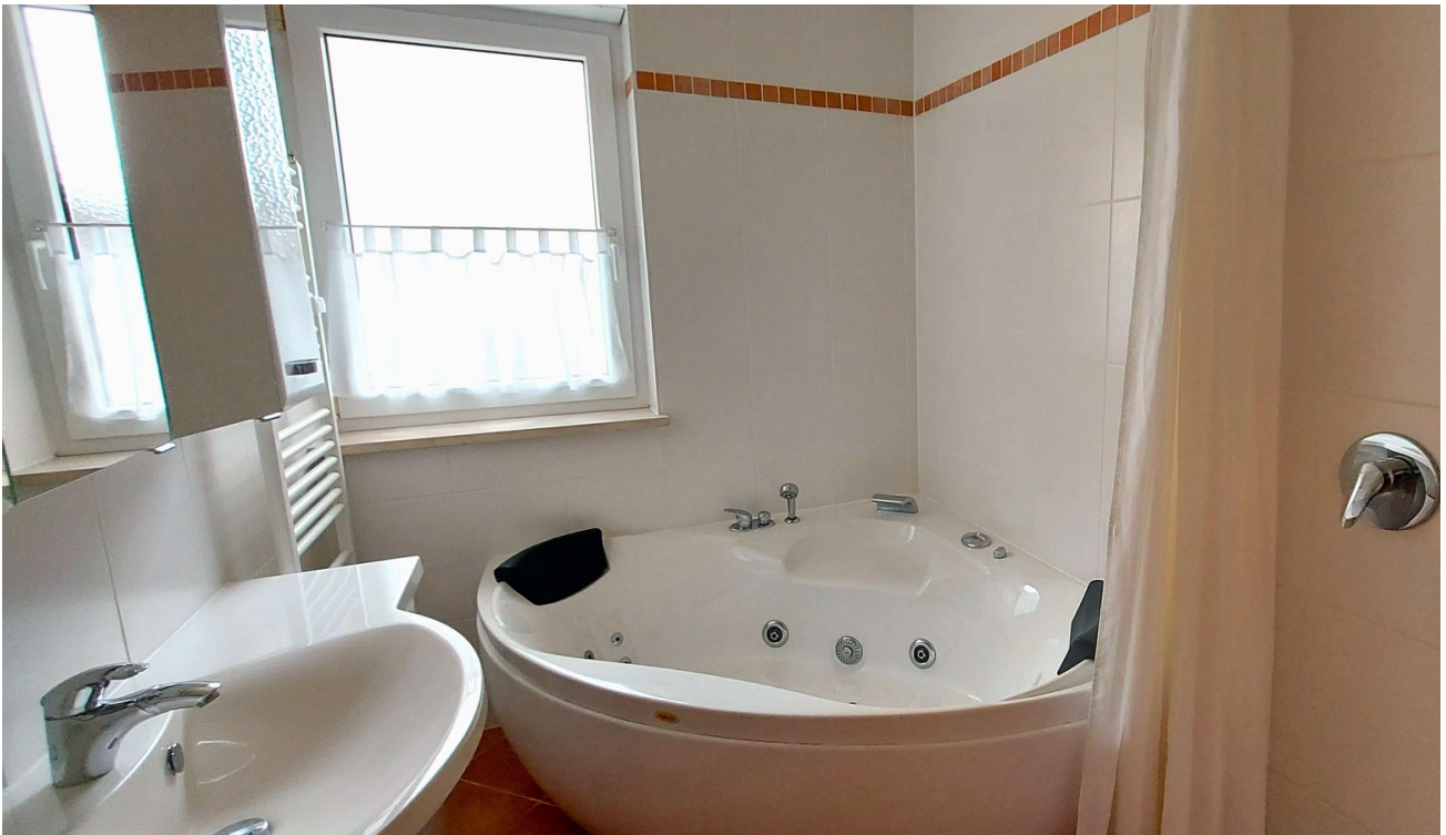
Bad mit Fenster+Whirlpool