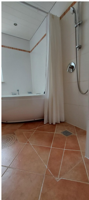
Bad mit begehbare Dusche