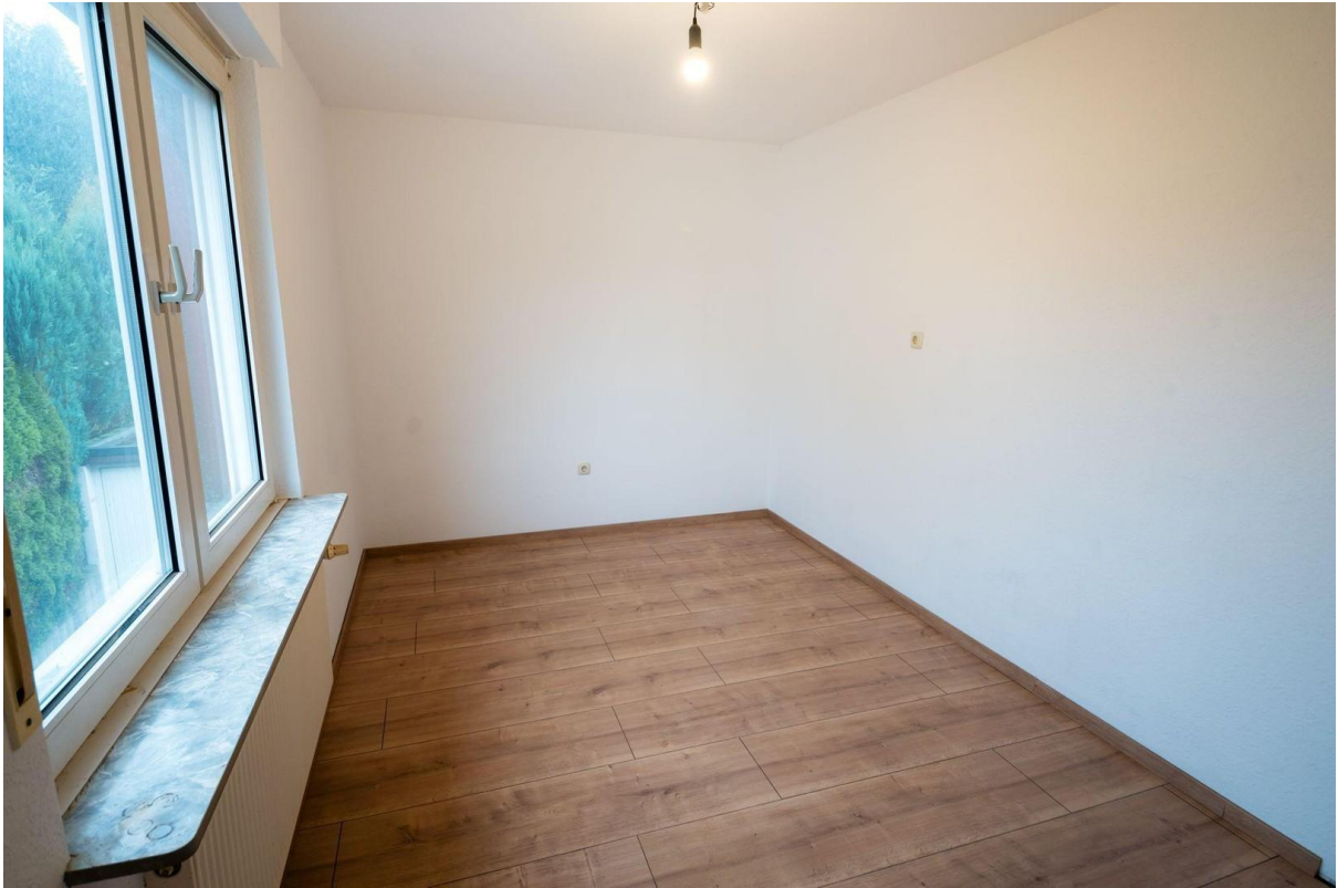
Büro oder Kinderzimmer