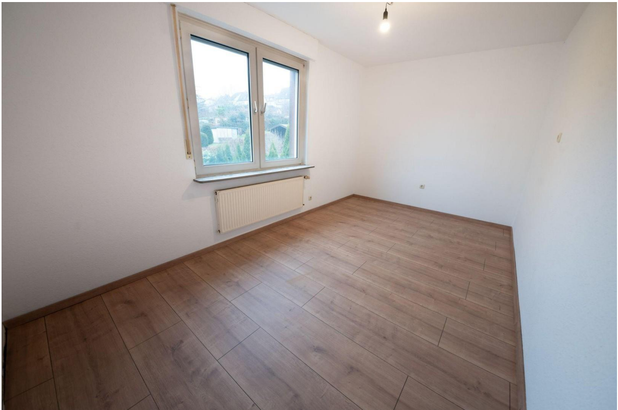
Büro oder Kinderzimmer