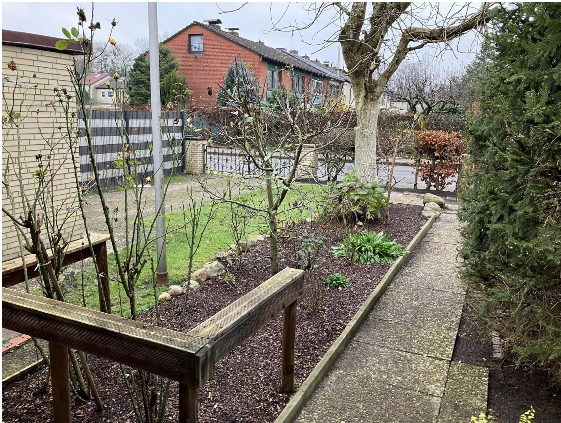
Blick Haustür in den Vorgarten