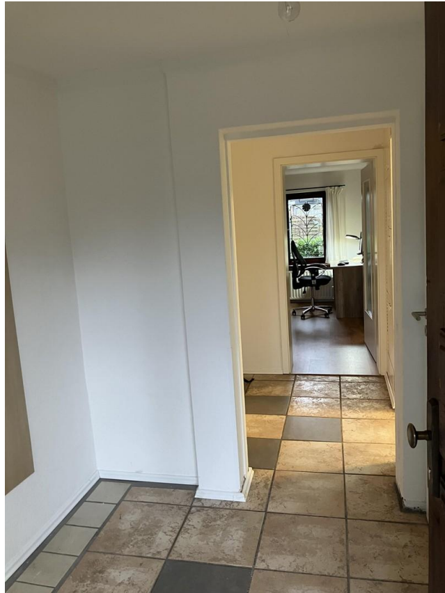
Flur Richtung WZ