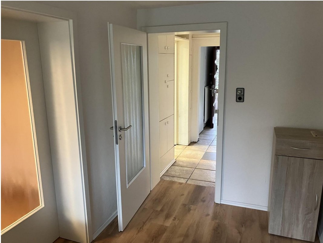
Flur Richtung Haustür