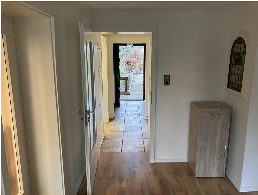
Flur Richtung Vorgarten