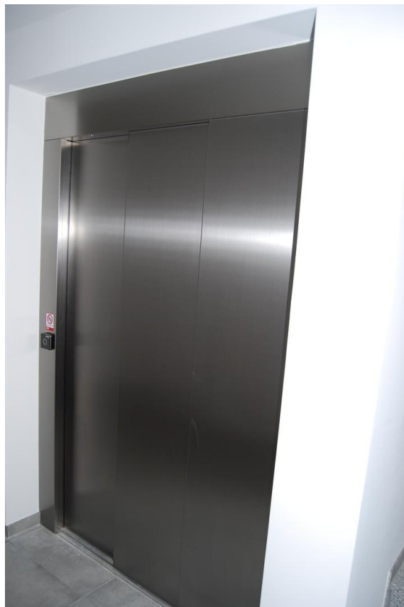
Aufzug auf Ihre Wohnebene