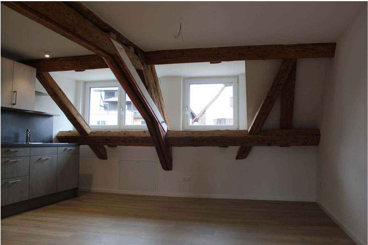
Esszimmer mit Einbauküche