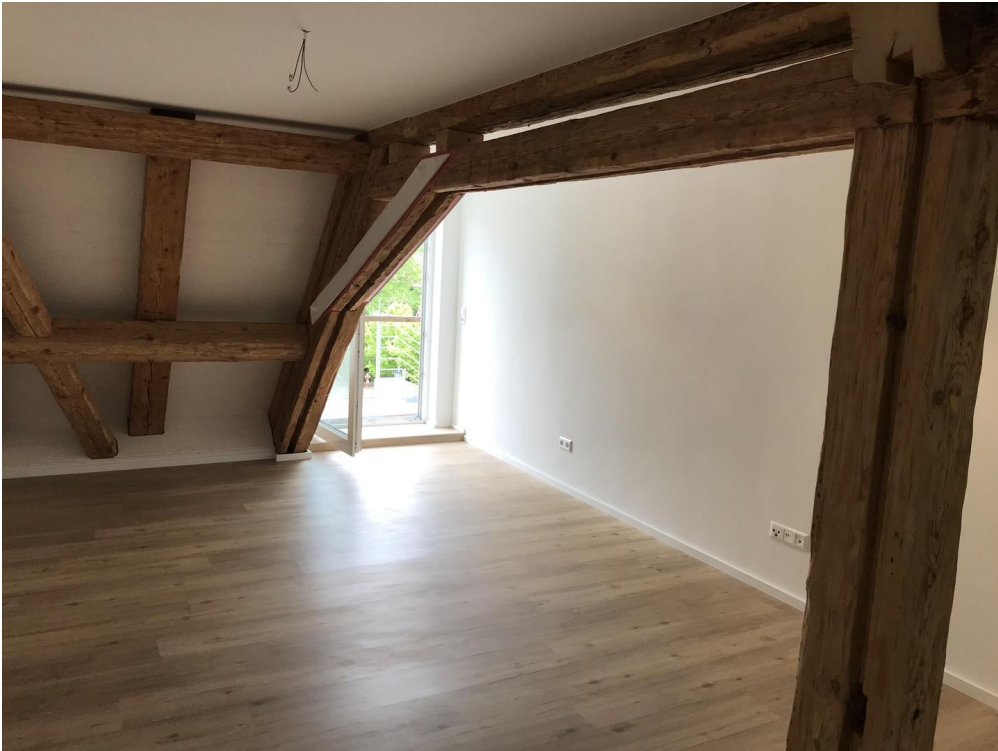
Wohnzimmer und Ausgang Balkon