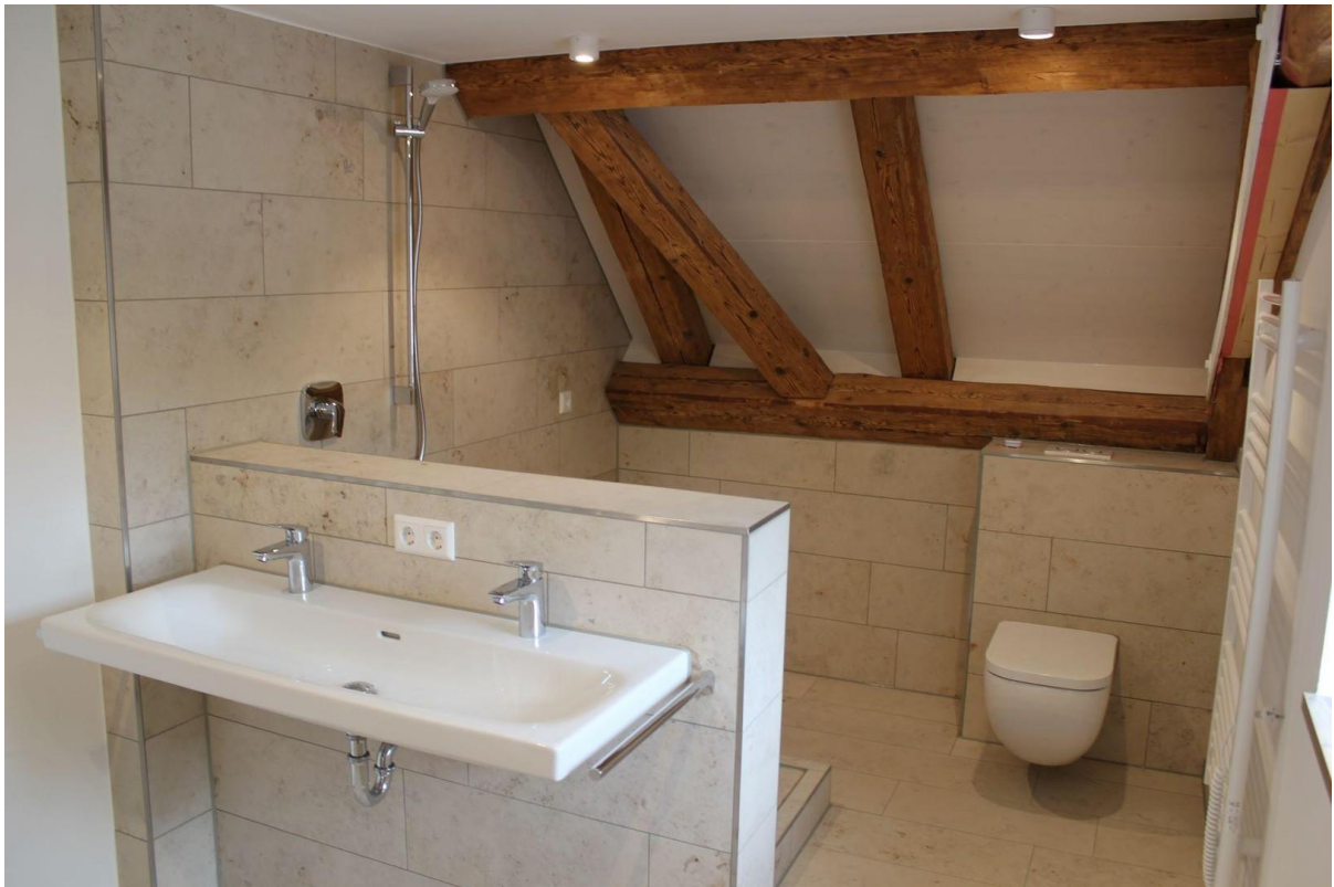
Badezimmer mit Naturstein