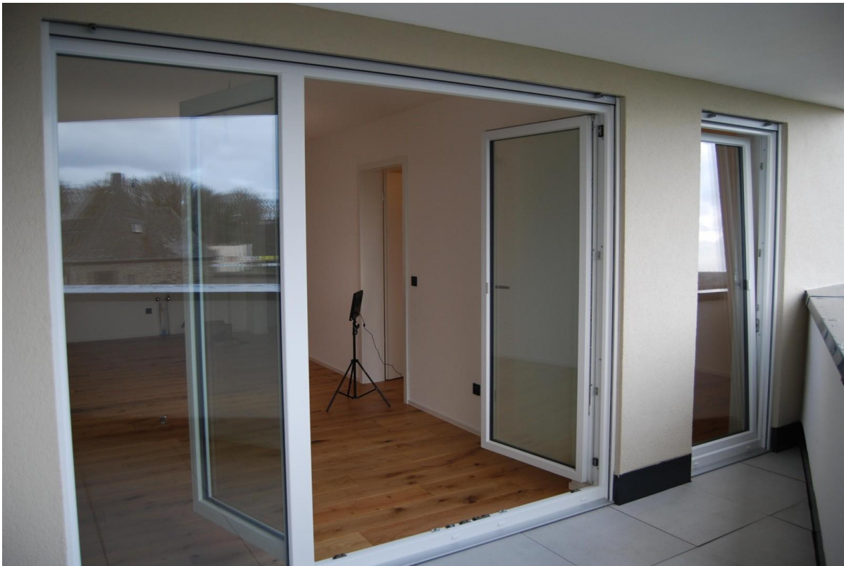
Balkon Richtung Wohnbereich