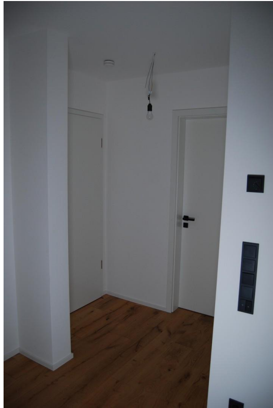
Eingangsbereich / Diele