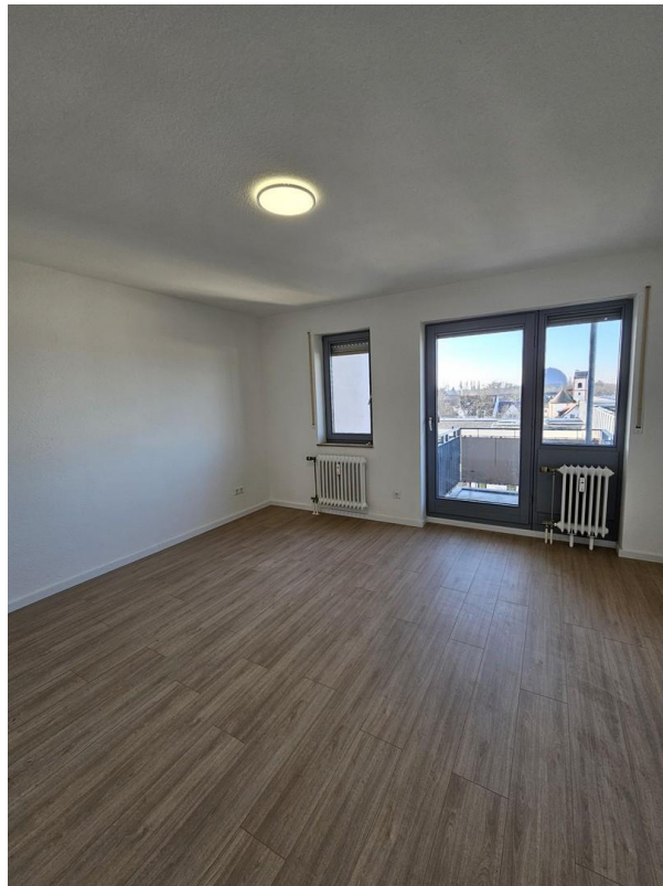
Wohnzimmer mit Balkon