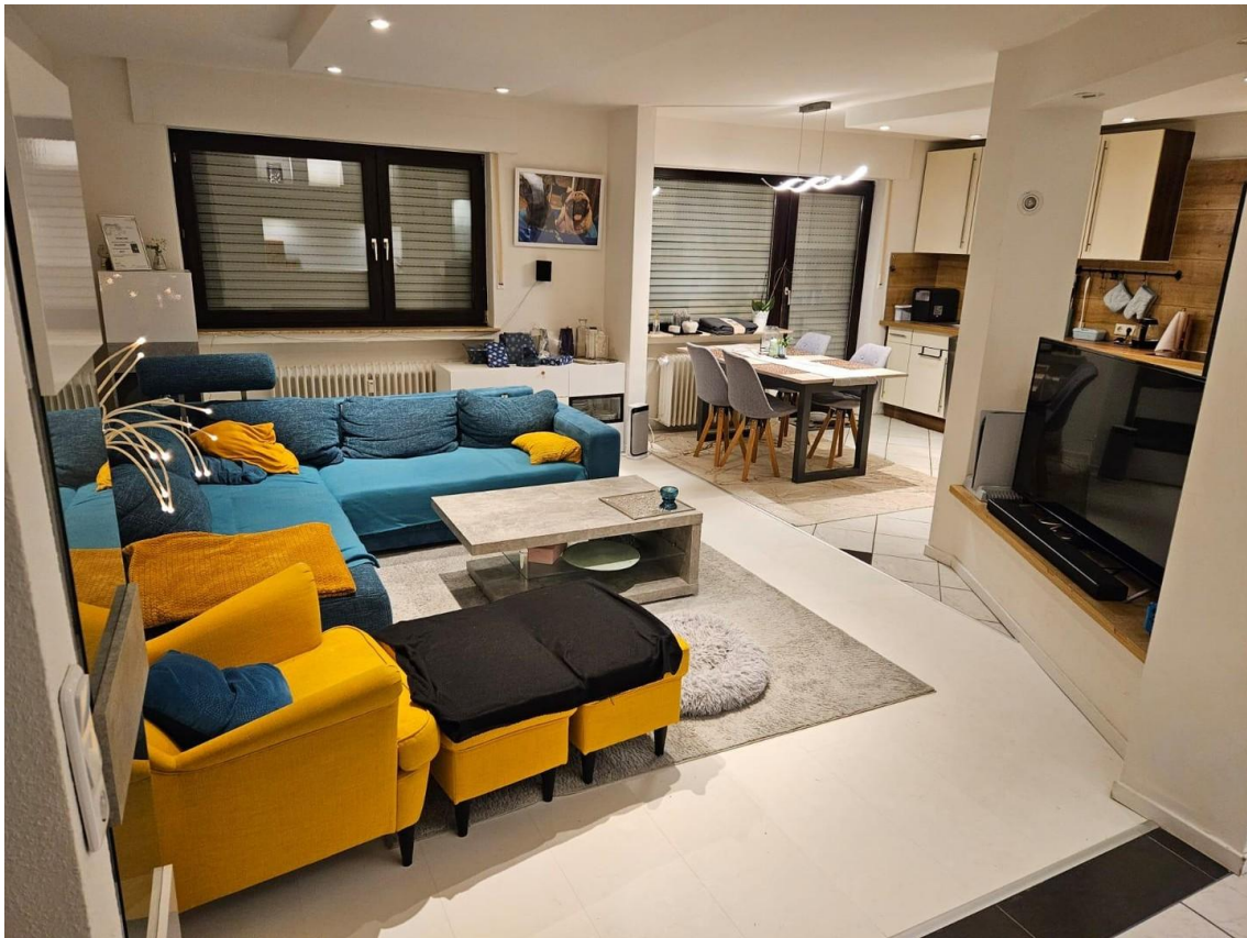
Wohn-Essbereich + Balkonzugang