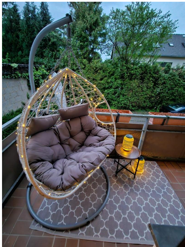
kl.Ausschn. des riesen Balkons