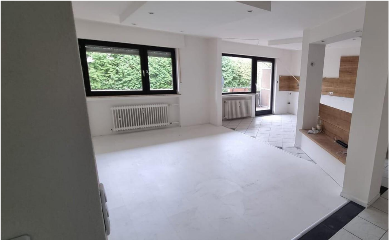
Wohn-Essbereich + Balkonzugang