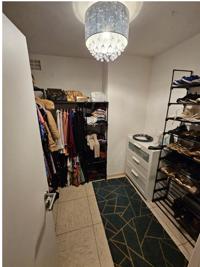
Ankleidezimmer (Raum 0,5)