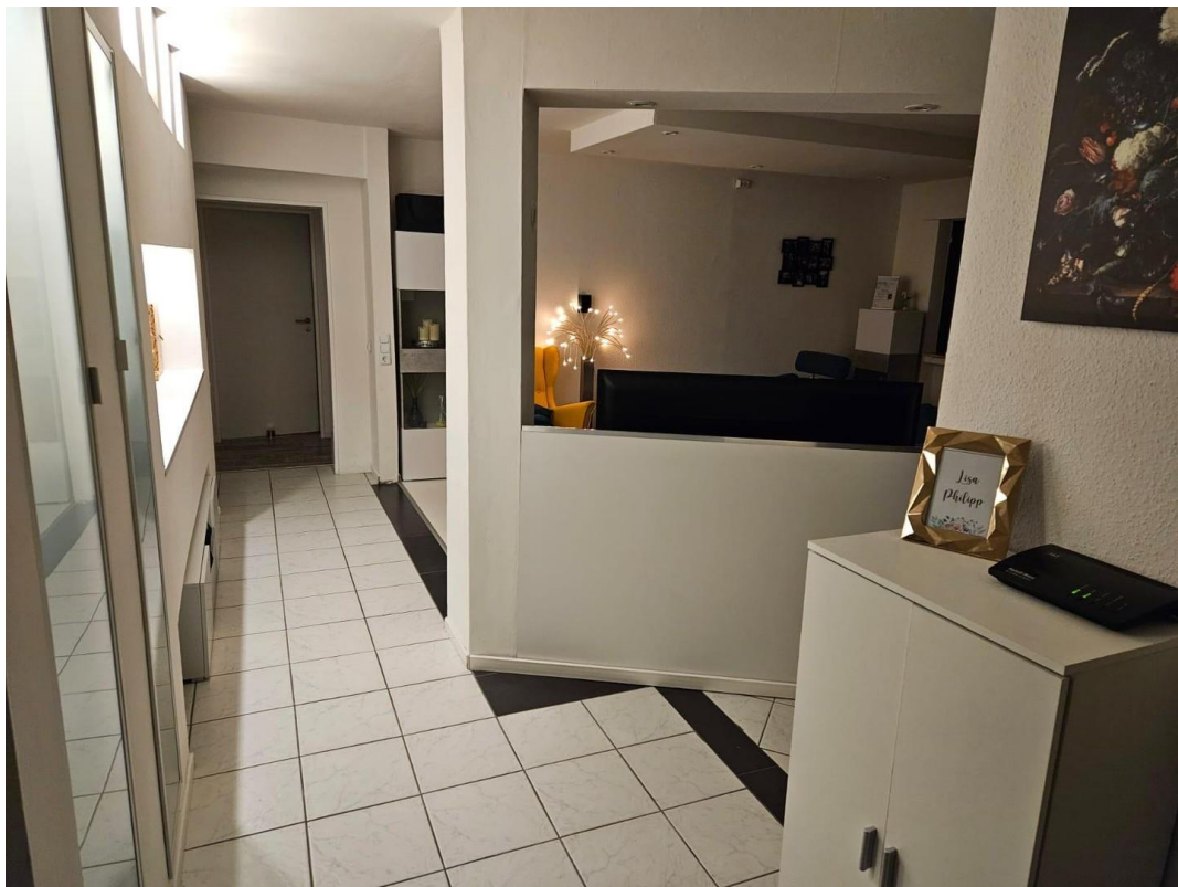
Blick von der Wohnungstüre