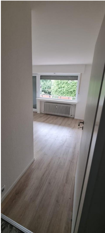
Zimmer 3 mit Balkonzugang