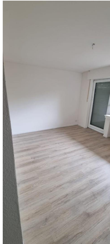
Zimmer 3 mit Balkonzugang