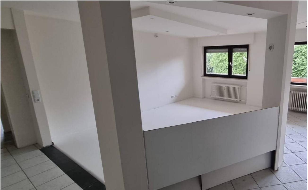
Blick von der Wohnungstüre