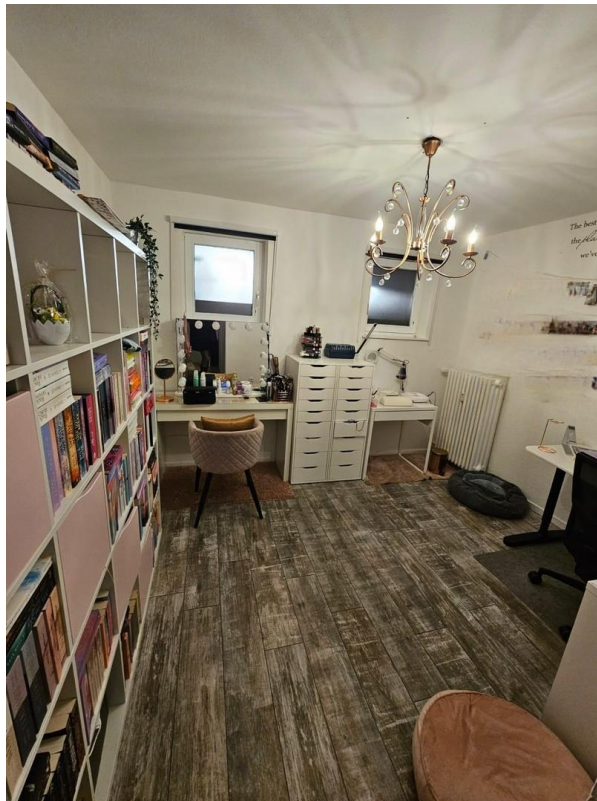
Zimmer 1 beim Ankleidezimmer