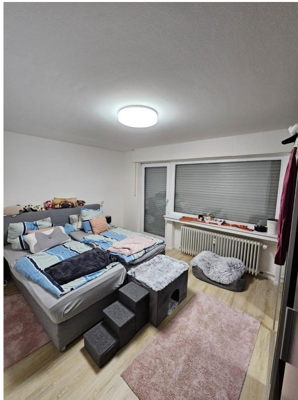
Zimmer 3 mit Balkonzugang