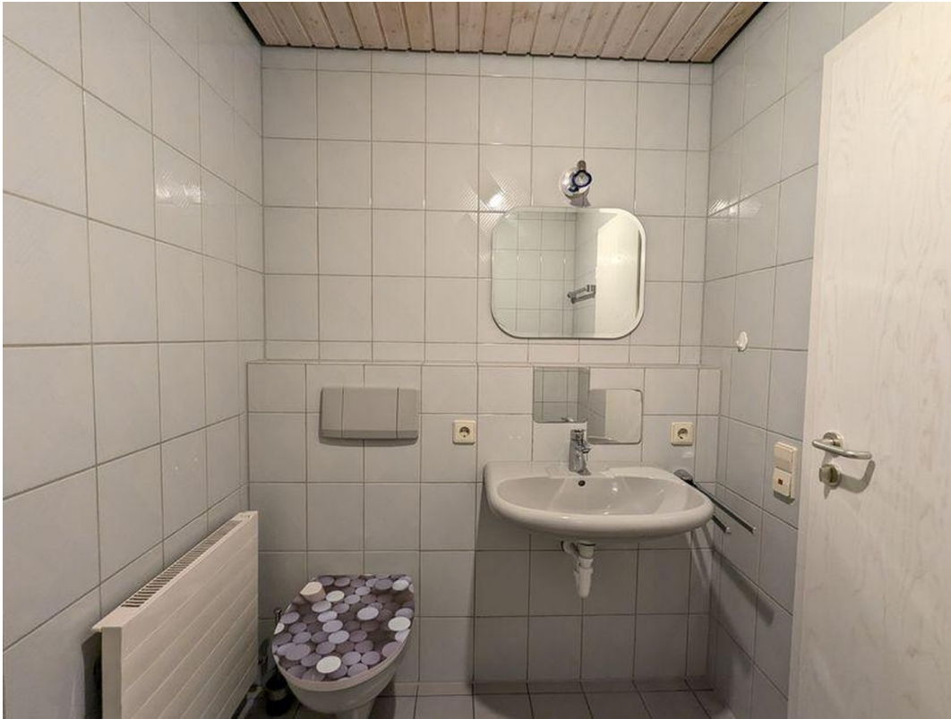
Bad (en Suite, mit Badewanne)