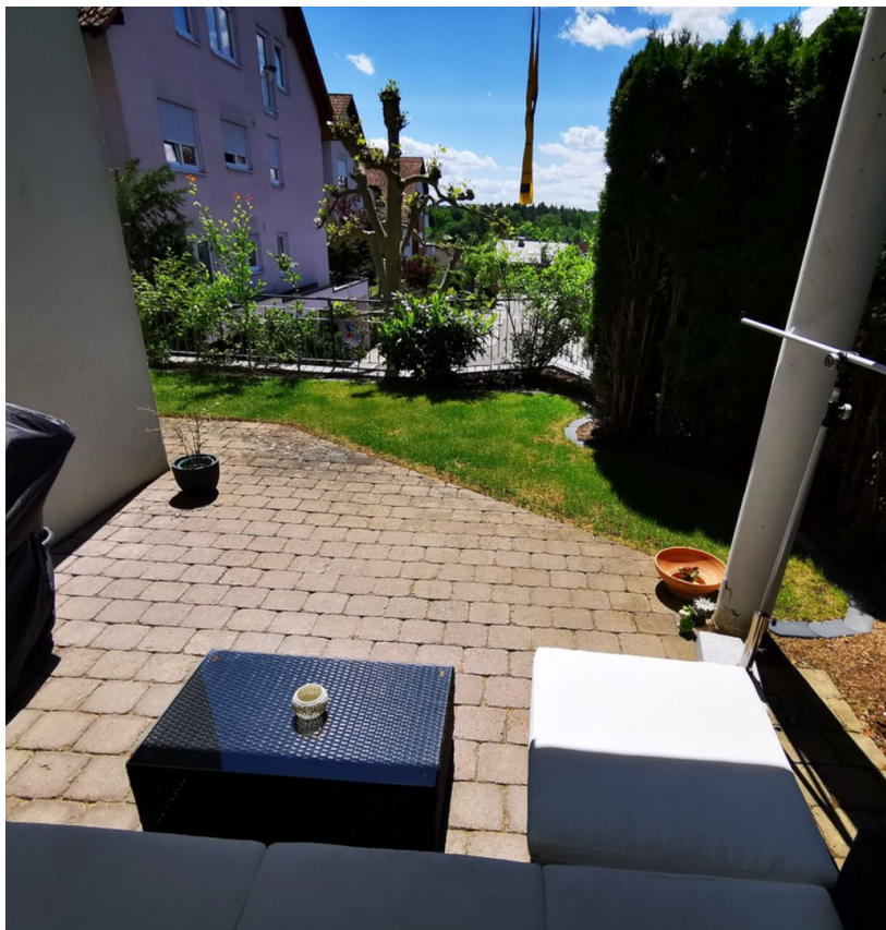
Loggia und Garten