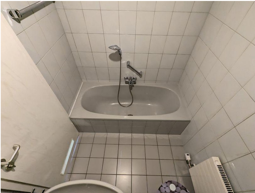
Bad (en Suite, mit Badewanne)