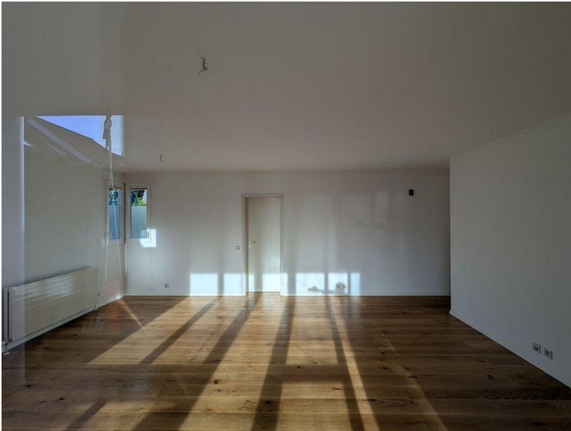
Wohnzimmer (Sicht von Loggia)