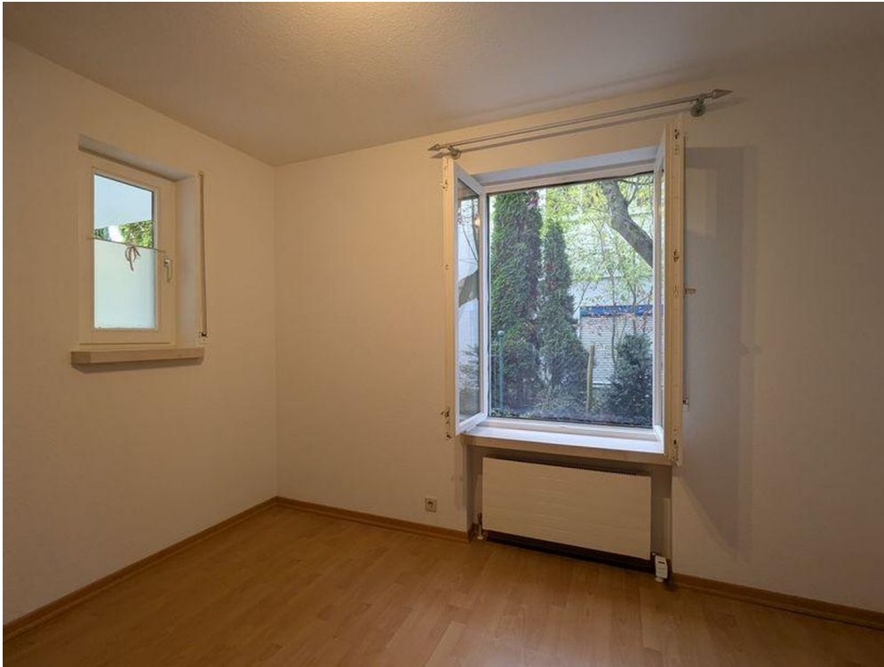
Kinder- / Arbeitszimmer