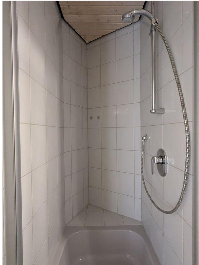
Duschbad mit WC