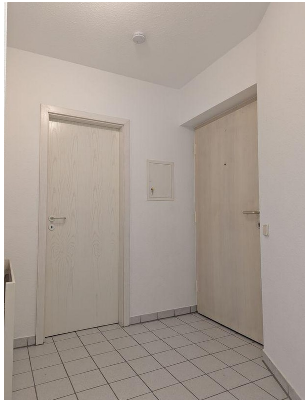
Flur (Haustür rechts)