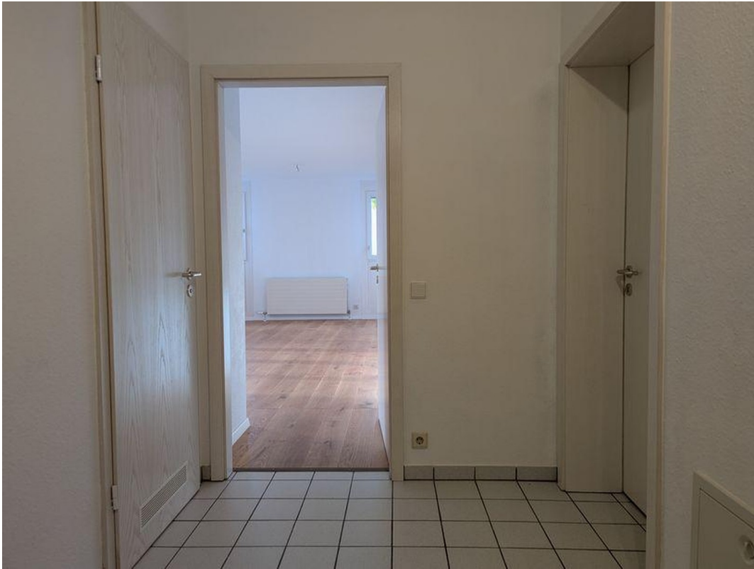
Flur (Blick ins Wohnzimmer)