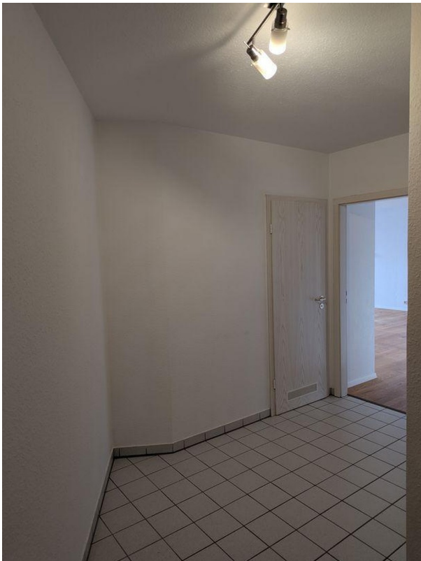
Flur (Blick von Haustür)