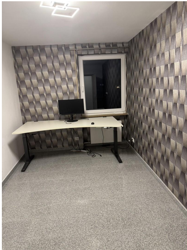
Kinder / Arbeitszimmer