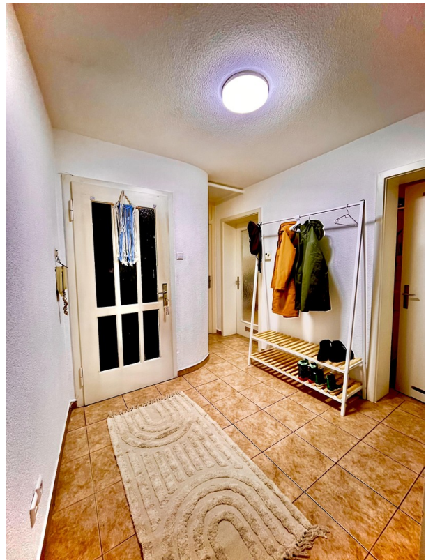
Flur mit Garderobe