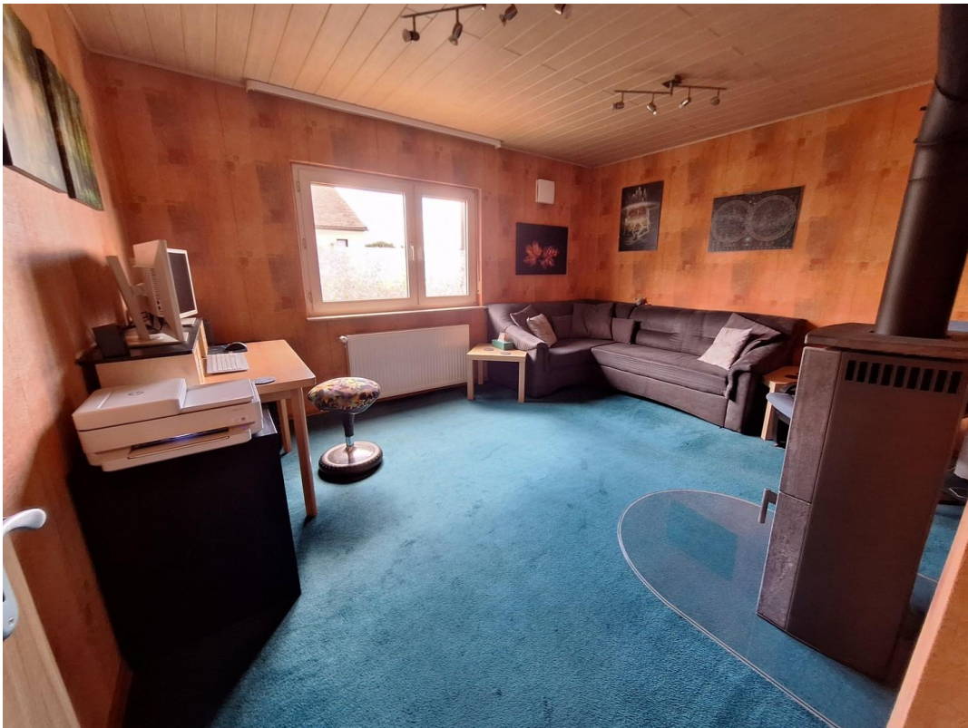
Wohnzimmer 2 - Kaminzimmer