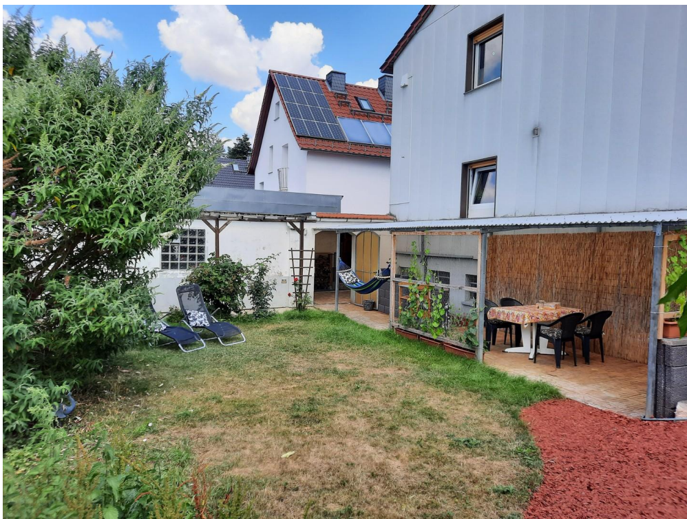
Garten - Blick auf Terrasse