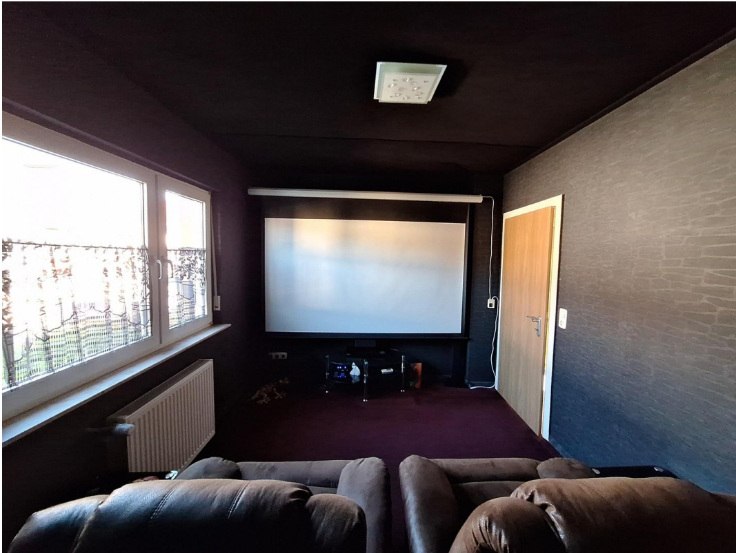
Wohnzimmer 3 - Heimkino