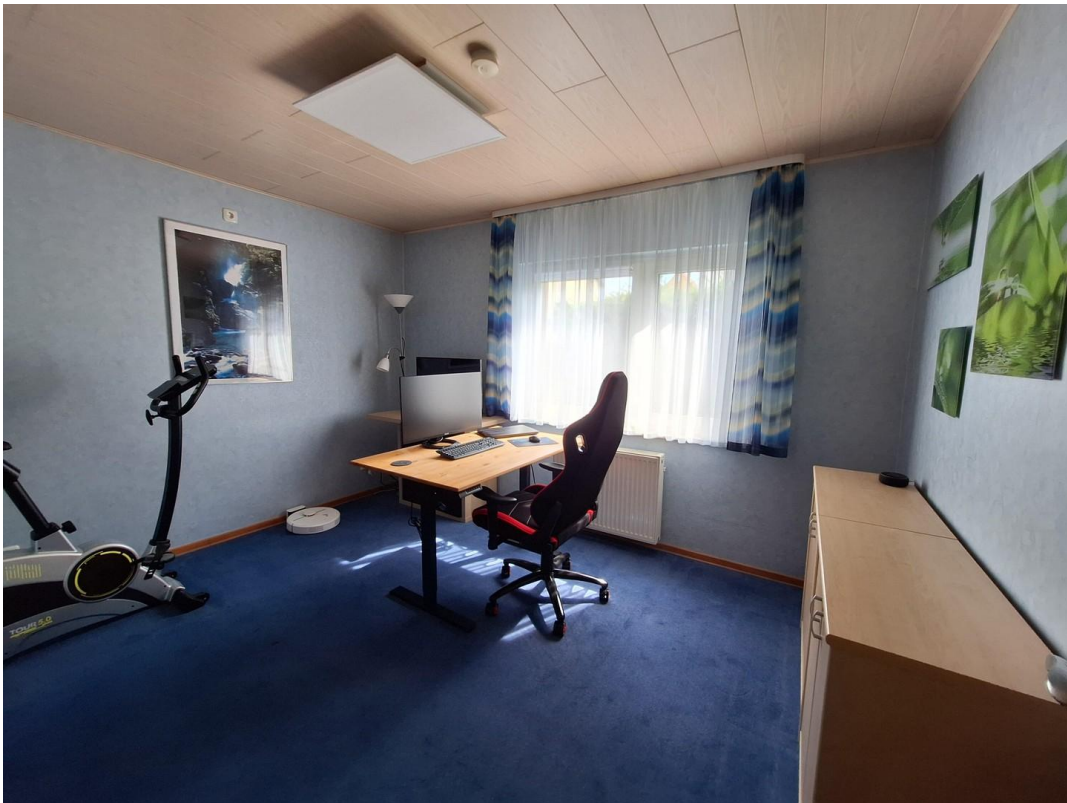
Wohnzimmer 4 - Home-Office