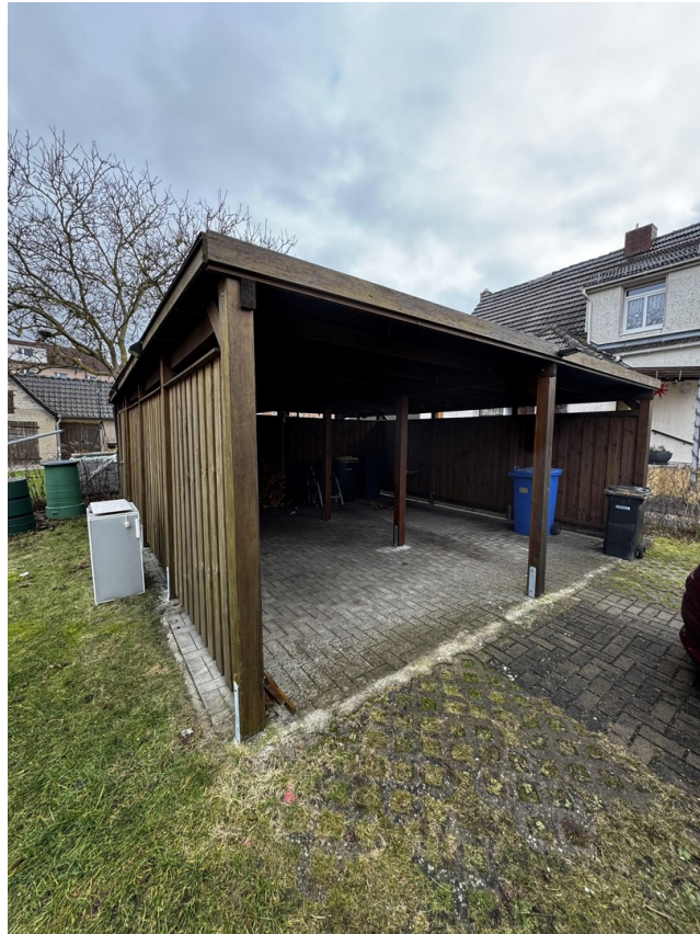
Carport mit Schuppen