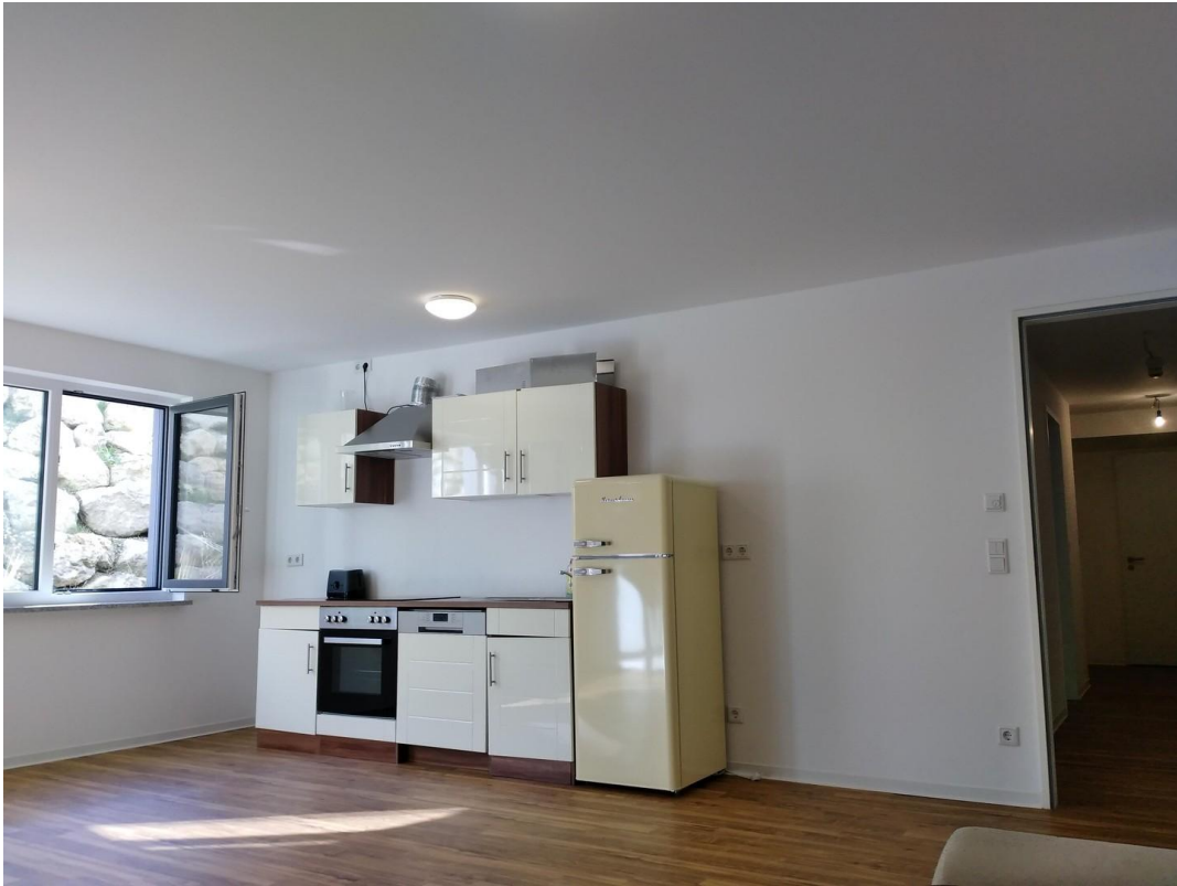
Raum 1 (ohne Küchenzeile)