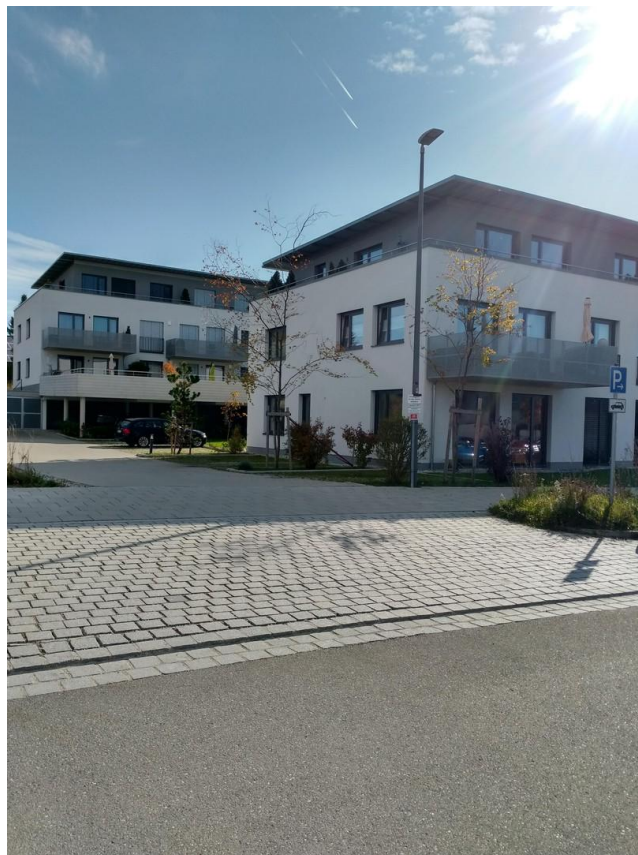
Zufahrt GHS 8