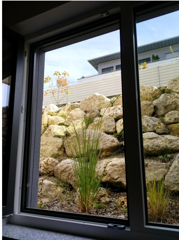
Blick aus Fenster