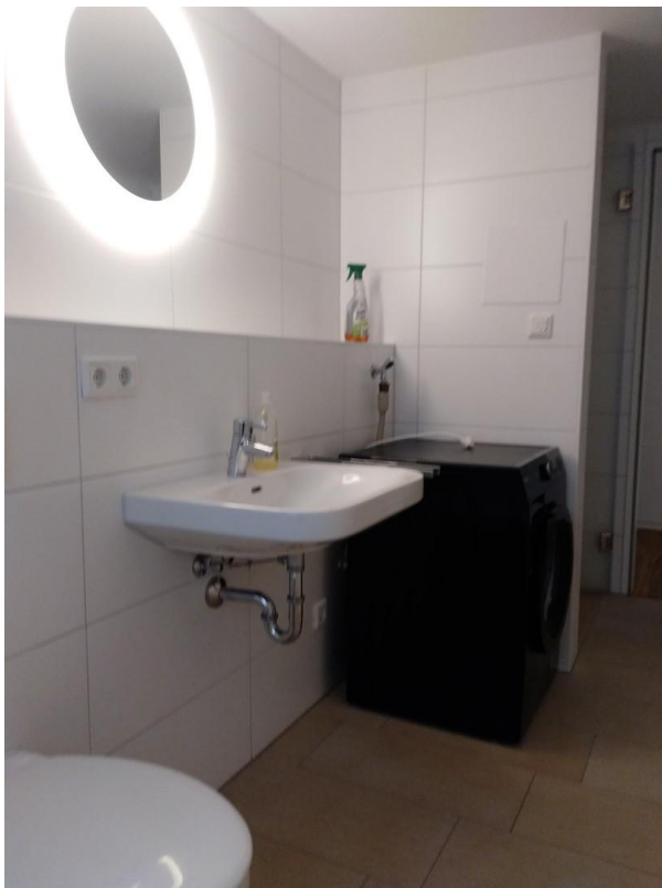
Badezimmer (ohne WM)