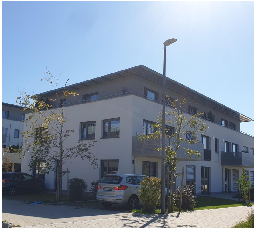
Gewerbe im EG