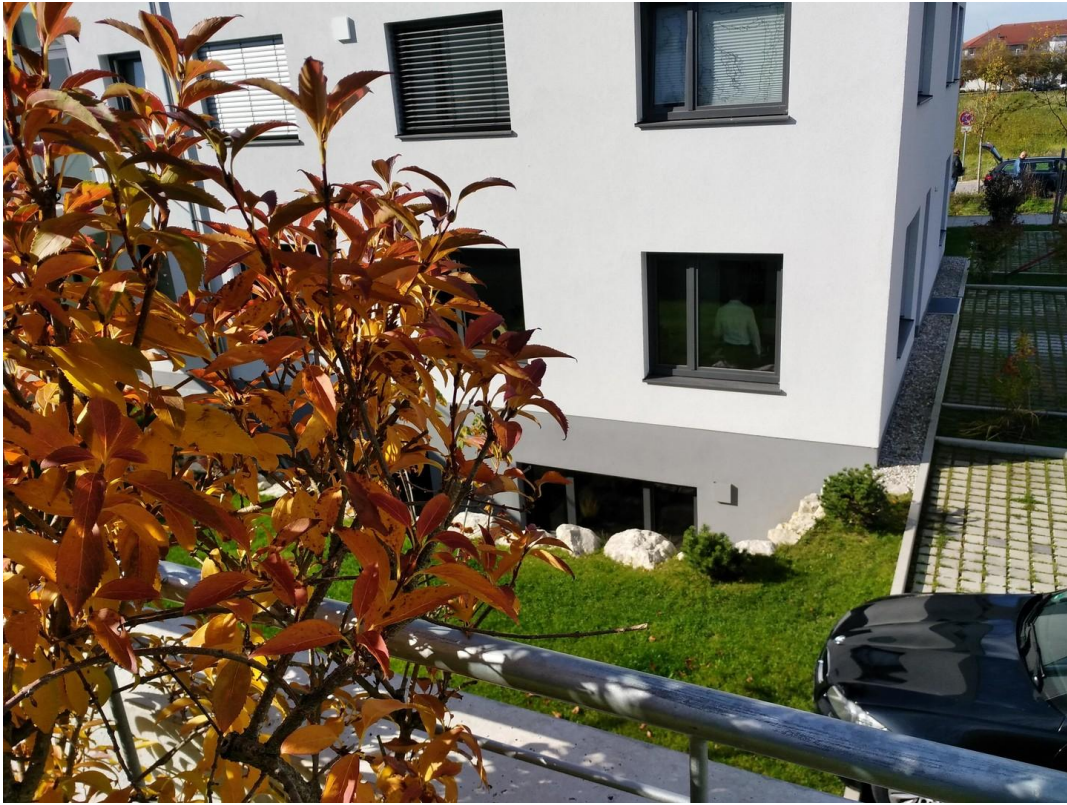
Blick auf Ostseite