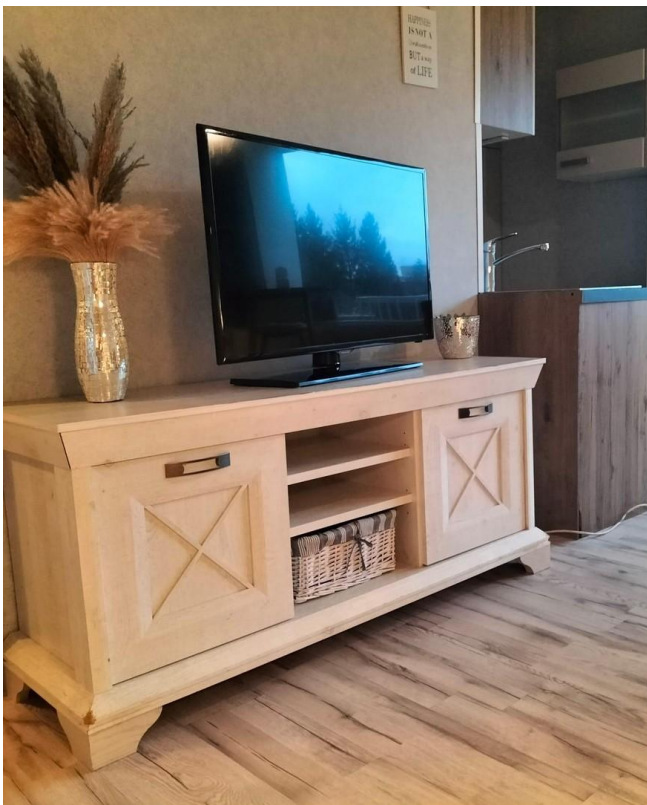
TV-Ecke im Wohnzimmer