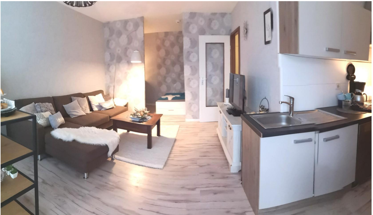
Einziehen und wohlfühlen