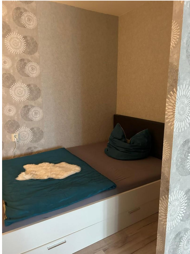
Gemütlich und modern