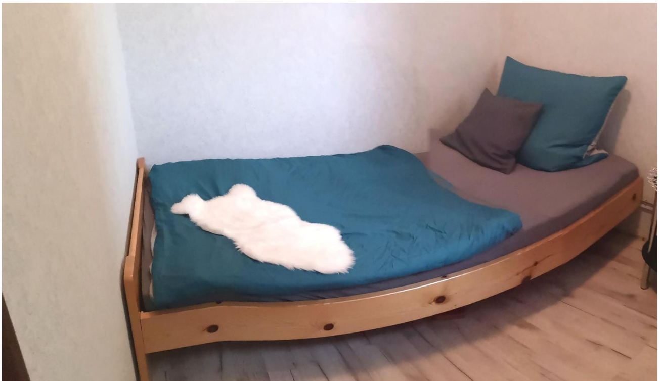
Extra Zimmer für Gäste