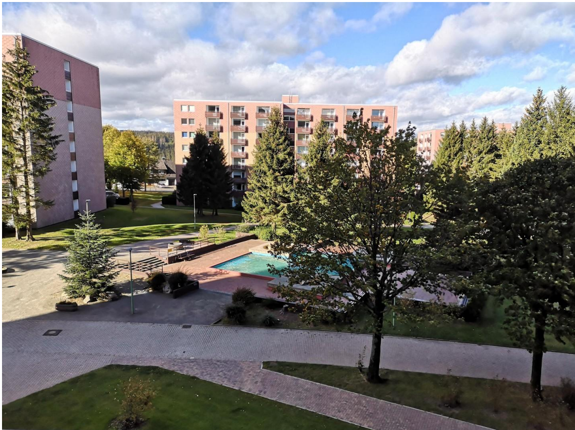
Ausblick aus der Wohnung