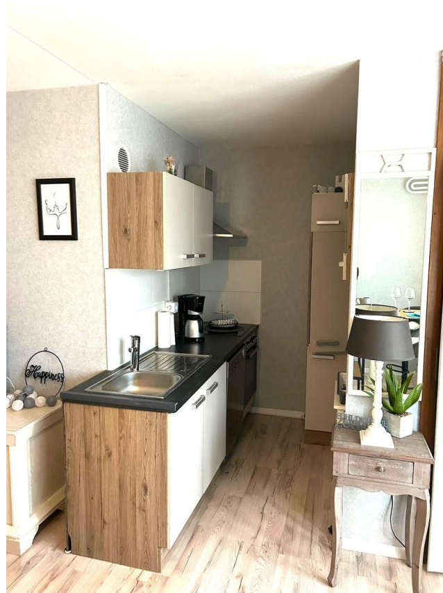
Die moderne breite Küchenzeile