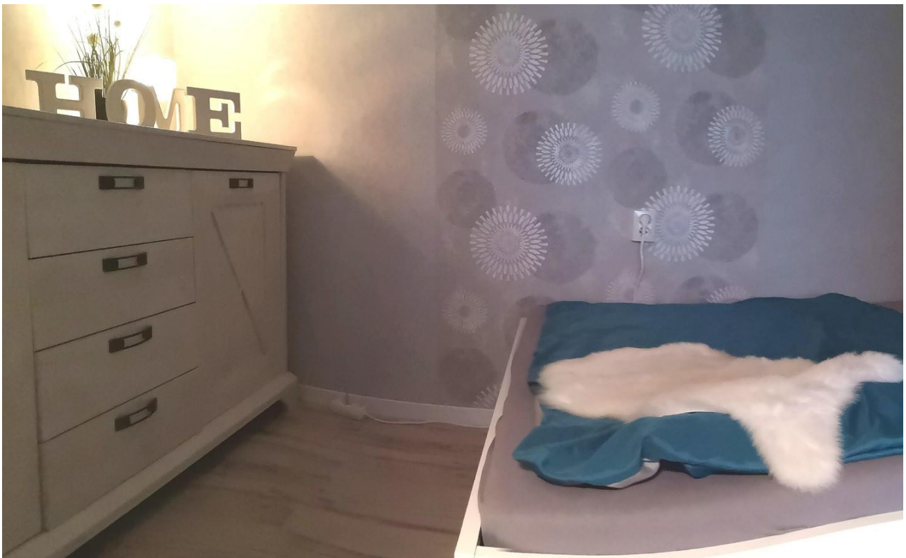
... mit breitem Doppelbett