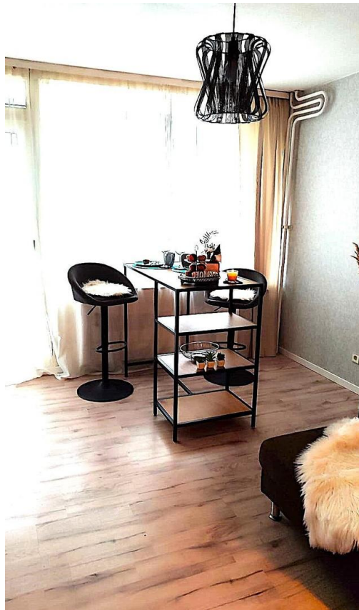
Helles, freundliches Esszimmer