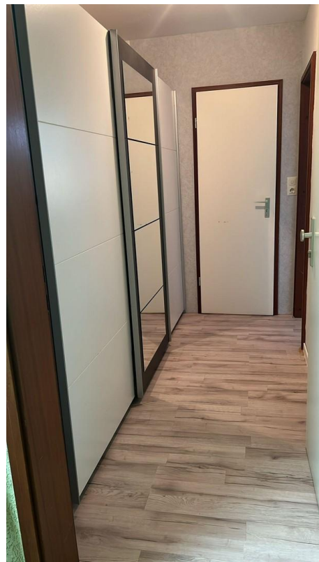
Herzlich willkommen... im Flur