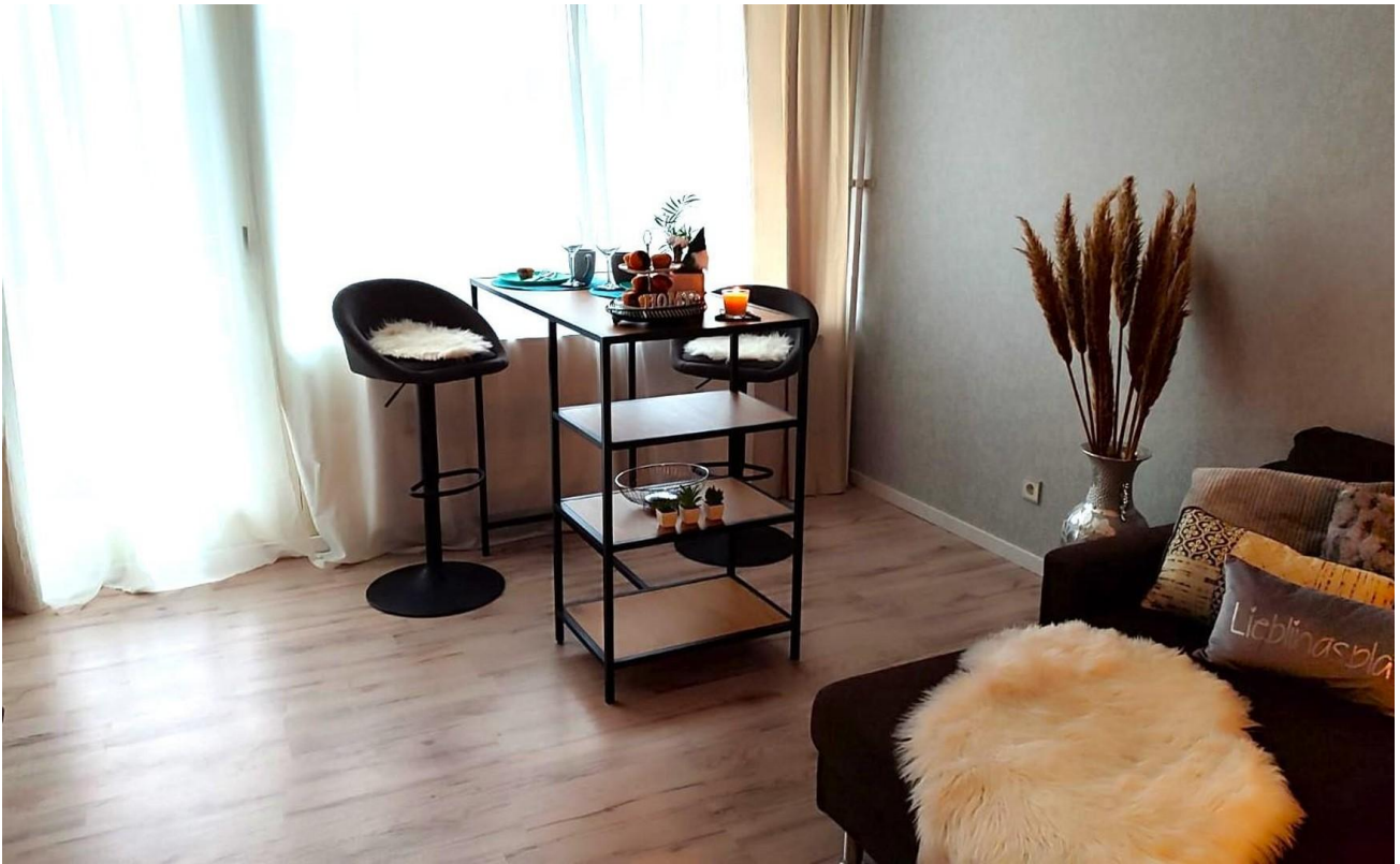
Helles, freundliches Esszimmer