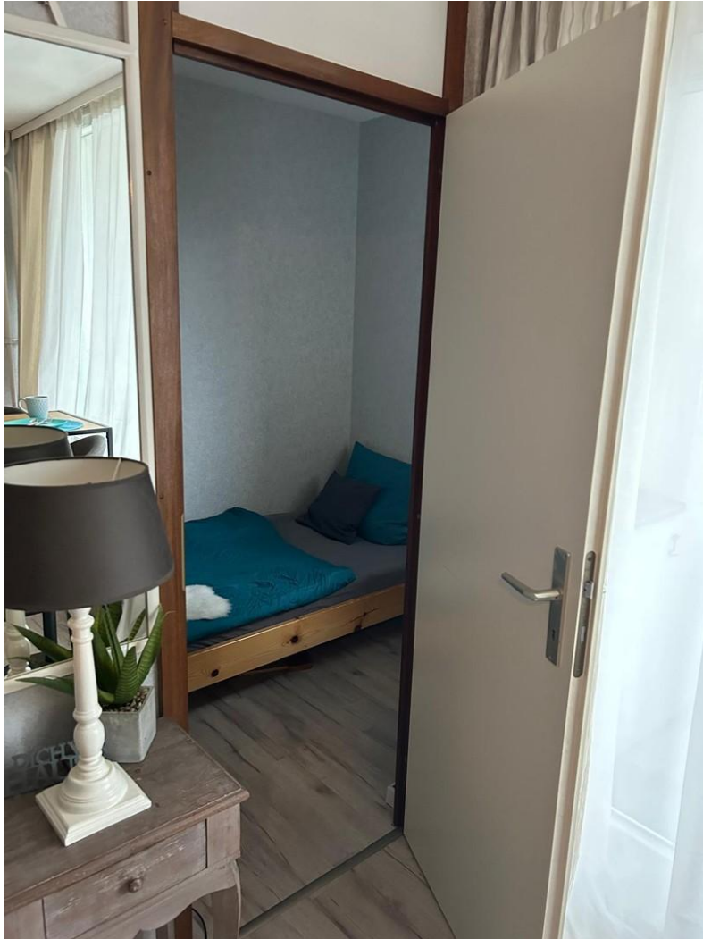
Tür zum Gästezimmer