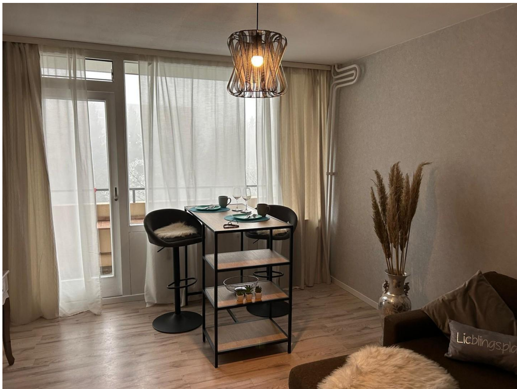
Helles, freundliches Esszimmer