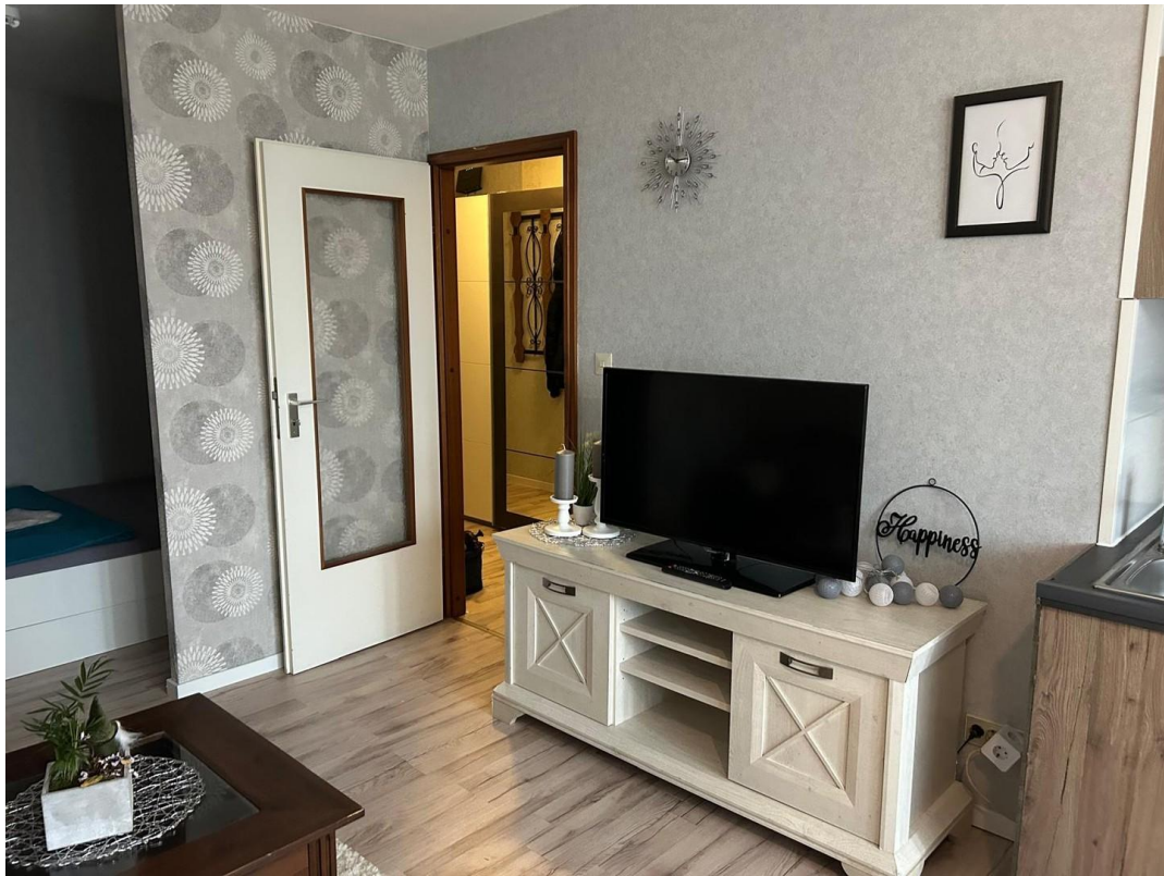
TV-Ecke im Wohnzimmer