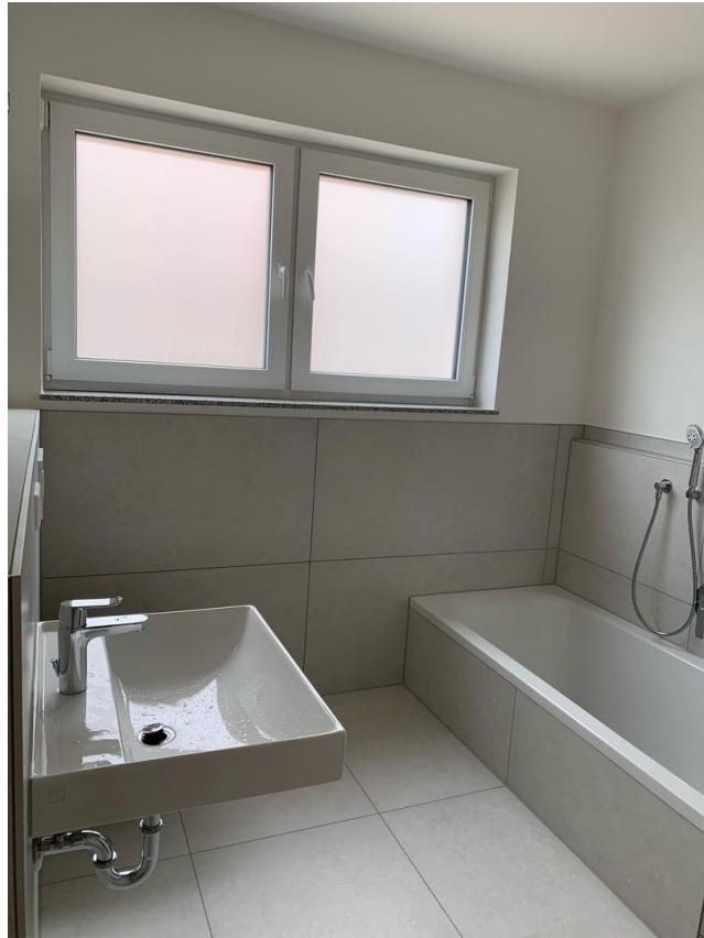
Tageslichtbad mit Wanne