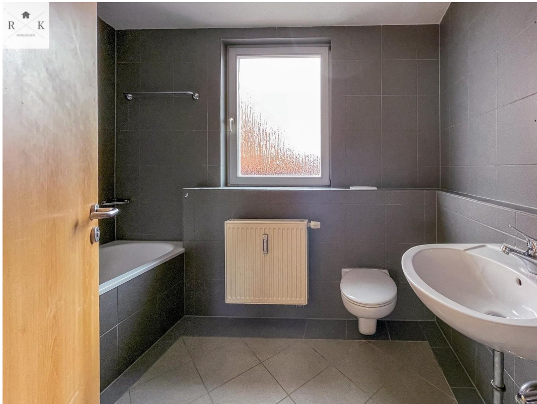
Bad mit Dusche und Badewanne