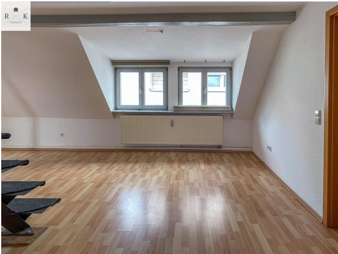
Wohn- / Essbereich