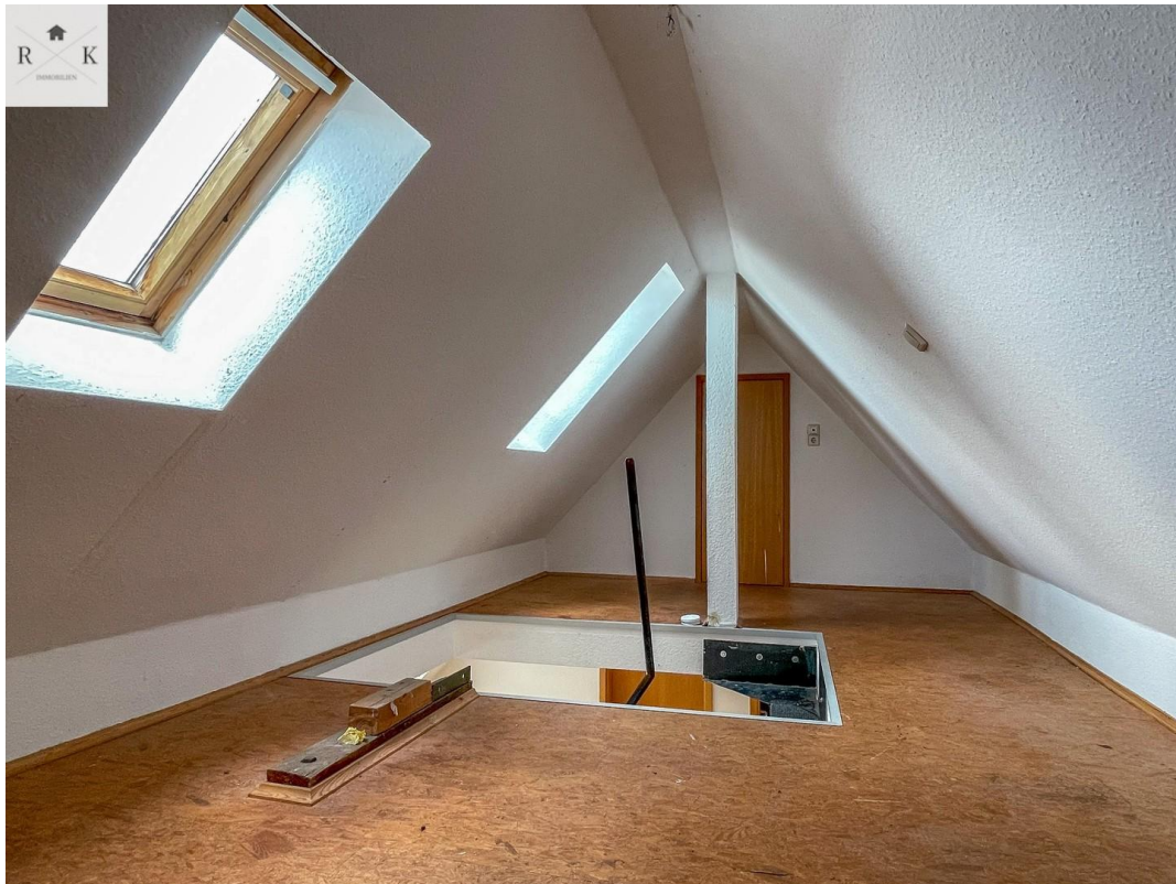
Galerie und Abstellraum