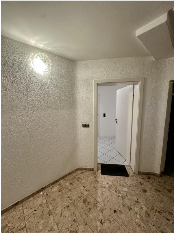
Eingang zur Wohnung