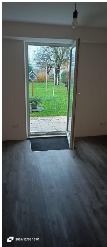
Wohnraum (Zugang zur Terrasse)