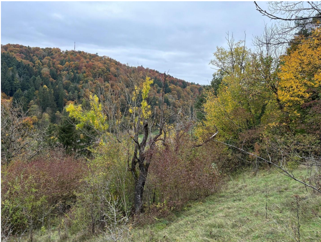
Aussicht nach Westen