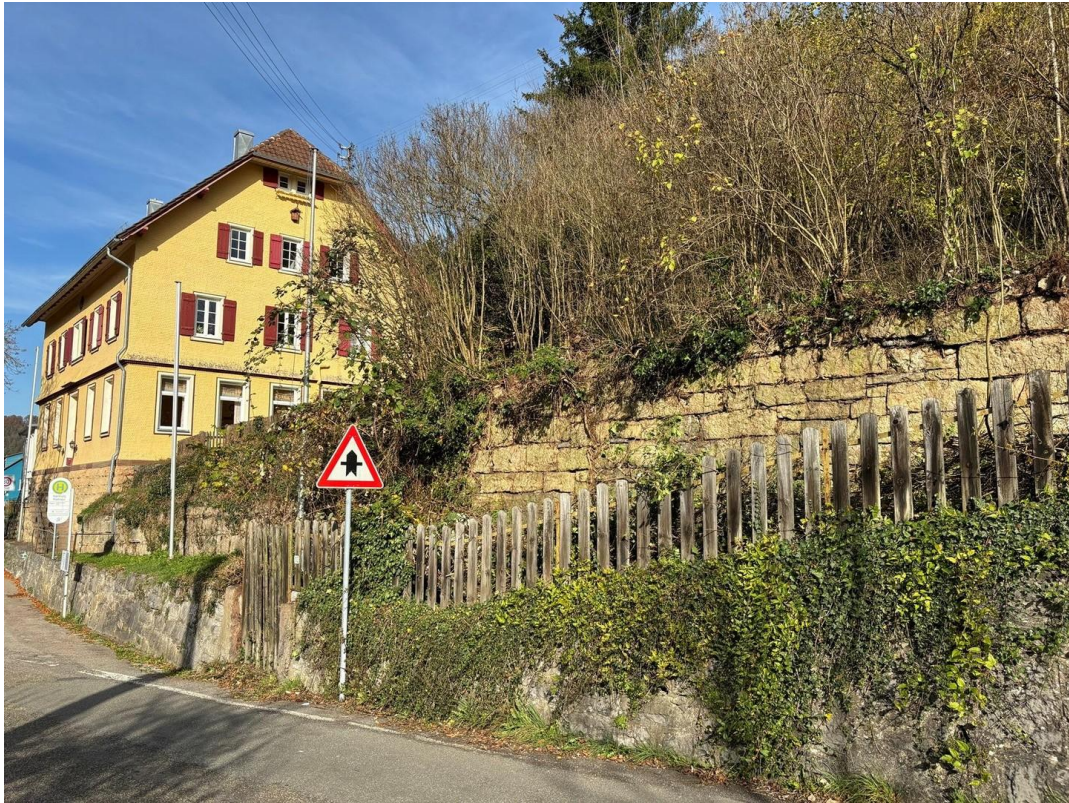
Blick zum Rathaus