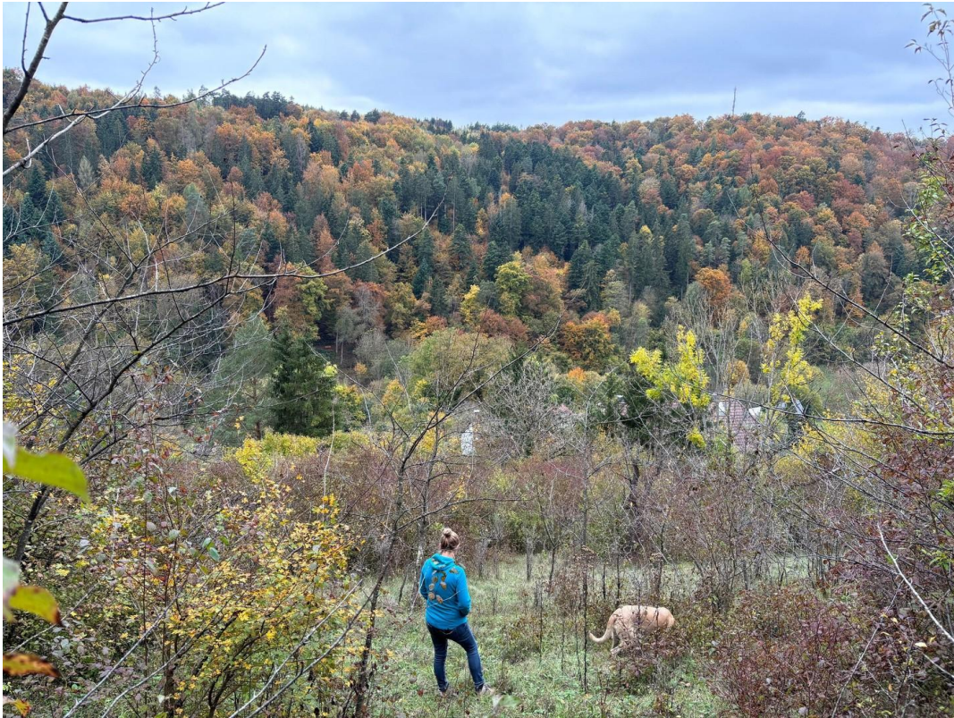
Aussicht nach Süden