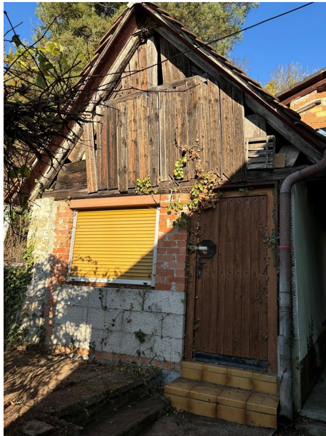
Backhaus mit Gewölbekeller