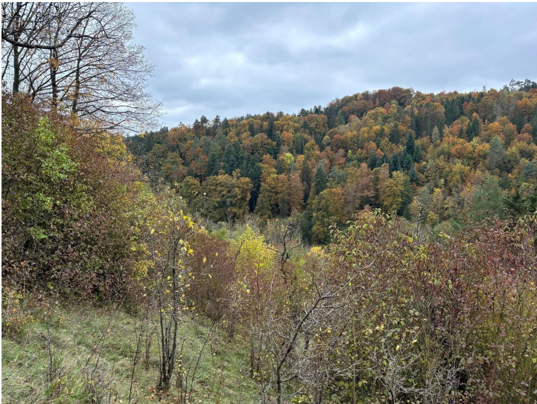
Aussicht nach Osten