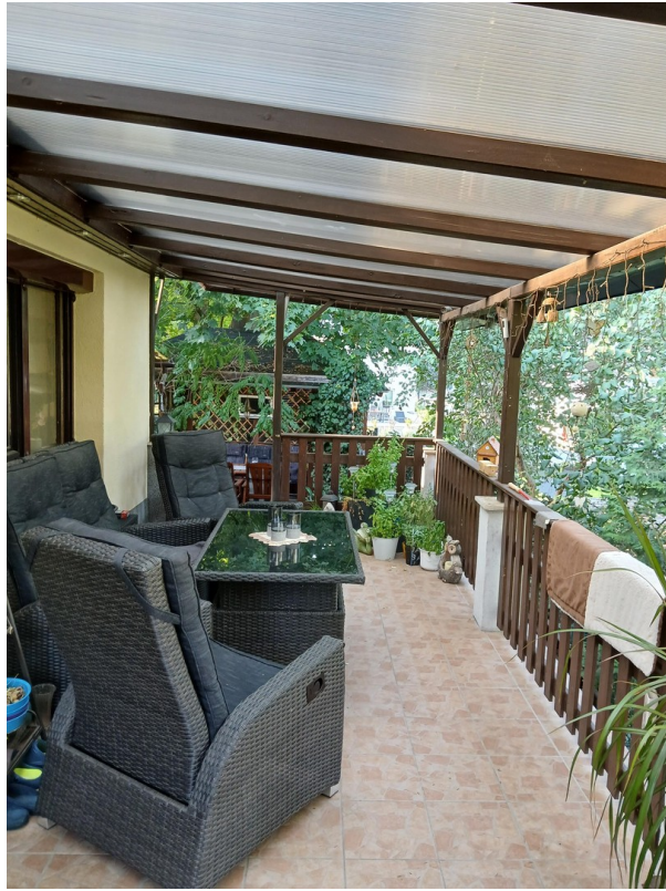
überdachte Terrasse am Haus