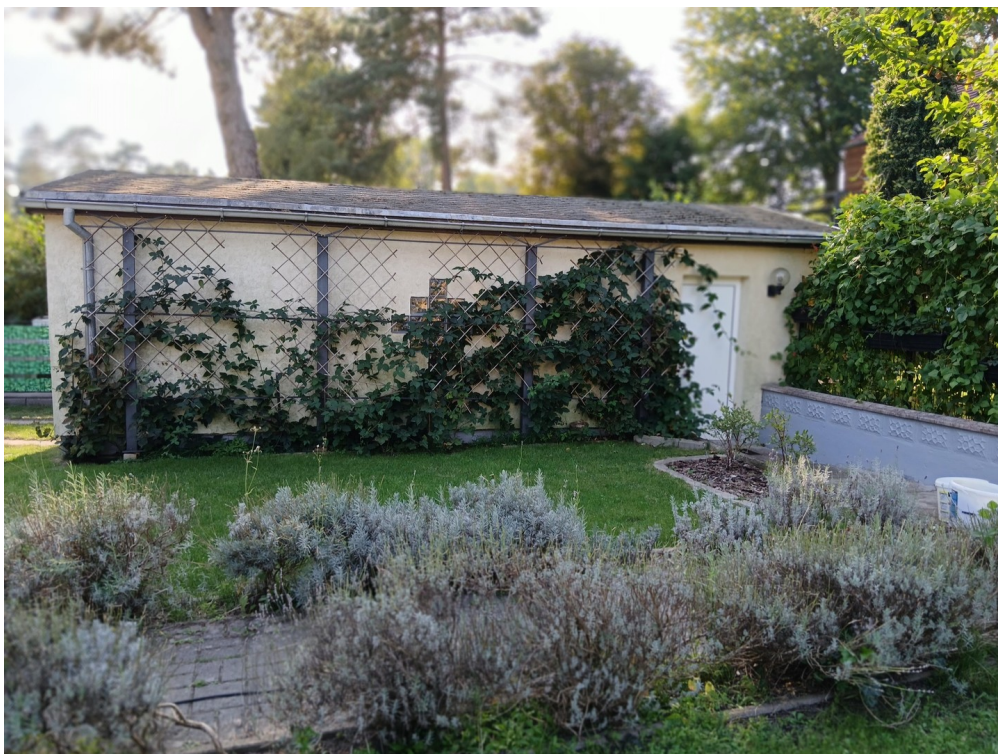
Garage mit Werkstatt