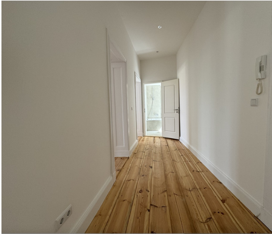
Flur mit Deckenspots