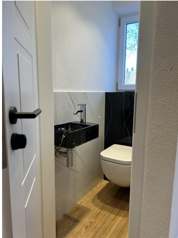
Gäste-WC im EG