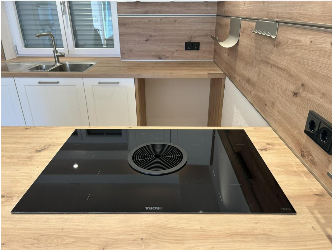
BORA-Kochfeld mit Dunstabzug