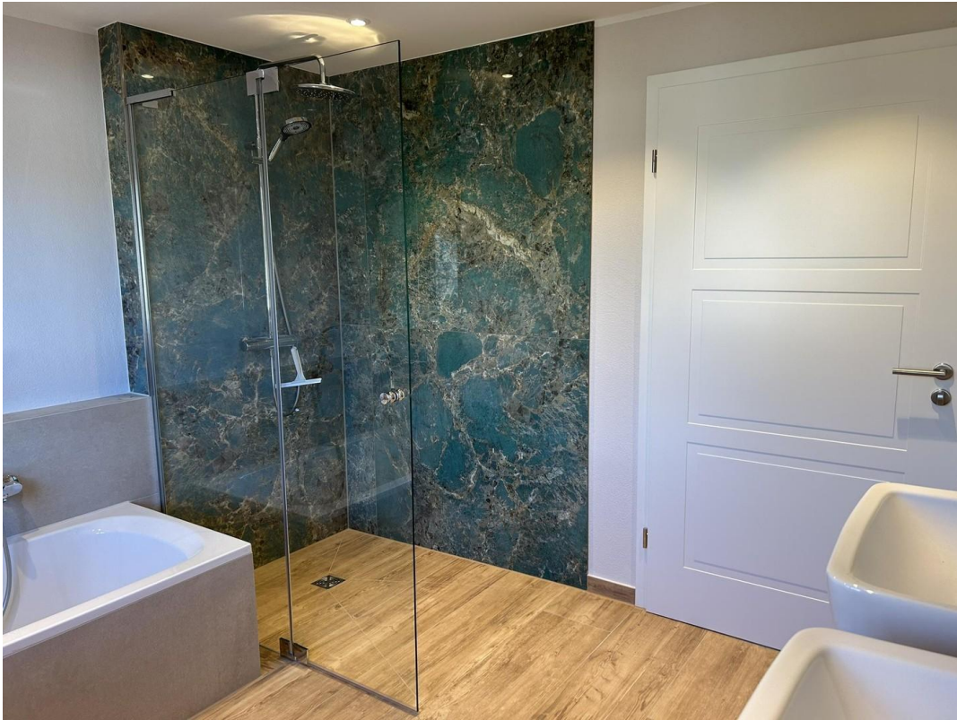
Bad OG - Wanne,WC,Bidet,DWB