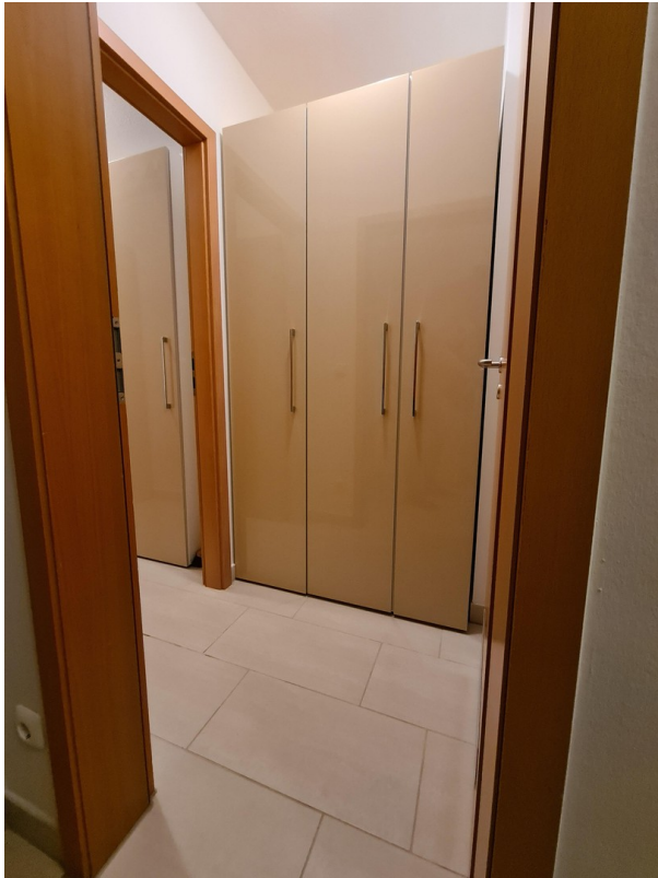
Abstellraum (vorderer Teil)