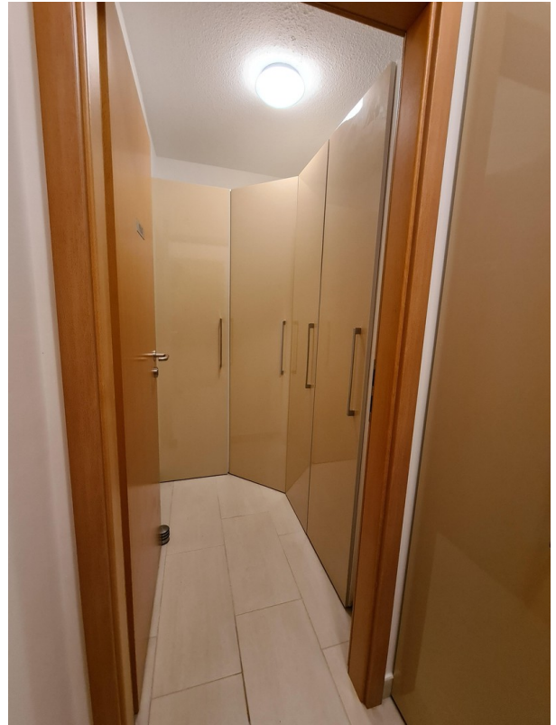
Abstellraum (hinterer Teil)