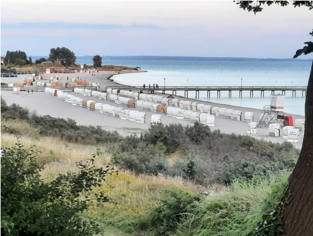
Südstrand in Pelzerhaken