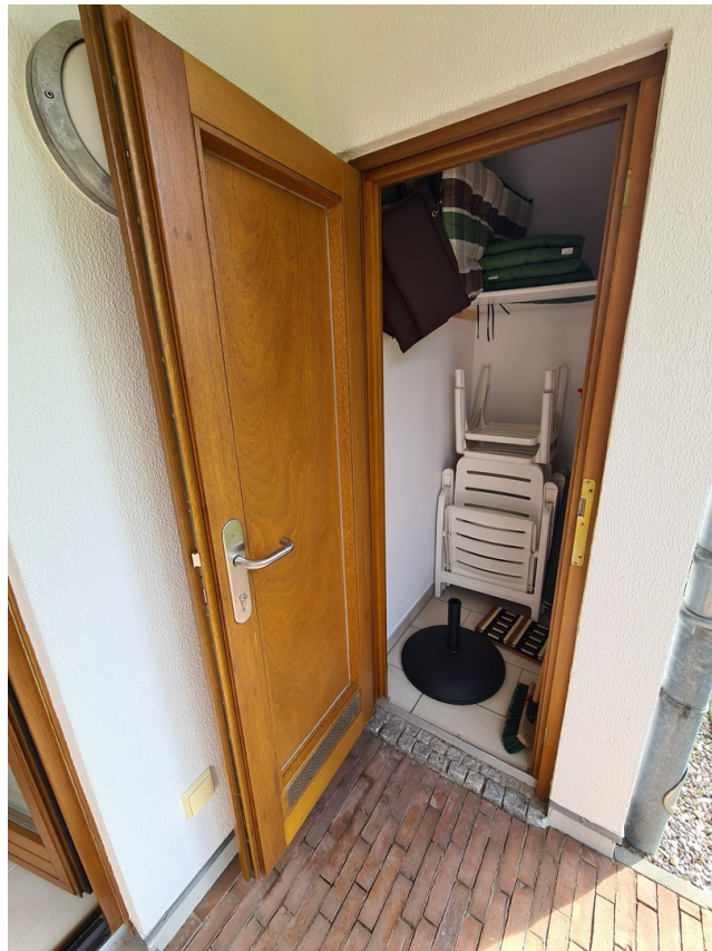
Äußerer Abstellraum Terrasse