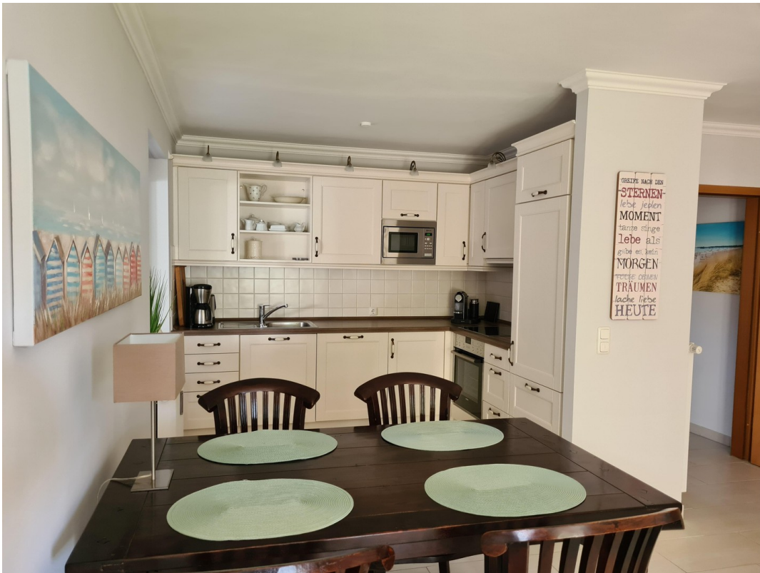
Wohnzimmer, Küche, Essplatz