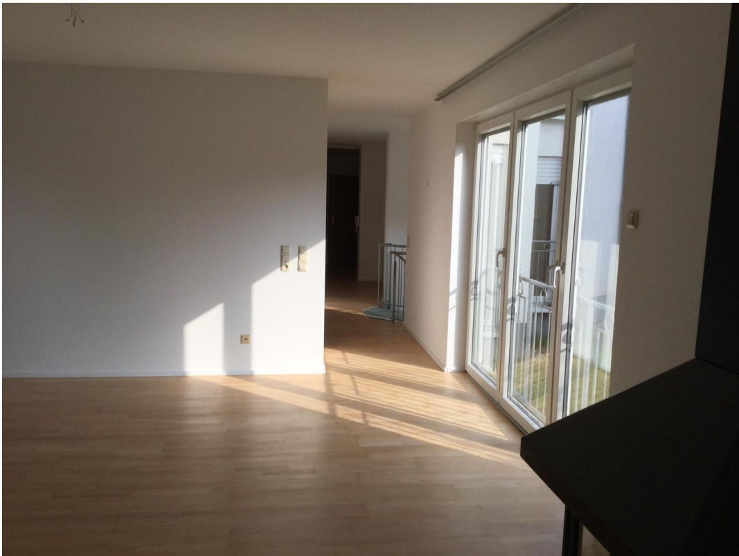
Wohnzimmer mit Flur