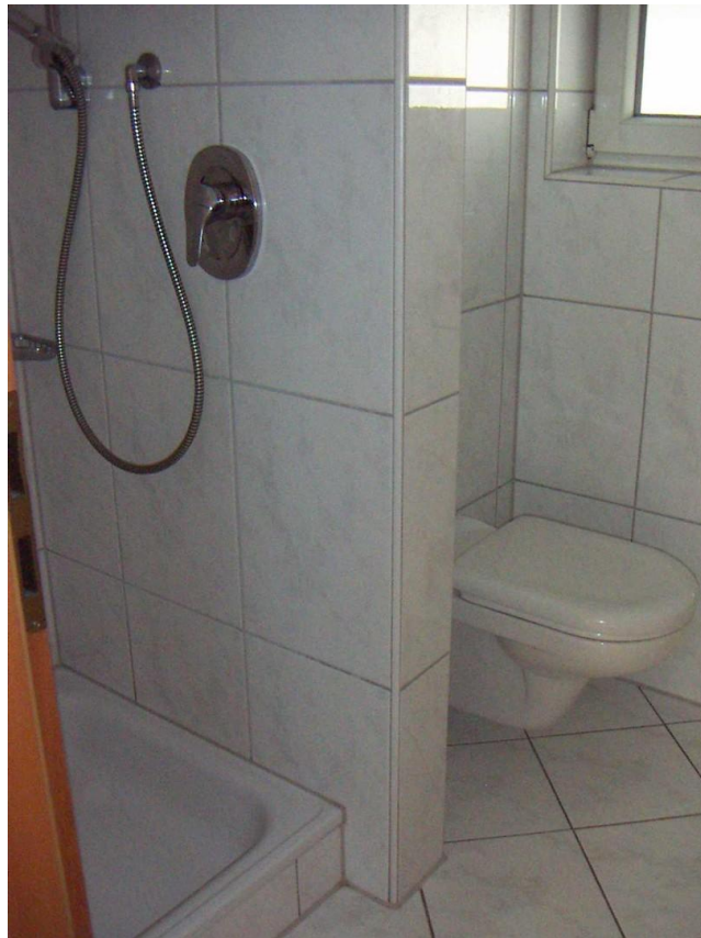
Gästebad mit Dusche