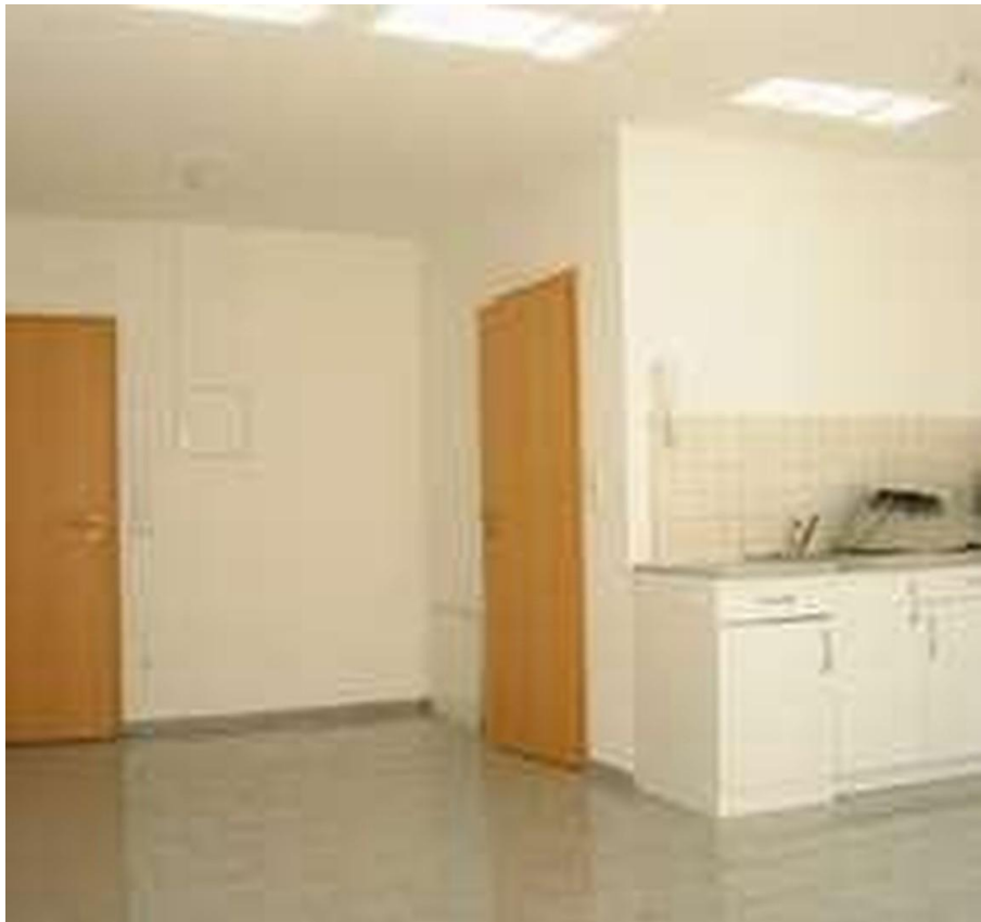
Miniküche und Eingang