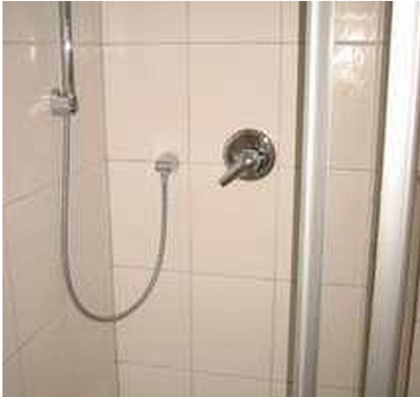
Glasdusche / Tageslicht