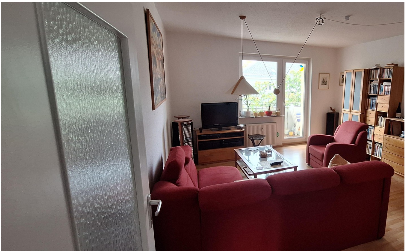
Blick ins Wohnzimmer