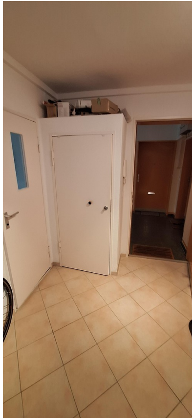
Eingang u. Abstellraum