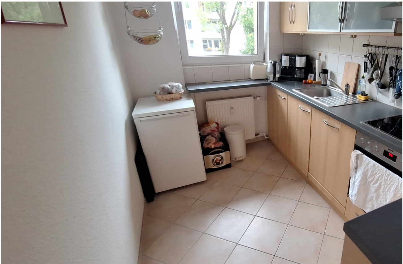
Zum Flur hin offene Küche