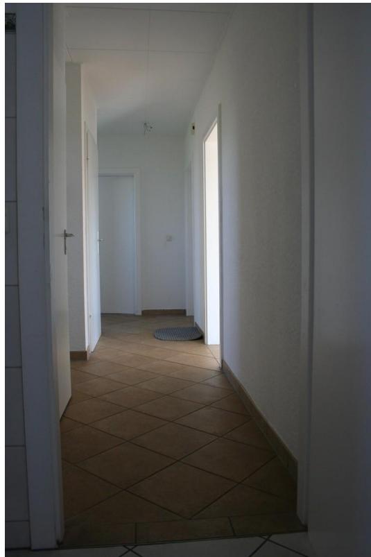
Flur aus Küche