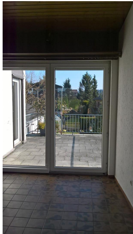
Esszimmer und Balkon