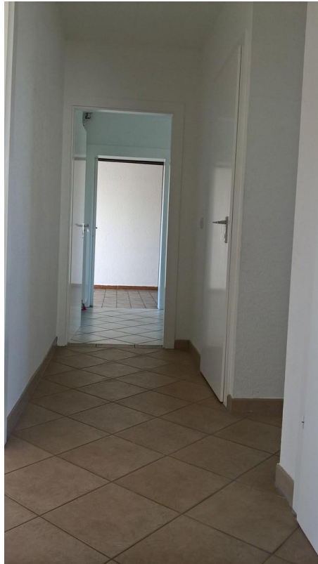
Flur in Richtung Küche