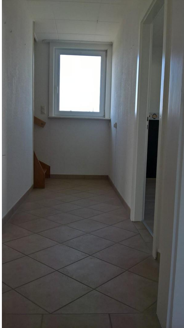
Flur in Richtung DG