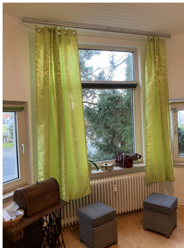
Gäste- o. Arbeitszimmer