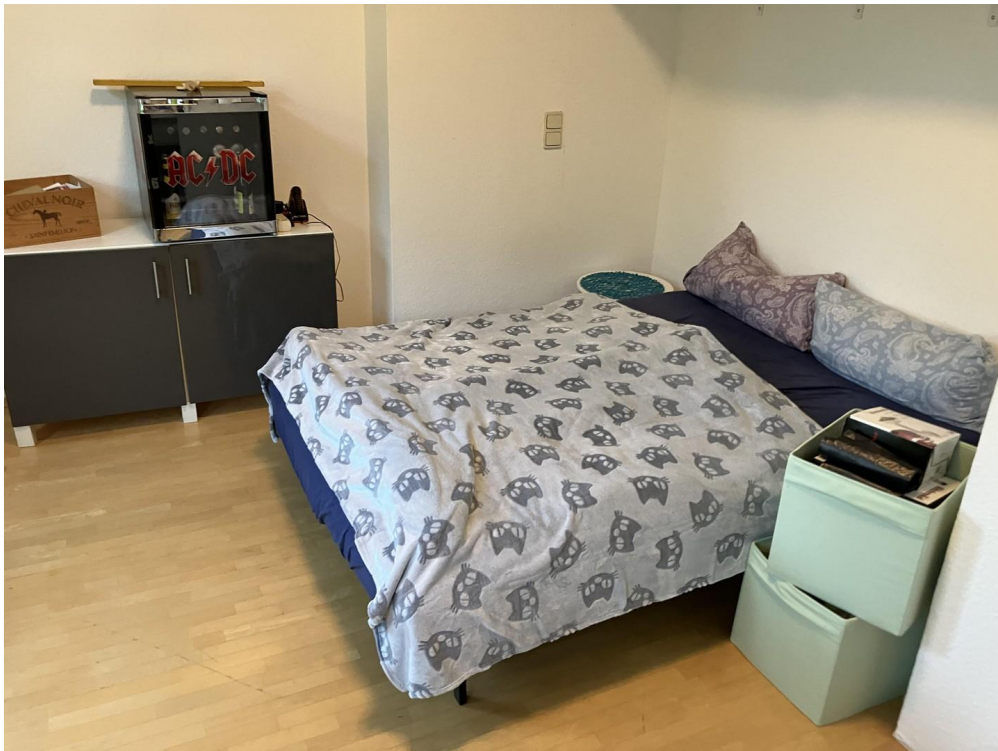
Gäste- o. Arbeitszimmer