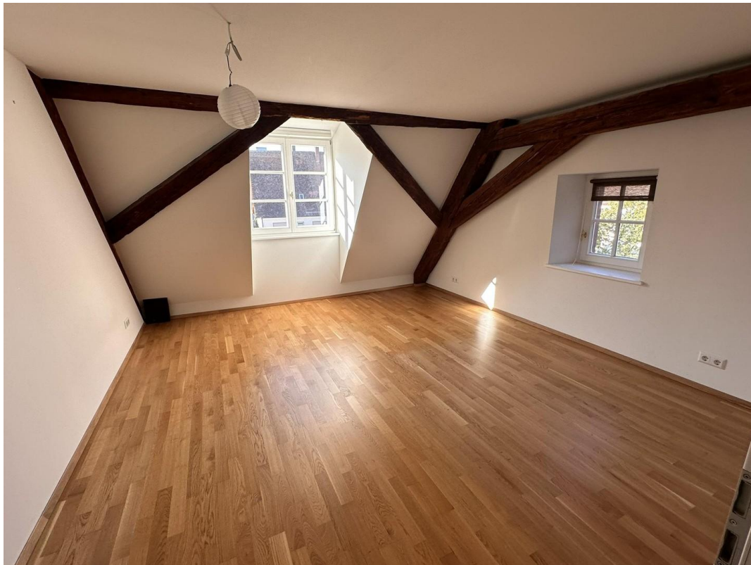
großes Zimmer 1 nach Westen