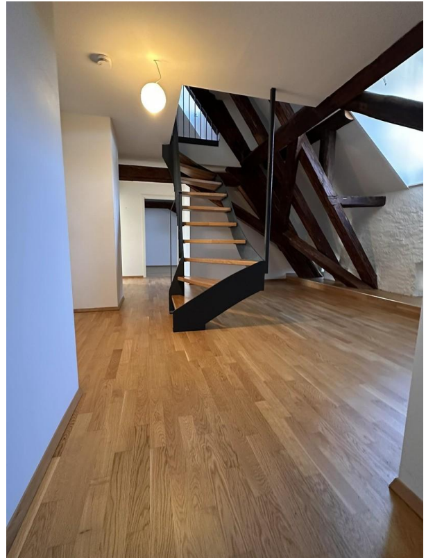
Flur mit Treppenaufgang