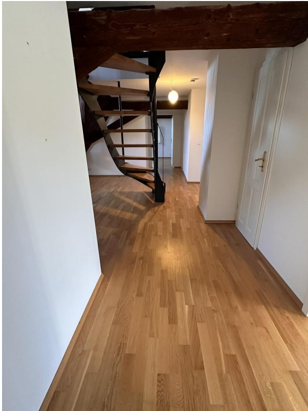
Blick in Flur von Norden