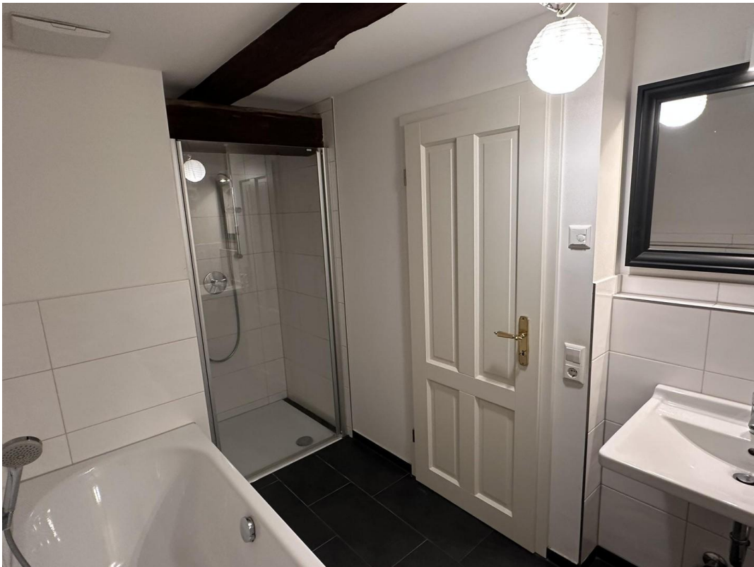
Bad und Dusche 1. Etage DG