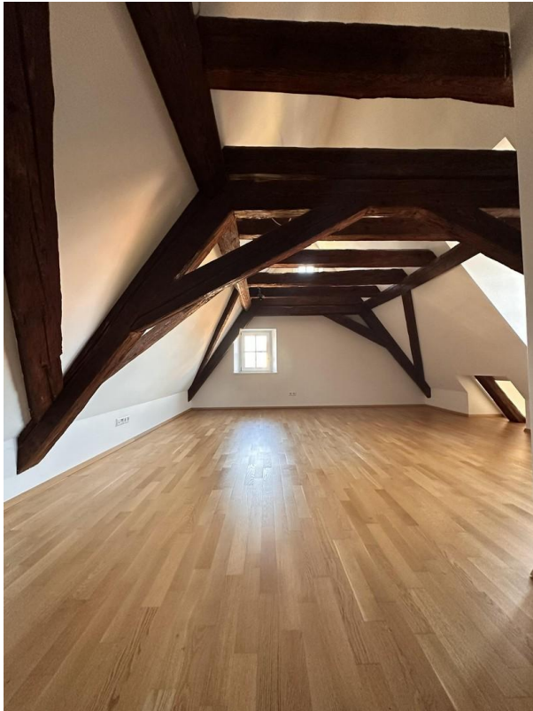
Wohnbereich 2. Etage mit Gaube