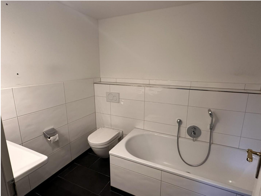
Bad 1. Etage DG