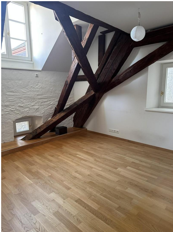
Zimmer 3 mit Gaube