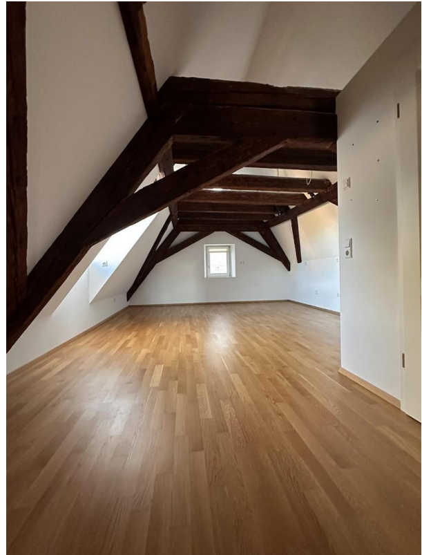
Küchenanteil o. Küchenblock