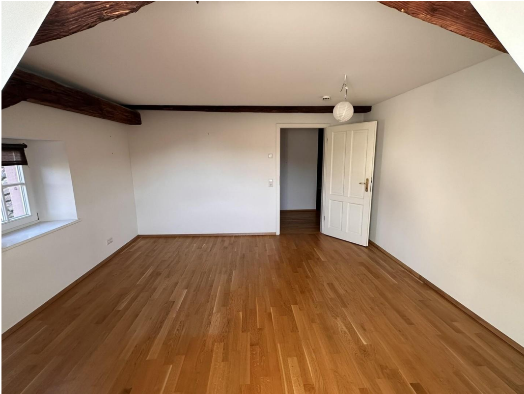
großes Zimmer Blick vom Westen