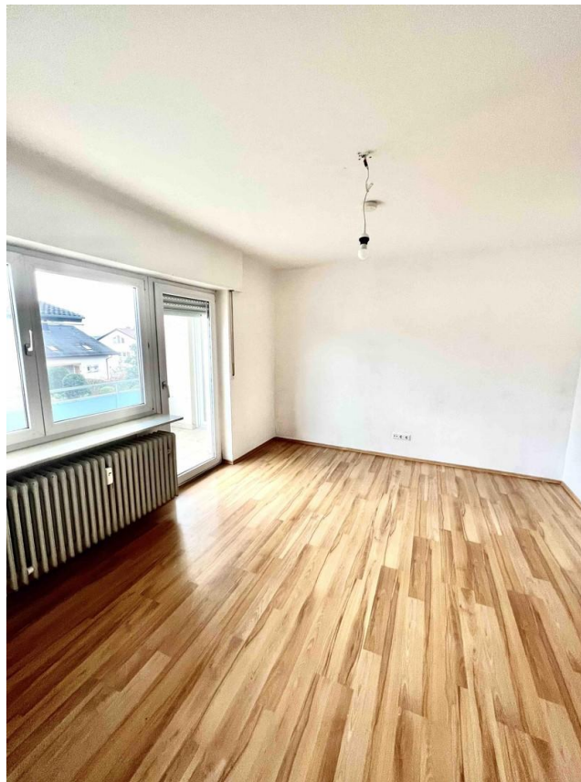
Schlafzimmer mit Balkon