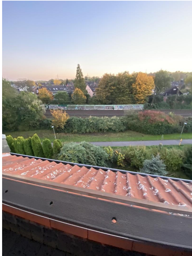
Weitblick vom Balkon