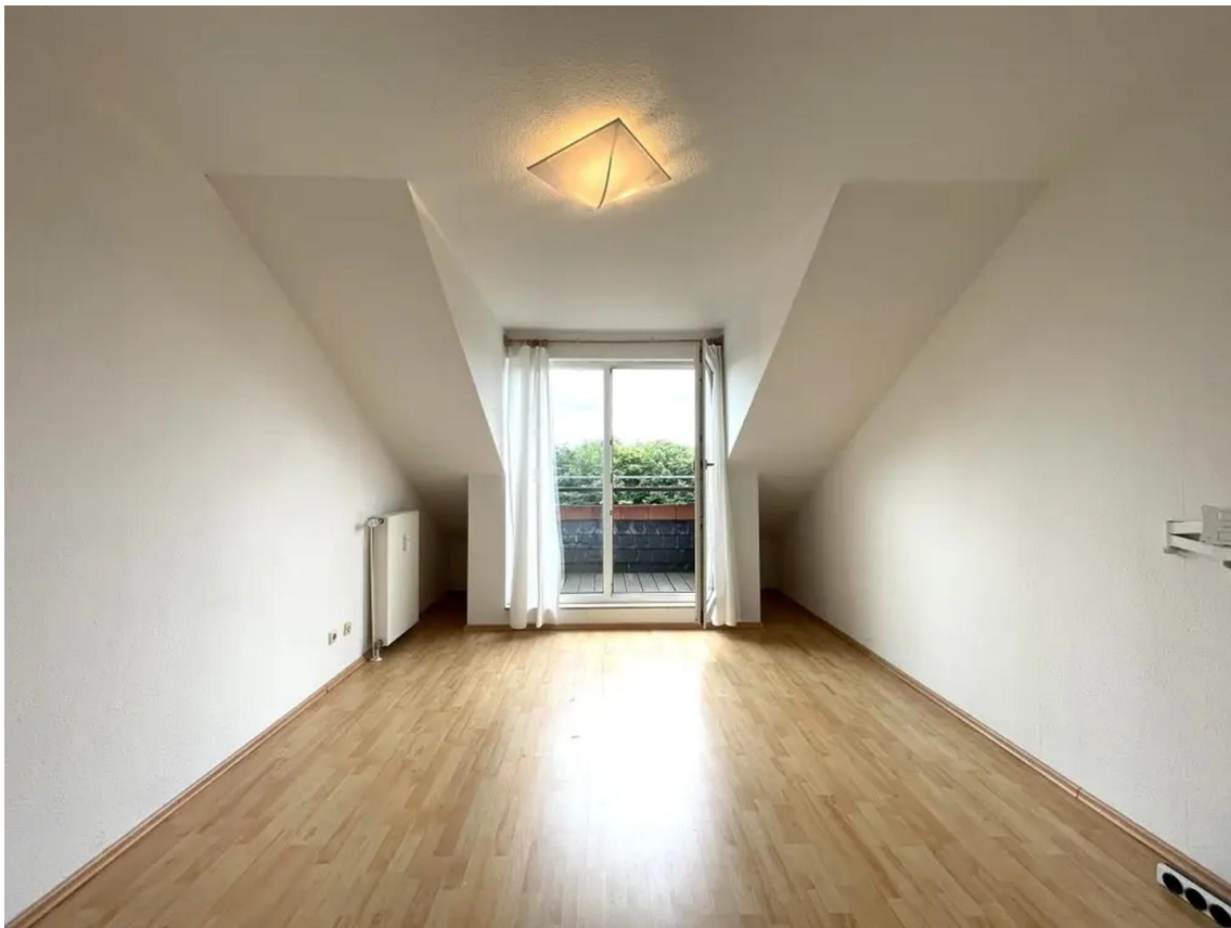
Wohnraum mit Blick zum Balkon