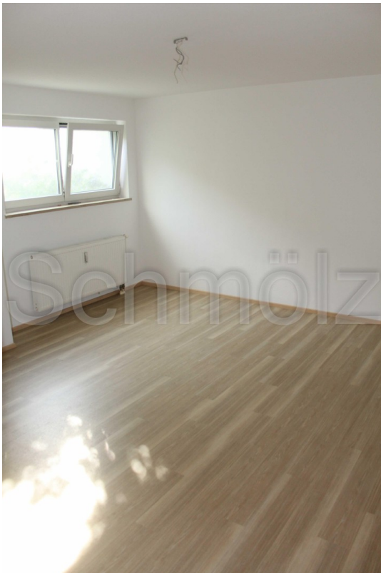
Hobbyraum / UG