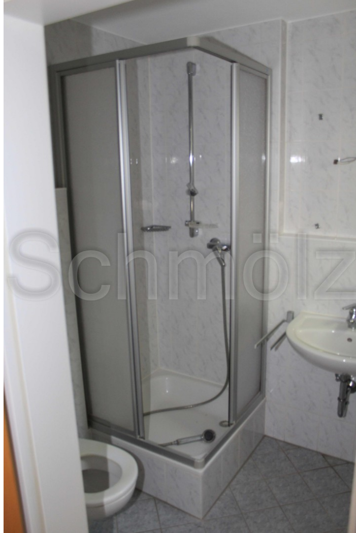
Dusche / UG