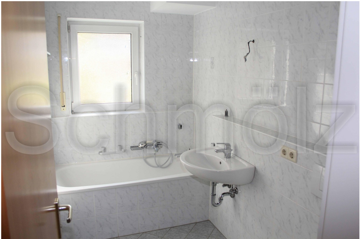
Bad / EG