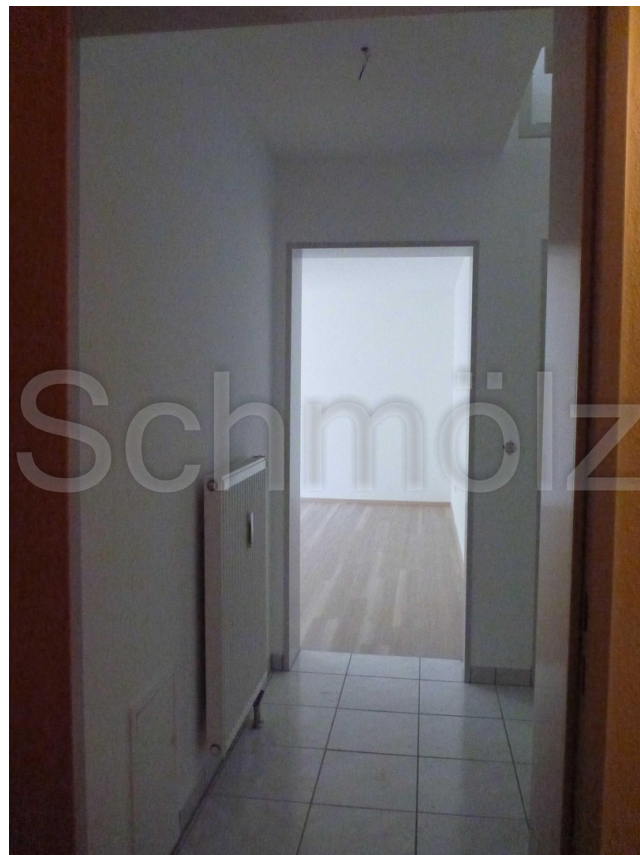
Diele / Flur